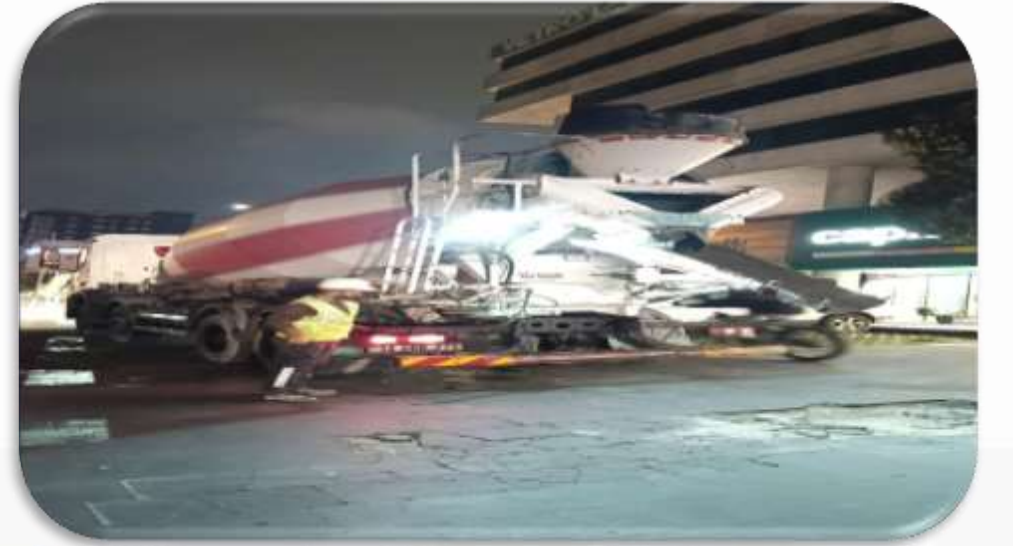
Açık otopark zemin boşluklarına beton uygulaması gerçekleştirilmiştir.