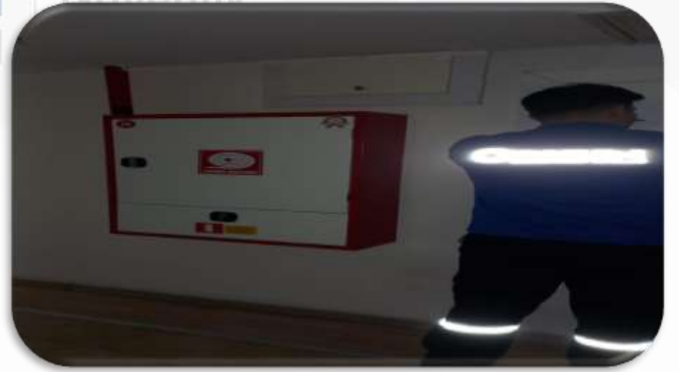
Bina geneli yangın tüp ve dolaplarının kontrolleri gerçekleştirilmiştir.