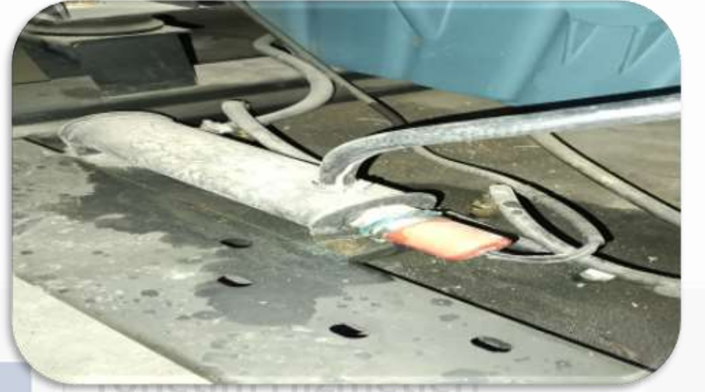
Jeneratör su ısıtıcısı değiştirilmiştir.