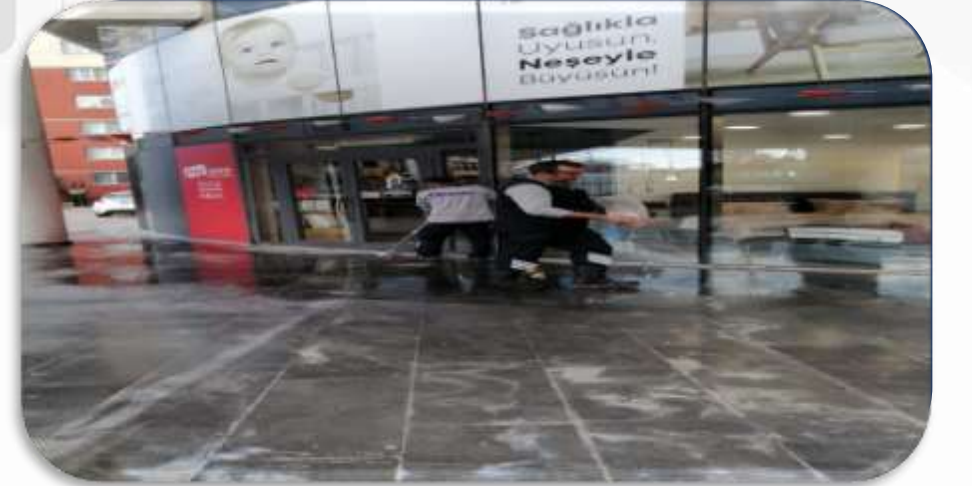
Bina giriŐlerinin zemin temizliĐi gerekleŐtirilmiŐtir.