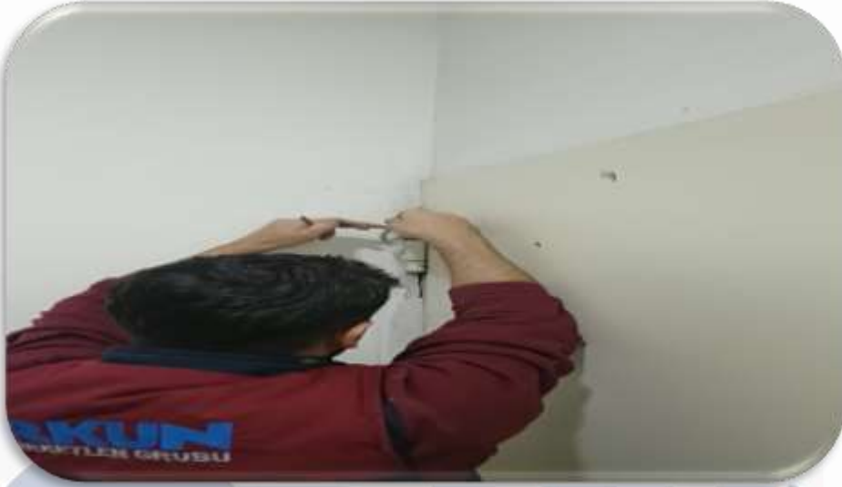
Bina geneli acil çıkış kapılarının kontrolleri gerçekleştirilmiştir.