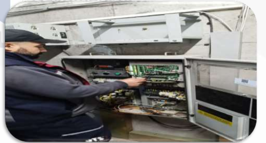
Asansörlerin aylık bakım faaliyetleri gerçekleştirilmiştir.