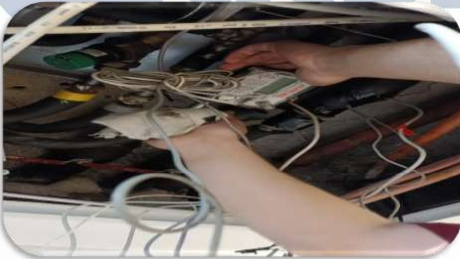
Bb ısıtma sayaç muayene işlemleri sonrası sayaç montaj çalışmalarına devam edilmiştir.