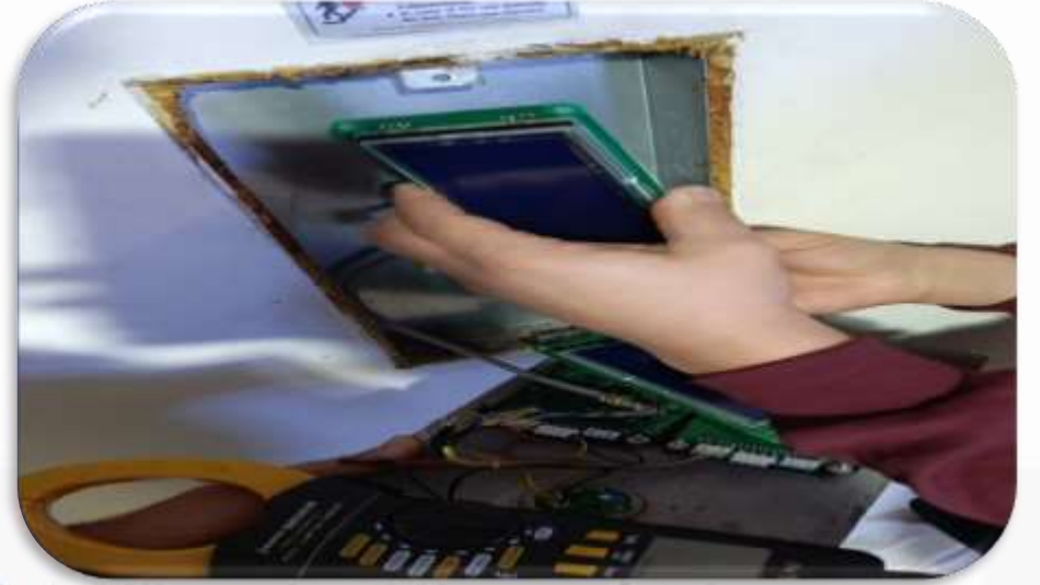
Bina geneli asansör çağrı ekranlarının kontrolleri gerçekleştirilmiştir.