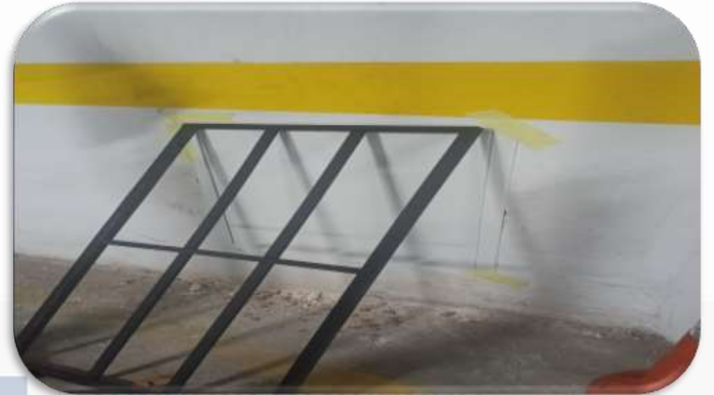
-1 kat yağmur hattı onarımı için kırılan duvara müdahale kapağı takılmıştır.