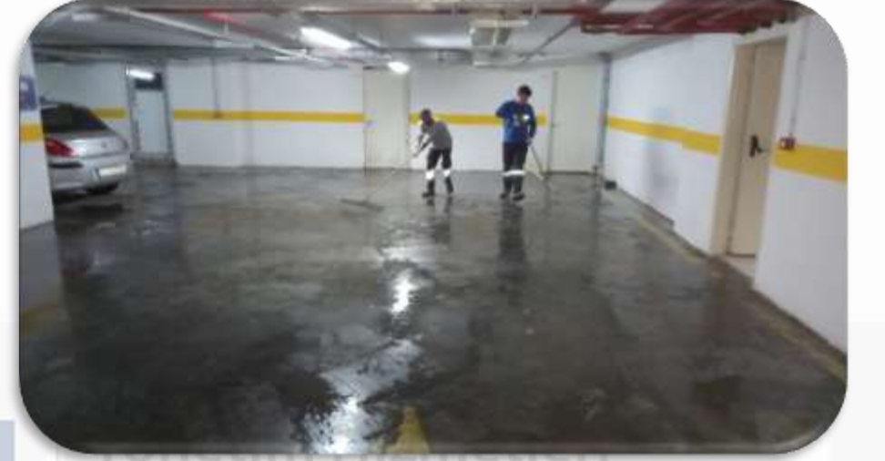
Kapalı otopark zemin temizliĐi gerekleŐtirilmiŐtir.