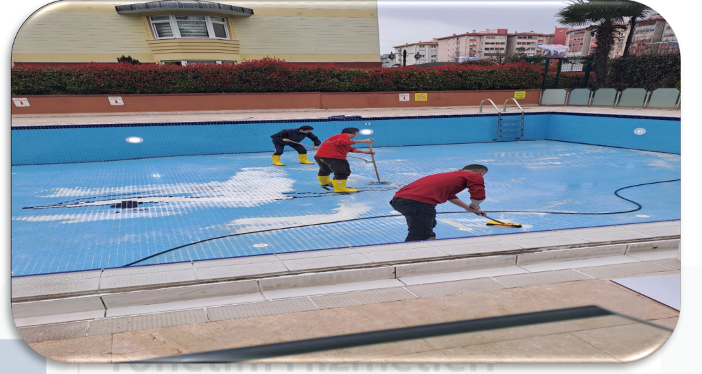
Gayrimenkul Havuz ii asit ile yıkanmıřtır.