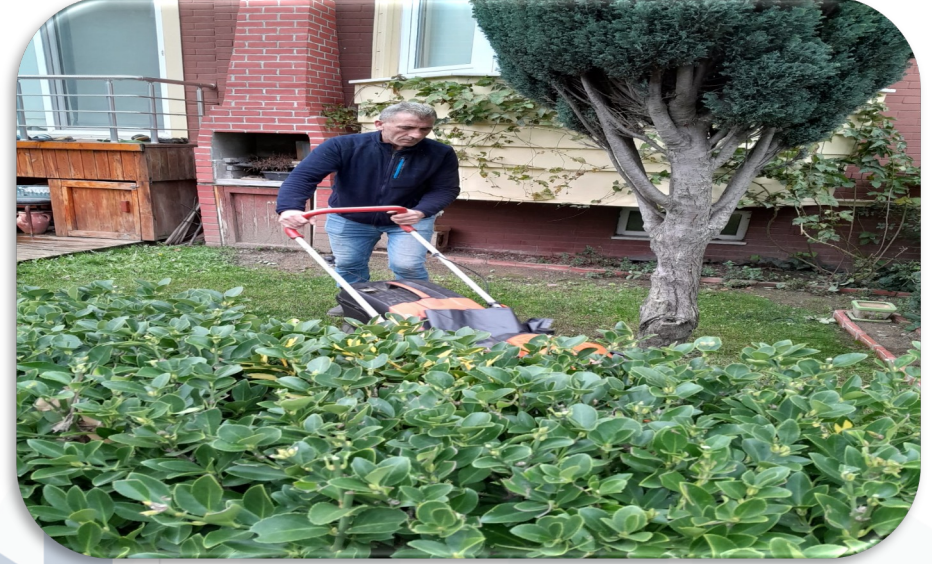
Site geneli çim biçme işlemleri yapılmaktadır.