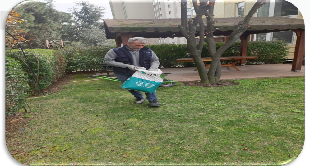
Toprak ve çim tohumu alınarak site genelinde ara ekim çimlenmesi yapılmıştır.