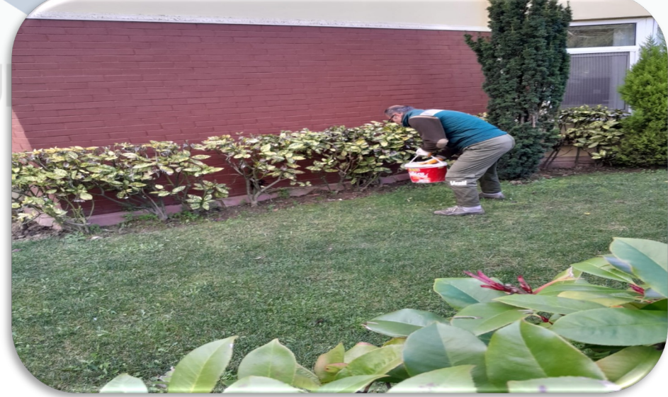
Site geneli tüm bahçelere gübreleme işlemi yapılmaktadır.