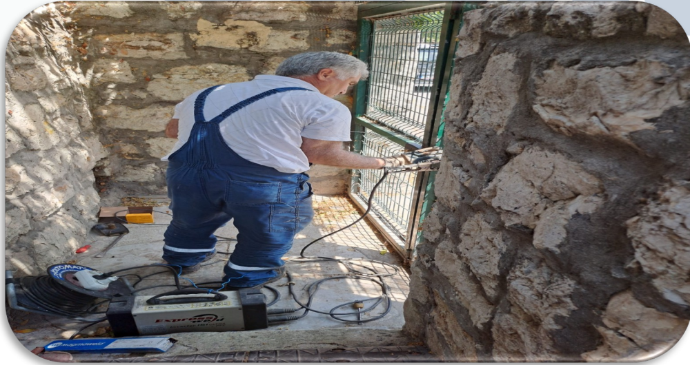
Site geneli tamirat iřlemleri yapılmaktadır.