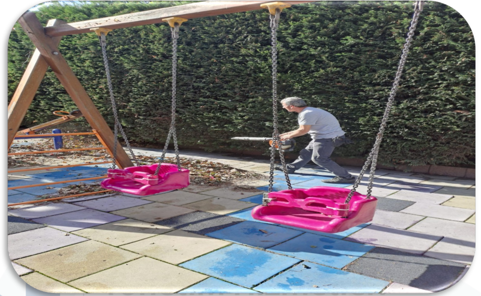
Site geneli peyzaj mıntıkası yapılmaktadır.