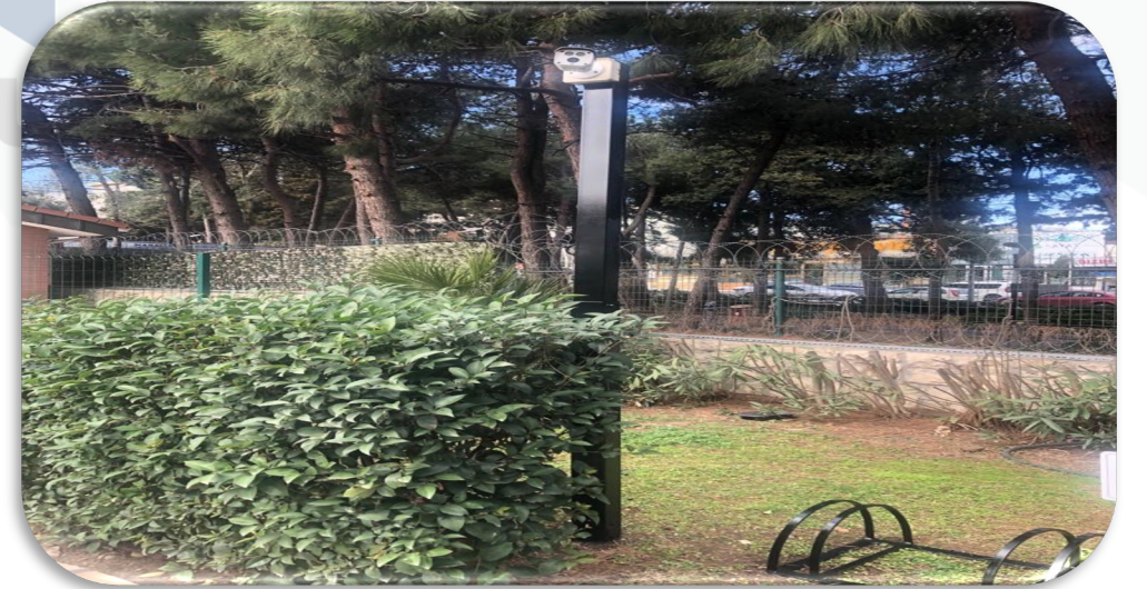
Kamera direkleri boyanmıřtır.