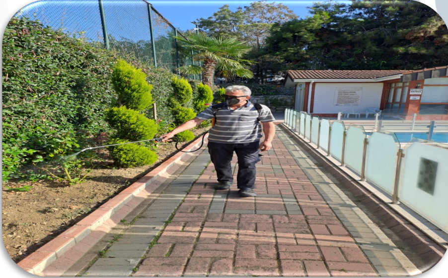
Sitede bulunan tüm bitkilerin ilaçlanma işlemi yapılmaktadır.