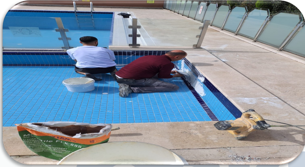
Havuz mangal ve lamba deęiřimi yapılmaktadır.