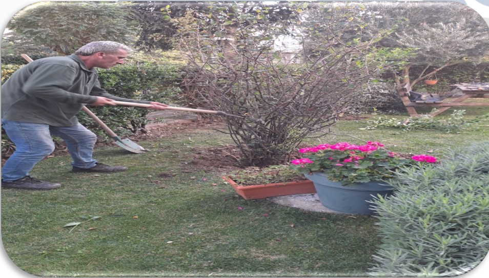
Kurumuş ağaç kesme işlemleri yapılmaktadır.