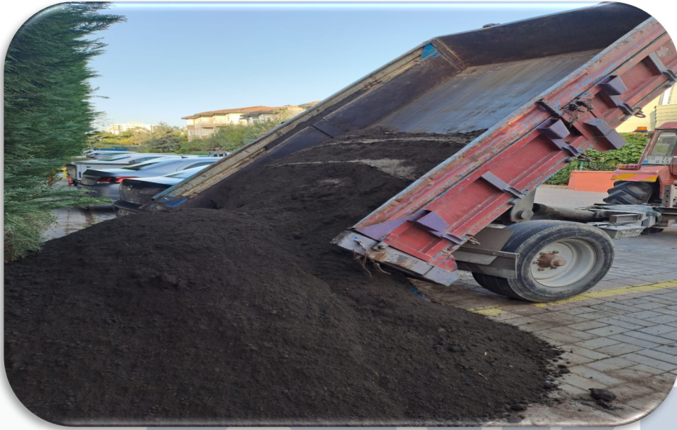
Site geneli ağaç diplerine gübreli toprak takviyesi yapılmıştır.