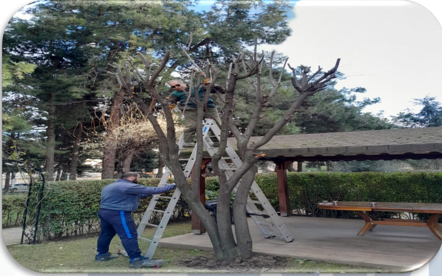
Site geneli ağaç budama işlemleri yapılmaktadır.