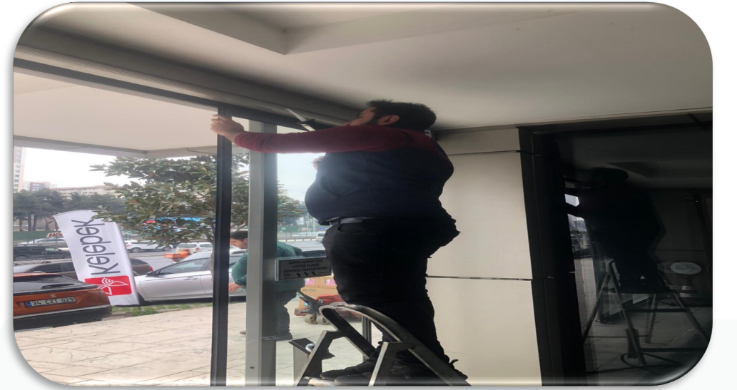
Bina giriş kapılarının periyodik bakımları gerçekleştirilmiştir.