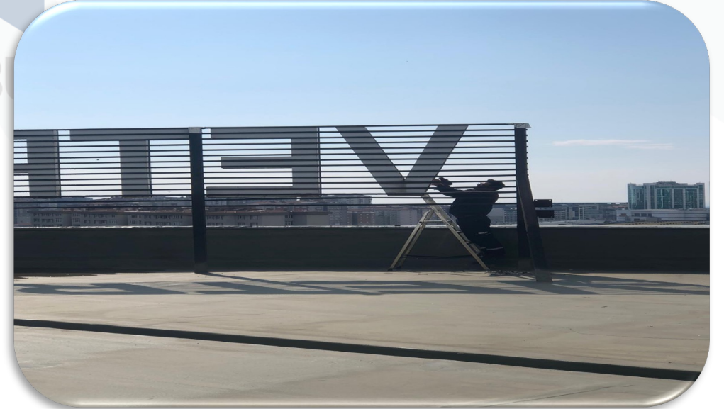
Çatıdaki ışıklı tabelanın "V" harfi trafo arızası giderilmiştir.