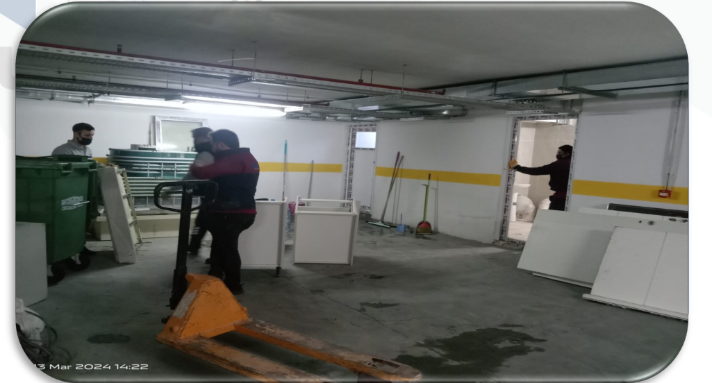
Teknik depoların temizliği gerçekleştirilmiştir.