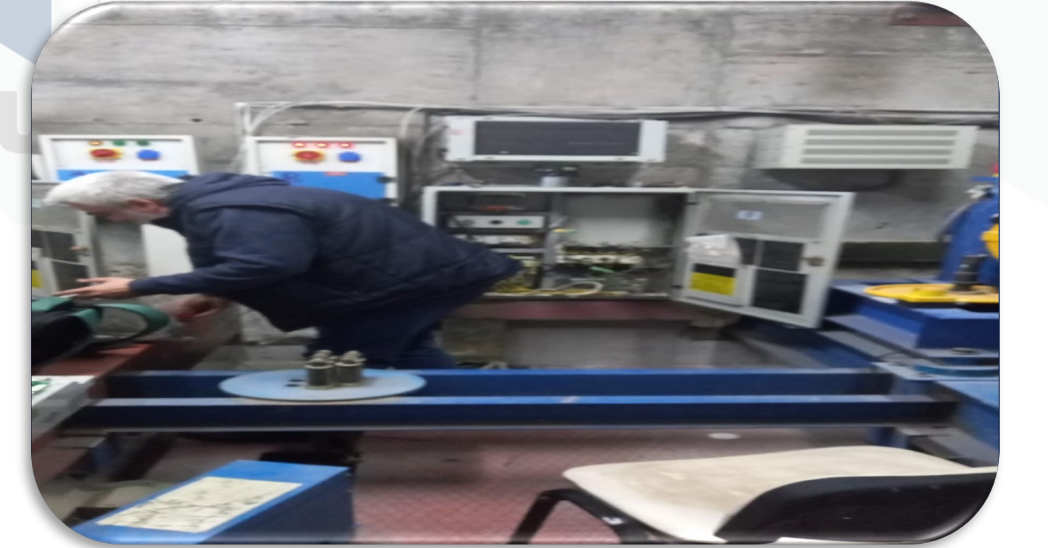
A Blok sağ asansör sürücü arıza kontrolleri gerçekleştirilmiştir.