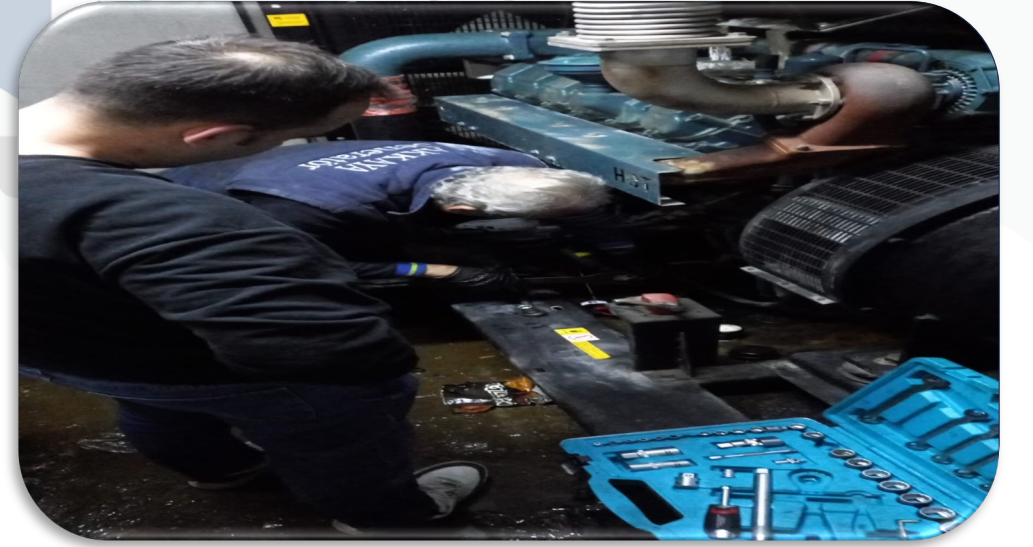
Jeneratör arızaları giderilmiş ve malzemeli bakımları gerçekleştirilmiştir.