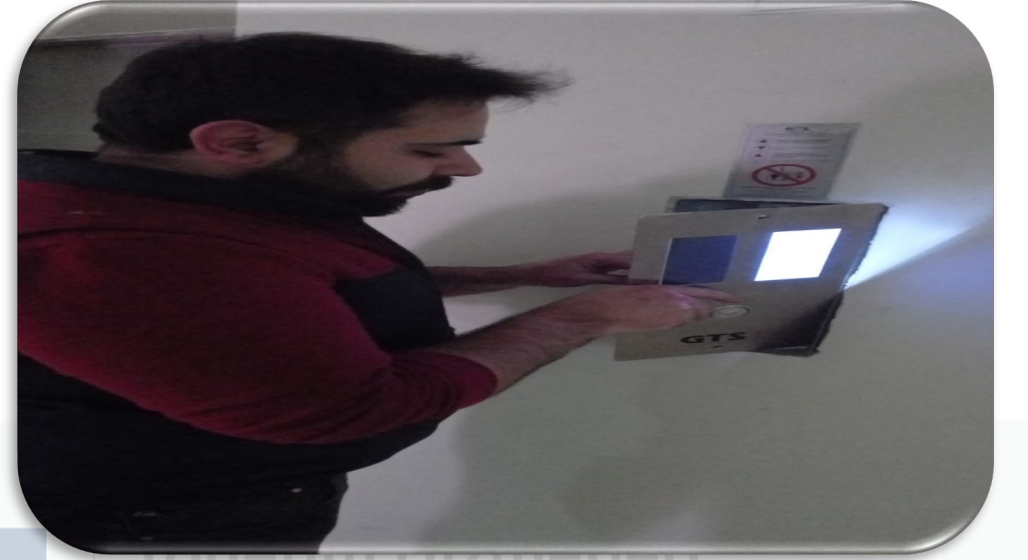
Asansörlerin kat aėrı led ekran hasar kontrolleri gerekleŒtirilmiŒtir.