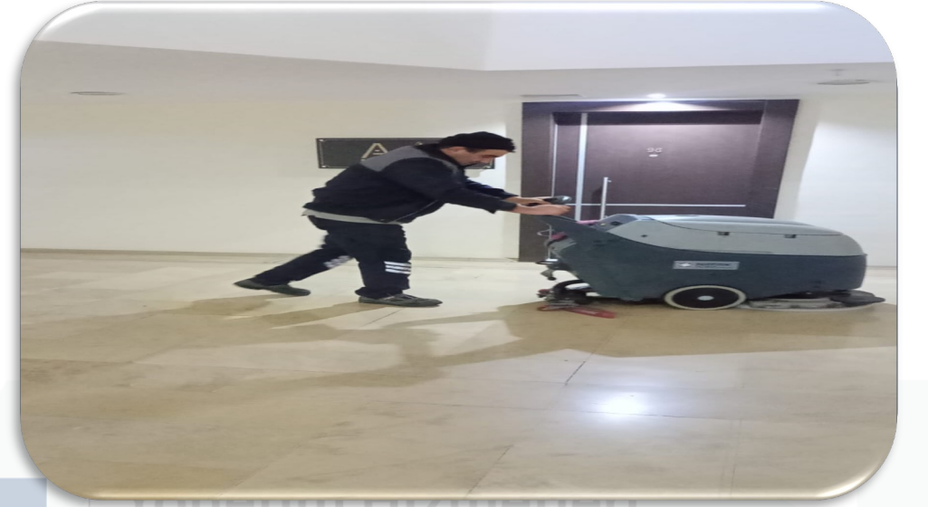
Zemin otomatı ile kat temizliği gerçekleştirilmiştir.