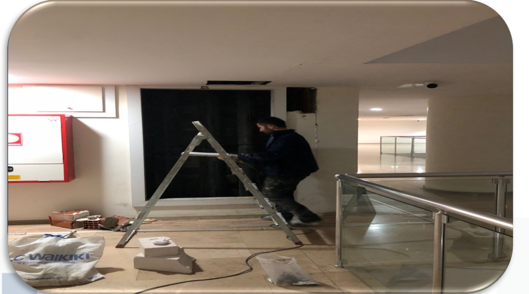
Isıtma sistemi sıcak su dönüş hattı kaçıkları sonrası oluşan hasarlar giderilmiştir.