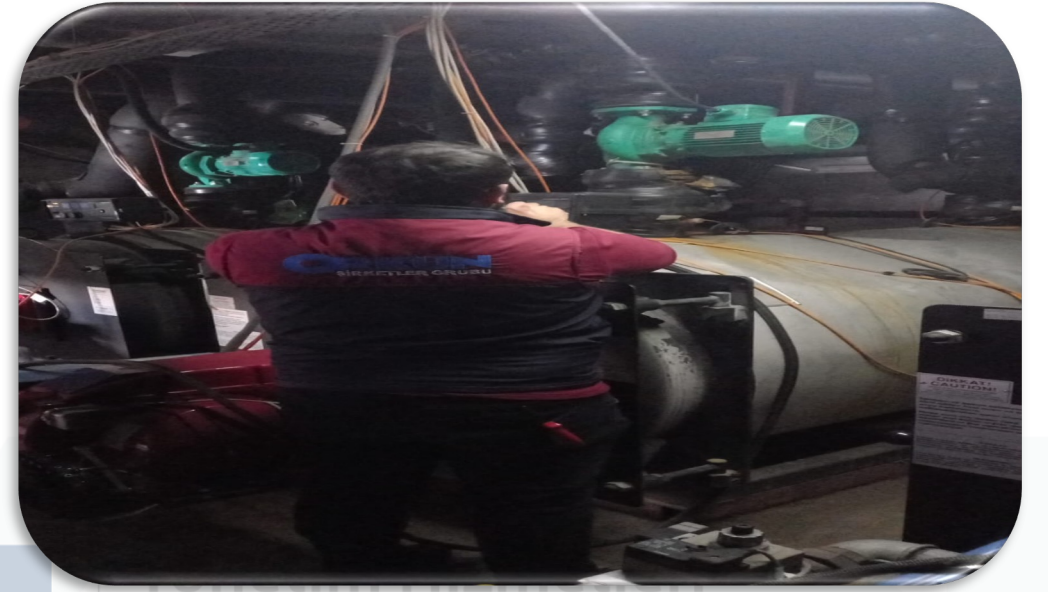
Isıtma Sistemi periyodik kontrolleri gerçekleştirilmiştir.