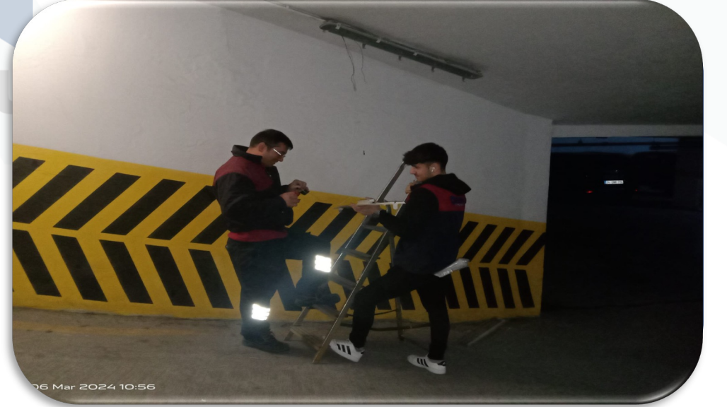
Bina geneli arızalı aydınlatma kontrolleri gerekleŒtirilmiŒtir.