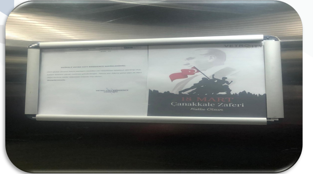
Dönemsel daire sakini bilgilendirme duyuruları hazırlanmış ve duyuru panolarına asılmıştır.