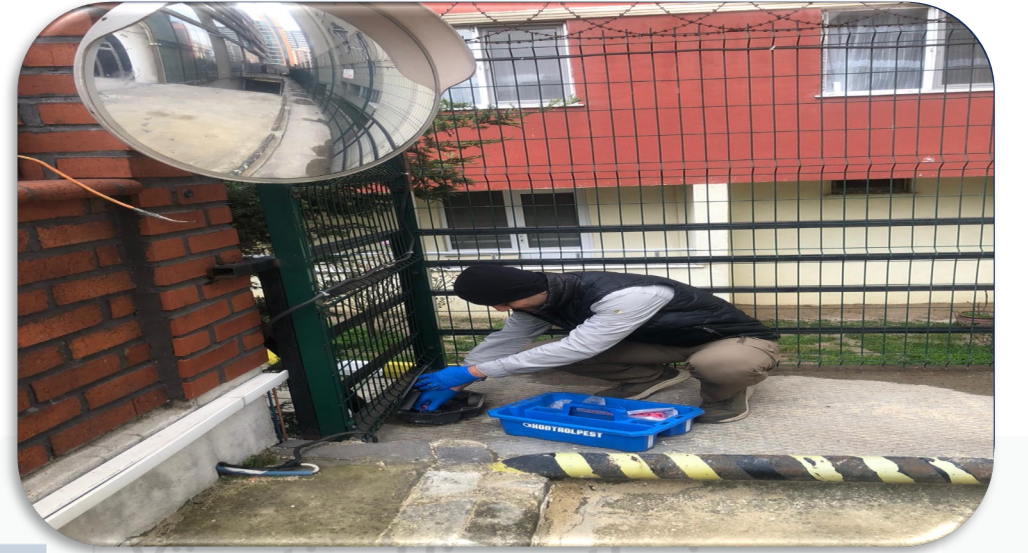
Yönetim Hizmetleri Gayrimenkul Periyodik ortak alan ilaçlama faaliyeti gerçekleştirilmektedir.