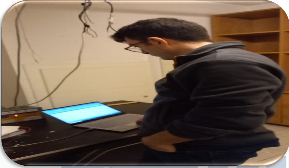
Bb süzme sayaç endeks okumaları gerçekleştirilmiştir.