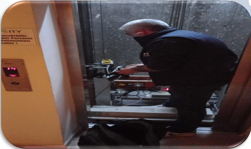
Asansörlerin aylık bakım faaliyeti gerçekleştirilmiştir.