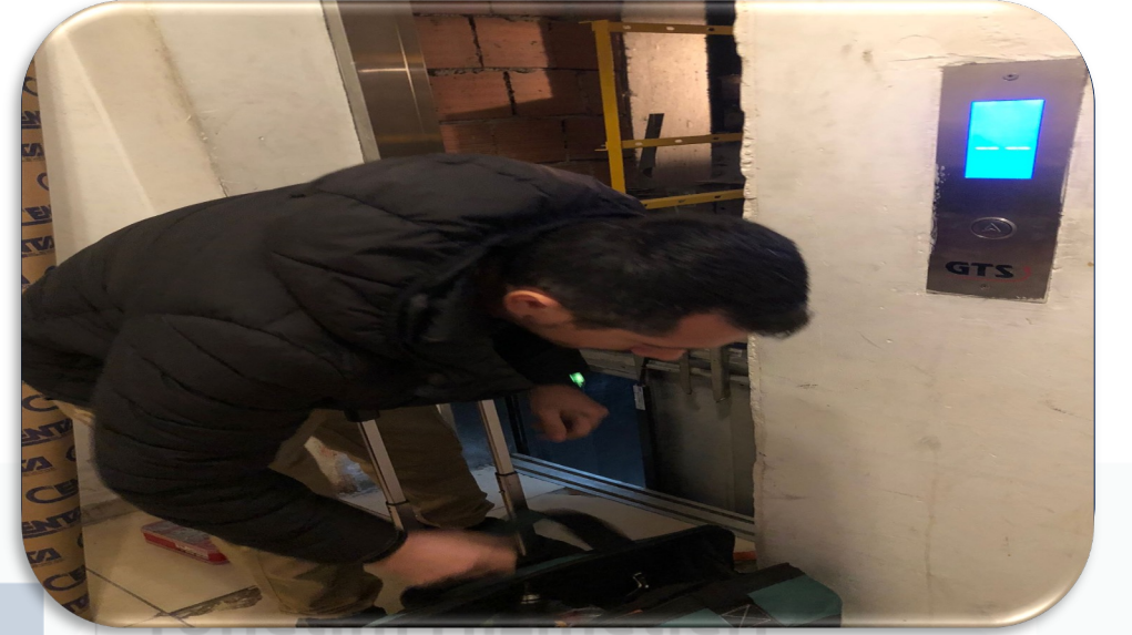
A Blok yük asansörü fotosel değişimi gerçekleştirilmiştir.