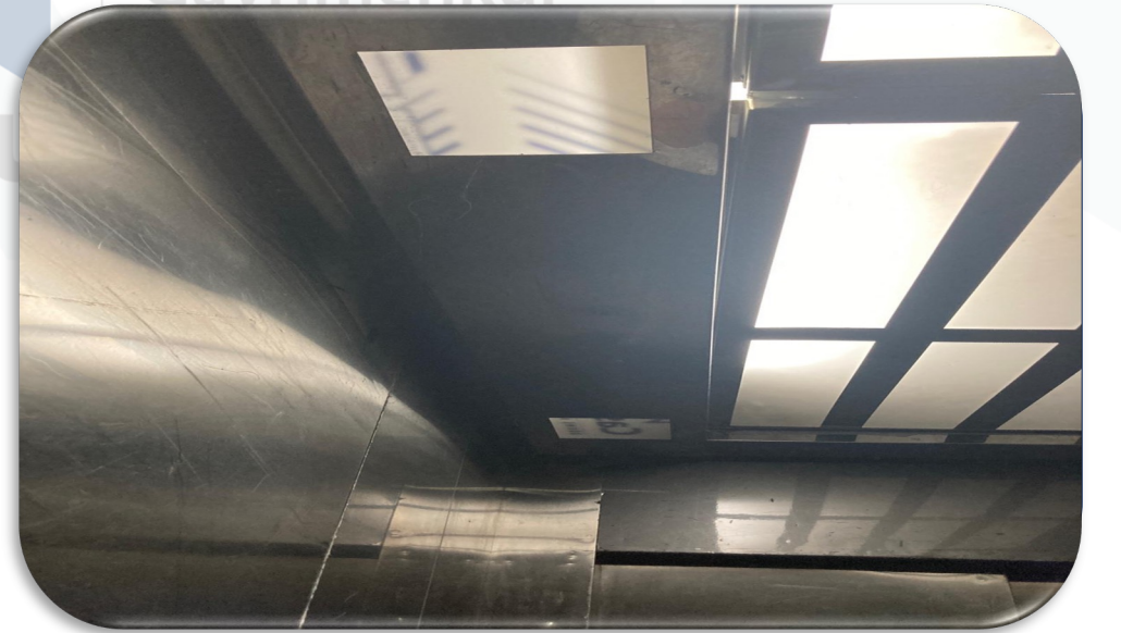
Asansr tavan pleksi levhaları yenilenmiŒtir.