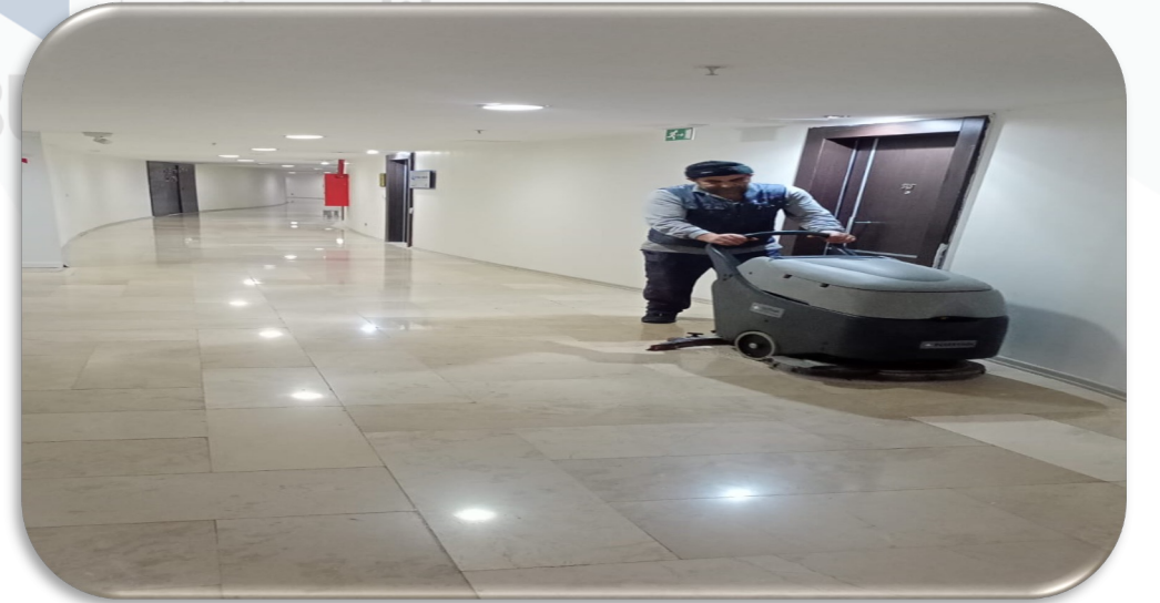
Ortak alan zemin temizliđi gerekleřtirilmiřtir.