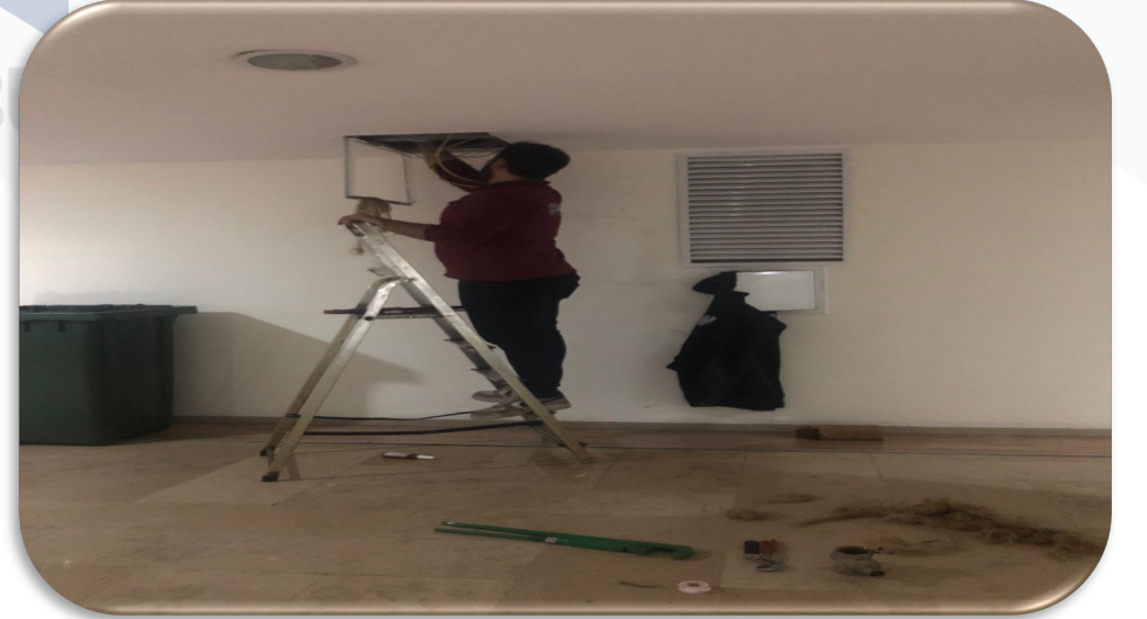
6.Kat ortak alan su hattı basınç düşürücü değişimi gerçekleştirilmiştir.