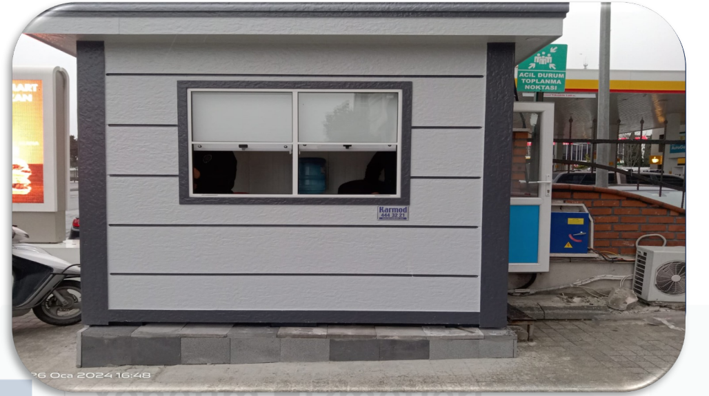
Yeni güvenlik kabini alınmıştır.