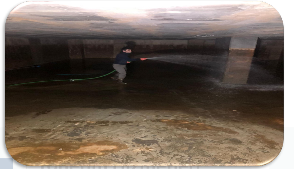
Kullanım suyu depo temizliėi gerekleŒtirilmiŒtir.