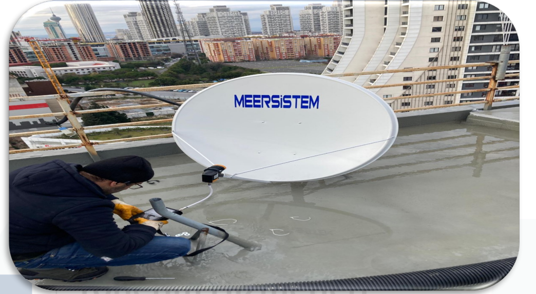
Uydu sistemi anten değişimi gerçekleştirilmiştir.