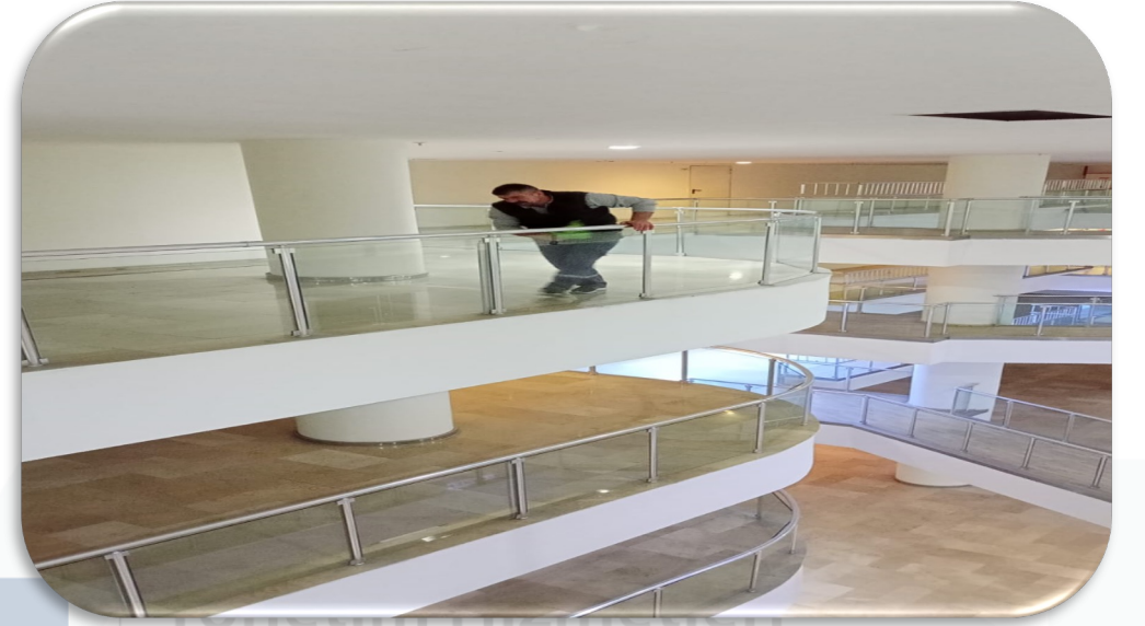
Ortak alan cam temizliđi gerekleřtirilmiřtir.