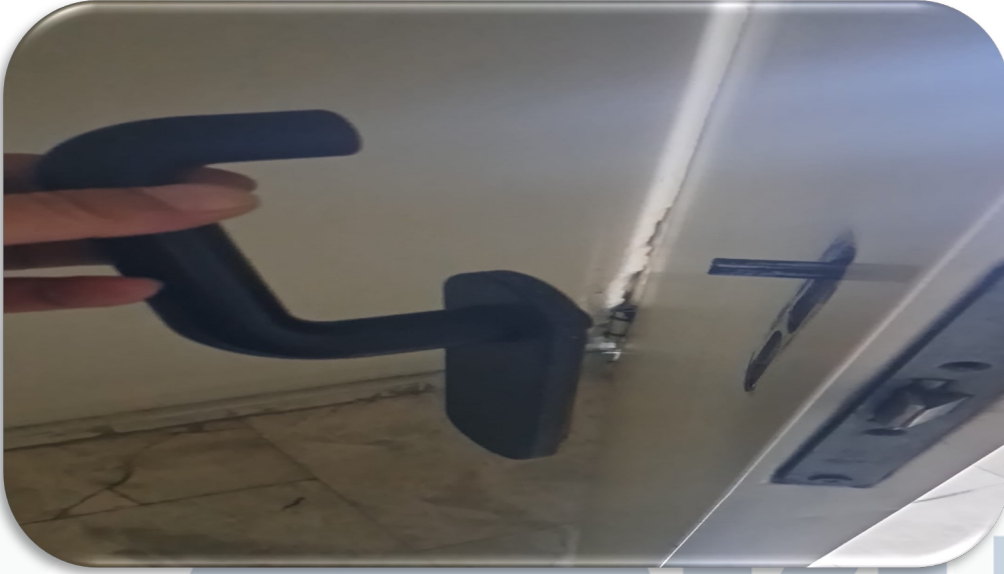
Bina geneli acil çıkış kapılarının hasar kontrolleri gerçekleştirilmiştir.