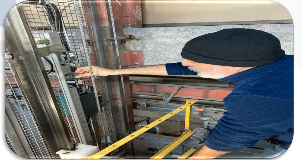
Asansörlerin aylık bakım faaliyeti gerçekleştirilmiştir.