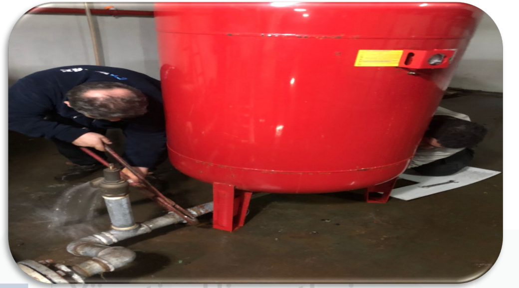
Hidrofor sistemi genişleme tankı mebranı değiştirilmiştir.