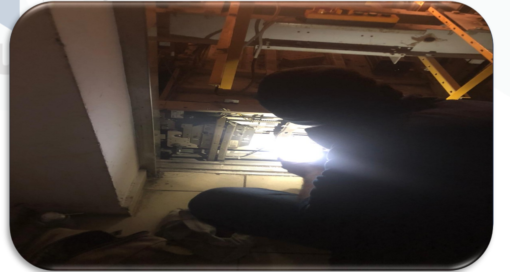
A Blok yük asansörü frenleme arızası giderilmiştir.