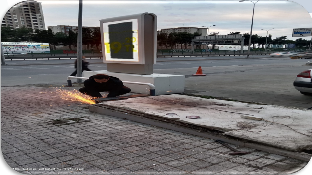
Güvenlik kabini değişimi öncesinde ve sonrasında teknik çalışmalar yürütülmüştür.