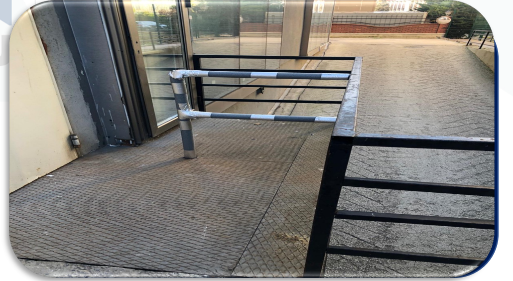
A Blok yük asansörü lobi kat çıkış alanına koruma bariyeri monte edilmiştir.