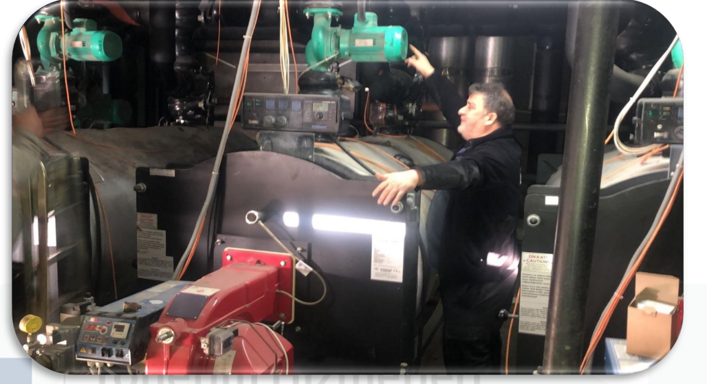
Isıtma Sistemi pompa arızası giderilmiştir.