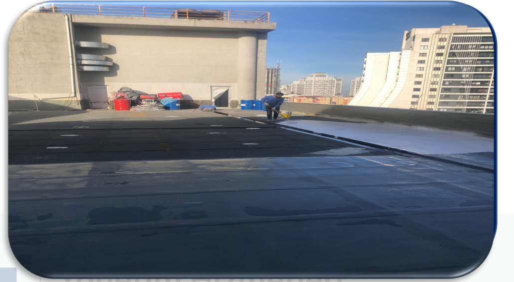
Çatı ve kulelerinde zemin izolasyonu çalışması gerçekleştirilmiştir.