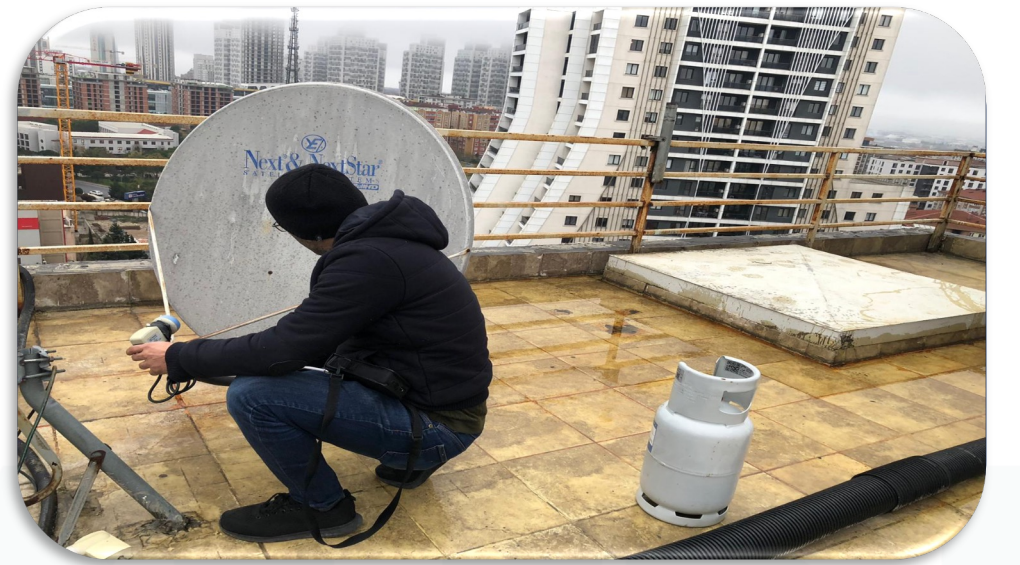
Uydu sistemi periyodik kontrolleri gerçekleştirilmiştir.