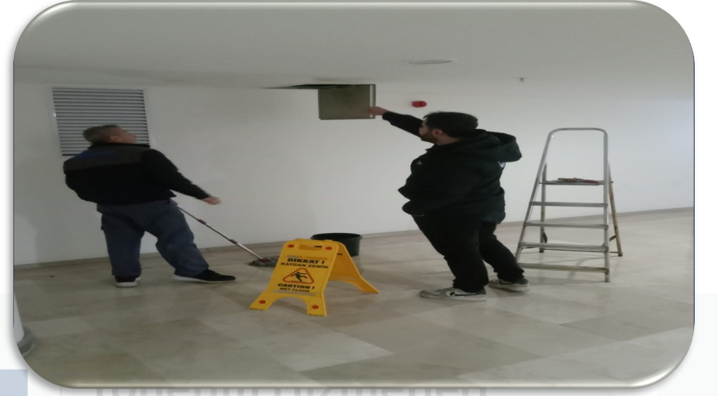
3.kat ortak alan kullanım suyu hattındaki arızalı su basınç düşürücü yenisi ile değiştirilmiştir.