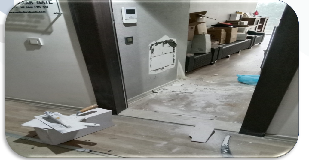
Ortak alan şaft su kaçaqları dolayısı ile hasar alan bağımsız bölümlerde tadilat çalışmaları gerçekleştirilmiştir.