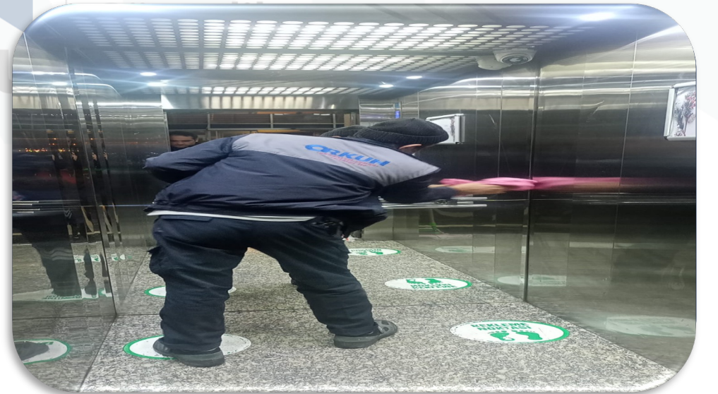
Asansrlerin kabin ii temizlik faaliyeti gerekleřtirilmiřtir.