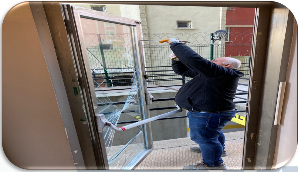
A Blok yük asansörü lobi kat çıkışındaki kırılan kapı camı yenisi ile değiştirilmiştir.