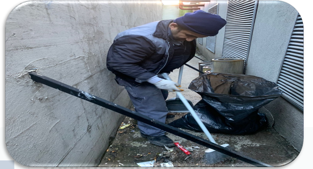
Sistem odalarının periyodik temizlik faaliyeti gerekleřtirilmiřtir.