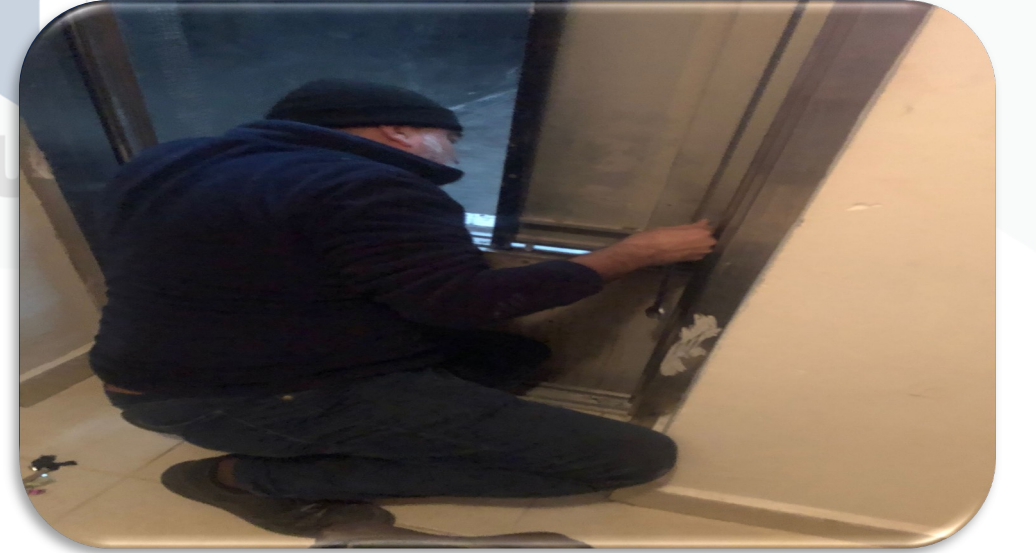
Asansörlerin aylık bakım faaliyeti gerçekleştirilmiştir.