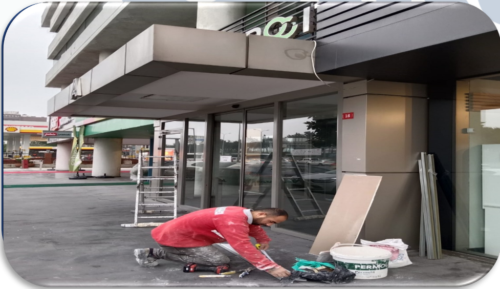
Bina giriş kapılarının üst boşluklarındaki hava akışını engellemek için boşluklar kapatılmıştır.