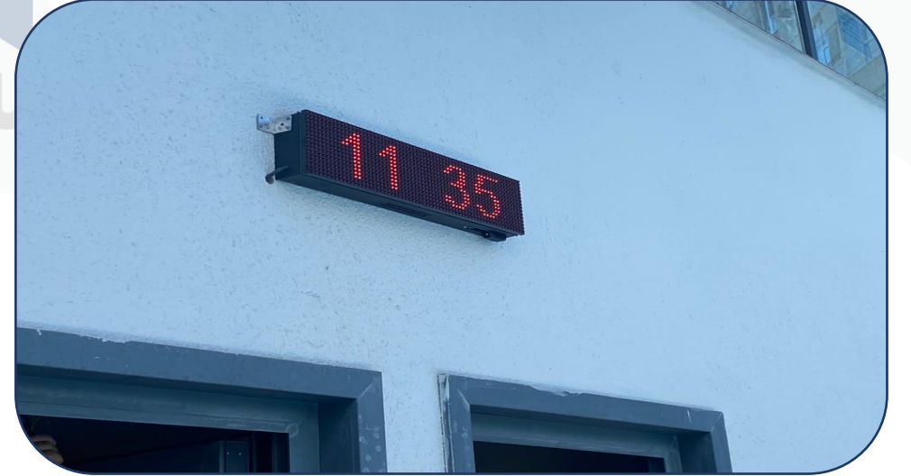
Açık havuz saat ve derece göstergesi ayarlanmıştır