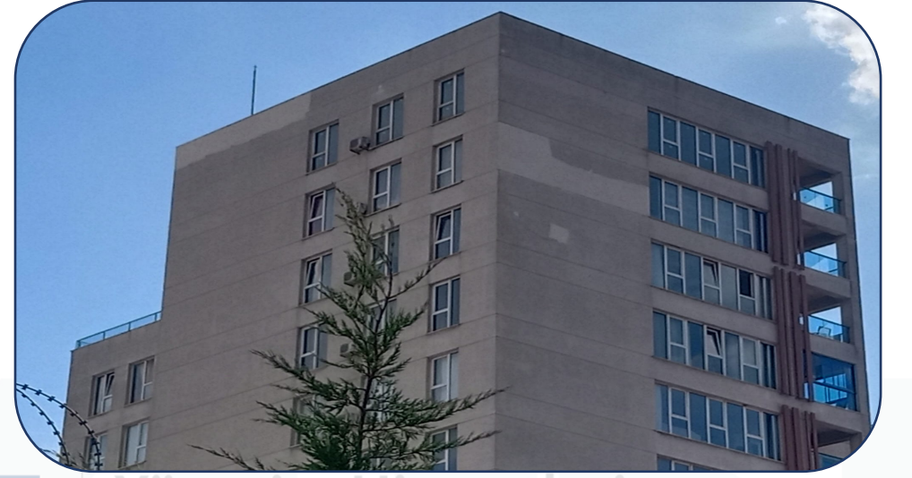
G Blok mantolama tamirata yapılmıştır.