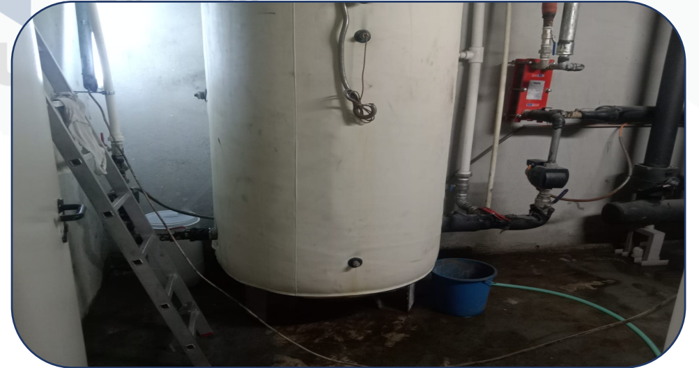
Delinen D Blok sıcak su tankı kaynak yapılmıştır.