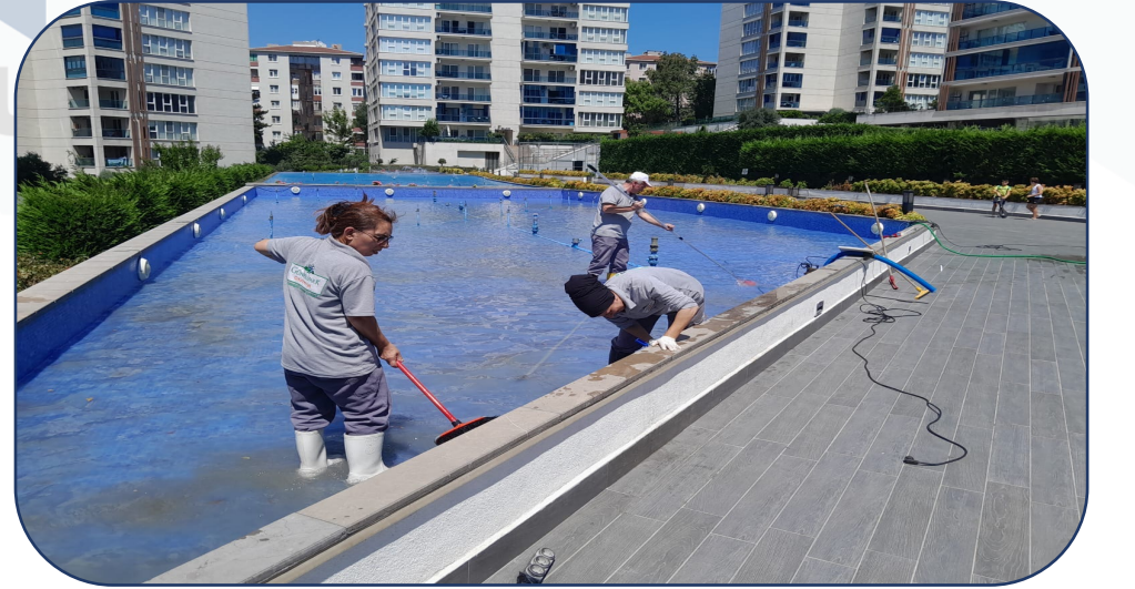
Süs havuzlarının temizliđi yapılmıřtır.