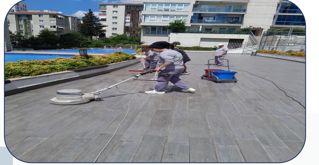
Gayrimenkul Alan temizliđi yapılmıřtır.