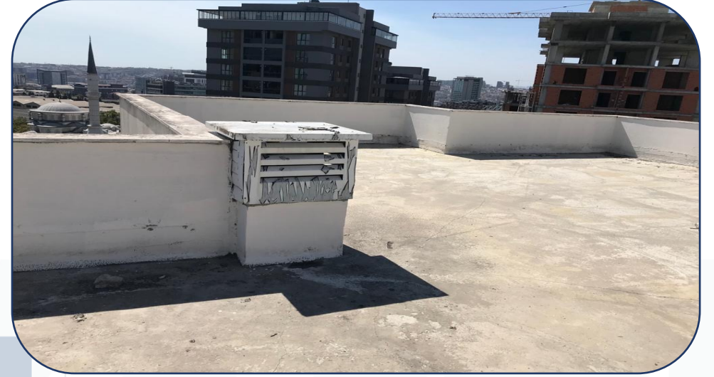
C Blok havalandırma kapağı montajı yapılmıştır.