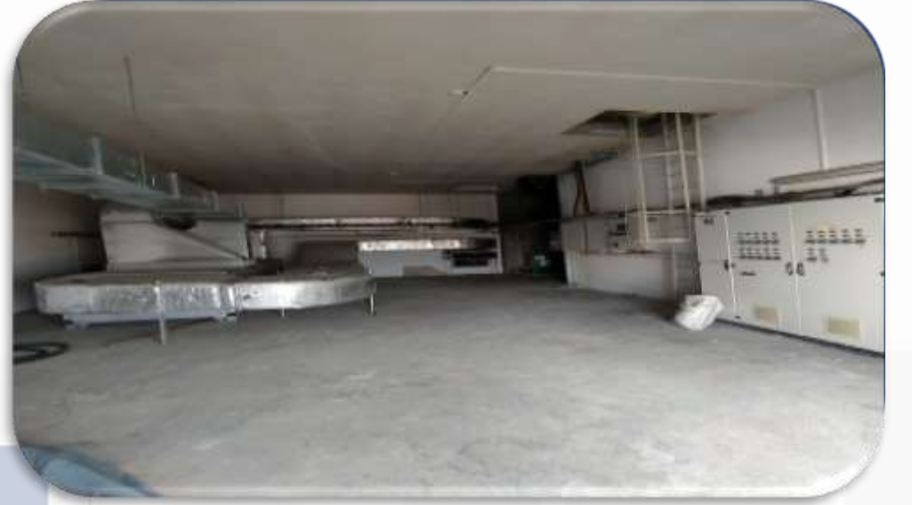
Sistem odalarının periyodik temizliđi gerekleřtirilmiřtir.