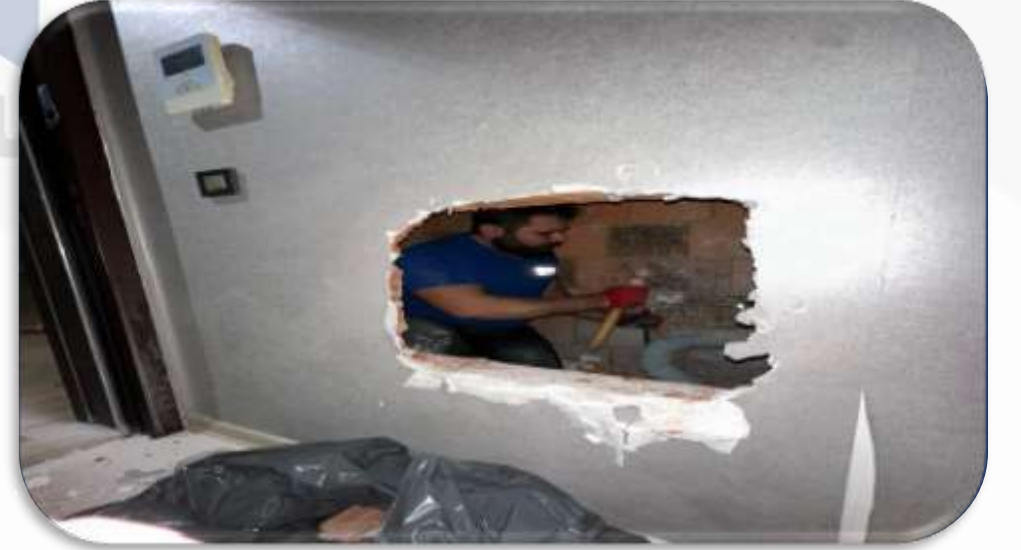
1.kat şaft boşluğundaki su toplama pimaşının çatlaması üzerine gerekli teknik müdahalede bulunulmuştur.