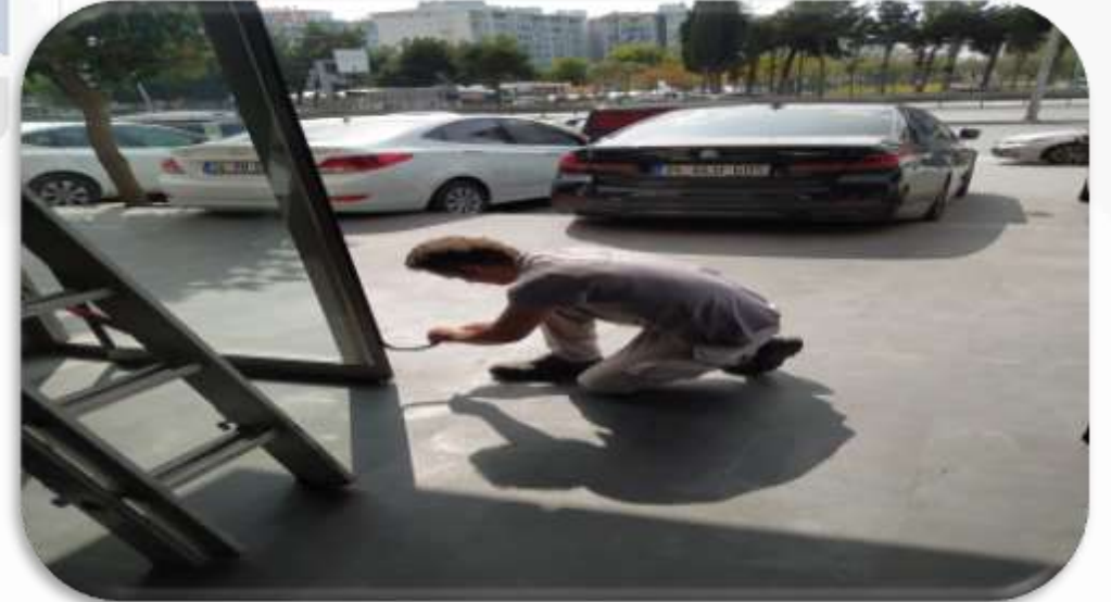
Bina giriş fotoselli kapılarının periyodik kontrolleri sağlanmıştır.