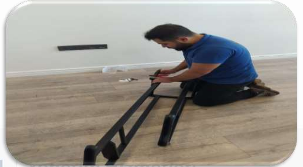
Bağımsız bölümlerin teknik servis talepleri karşılanmıştır