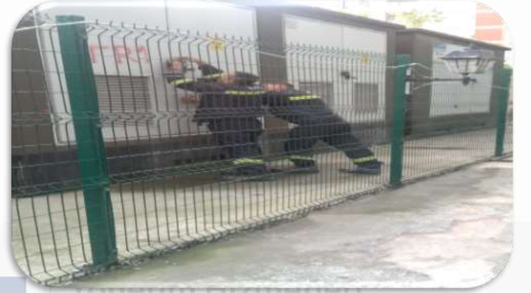
Ck Elektrik yetkili personelleri tarafınca periyodik trafo kontrolleri sağlanmıştır.