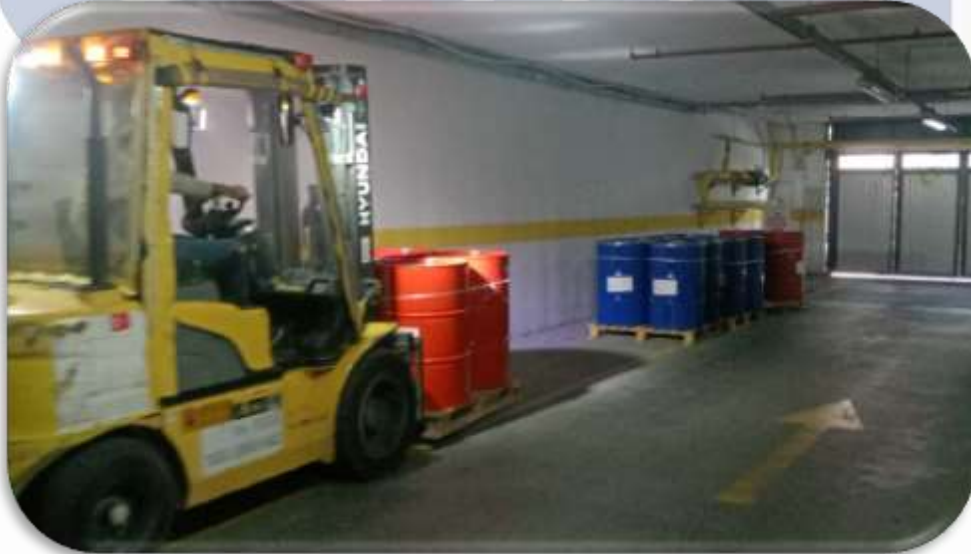
Çatı izolasyon malzemeleri teslim alınmıştır.