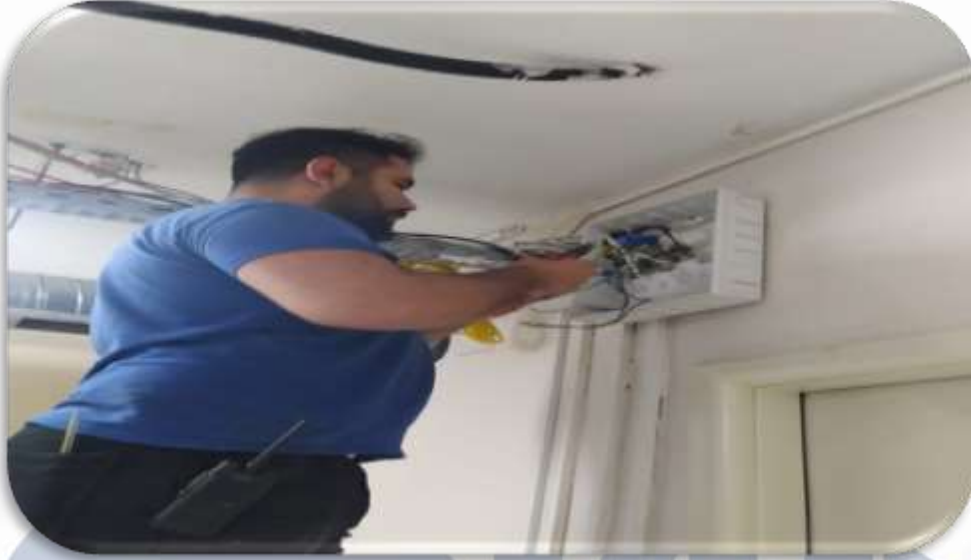
Personel yemekhanesi elektrik hattı kontrolleri sağlanmış ve yenilenmiştir.