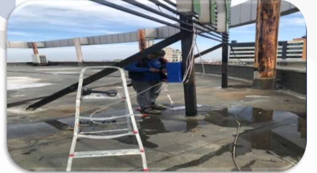
Çatıdaki Vetro City ışıklı tabelasının harf trafoları pano içerisine toplanmıştır.