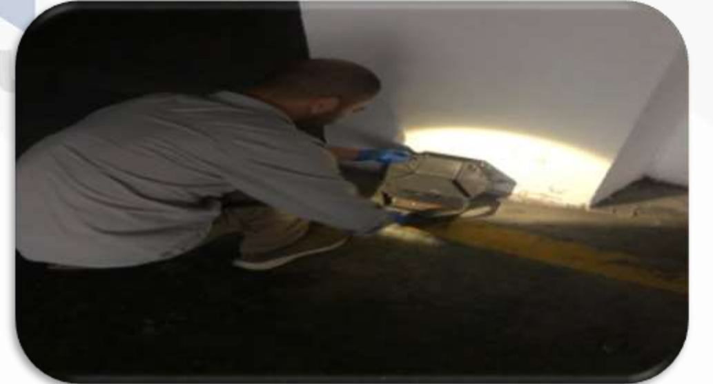
Periyodik ortak alan ilaçlama faaliyeti gerçekleştirilmektedir.