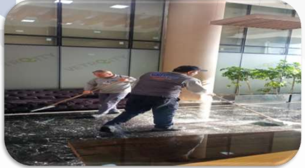
Lobilerin detaylı temizliđi gerekleřtirilmiřtir.