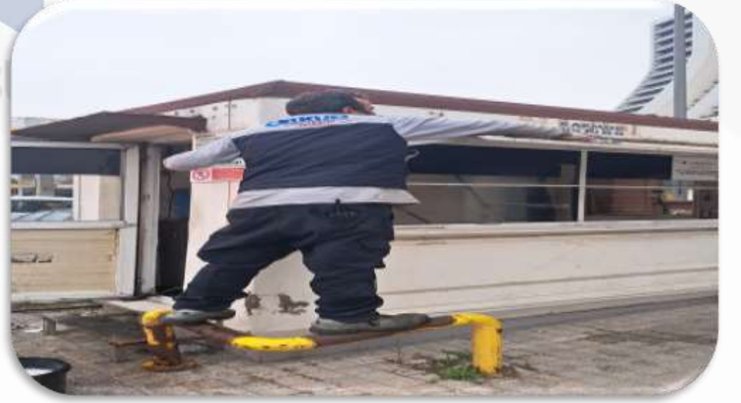
Gvenlik kabini detaylı temizliđi gerekleřtirilmiřtir.