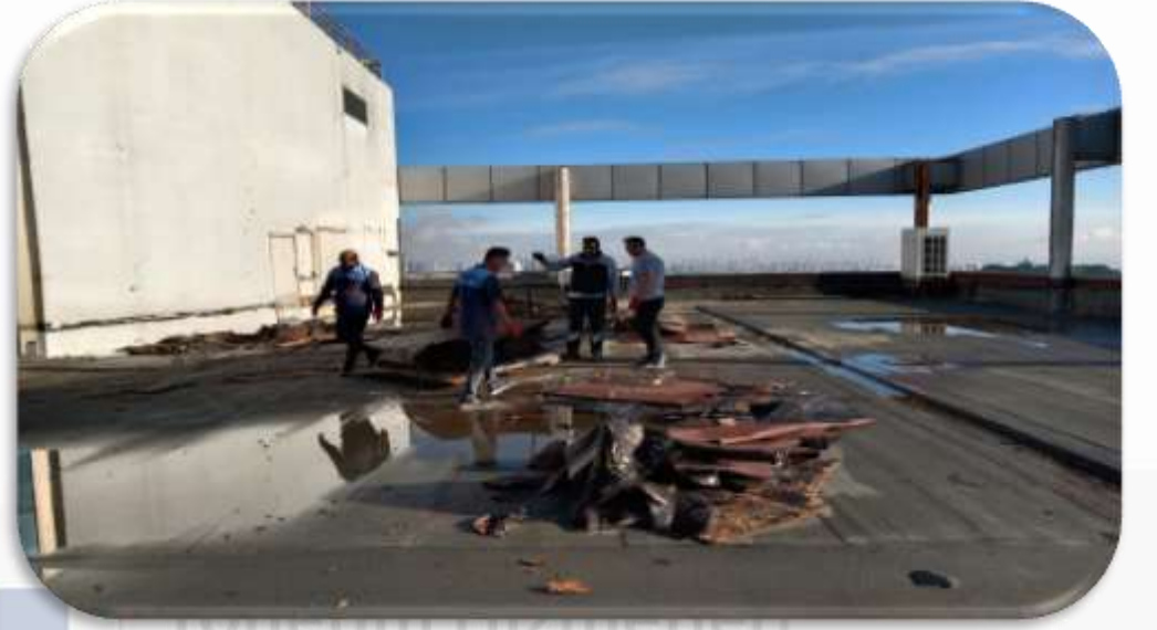
atı hurda kaldırma iřlemi sonrası çatı moloz temizliđi gerekleřtirilmiřtir.