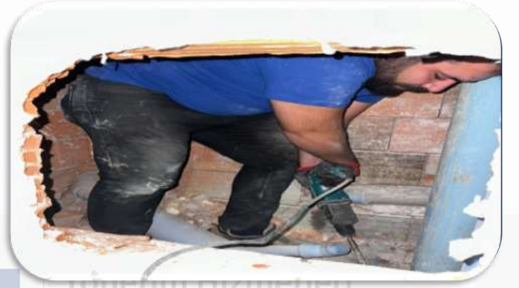
3-4 kat aralığındaki şaft su kaçağına teknik müdahalede bulunulmuştur.