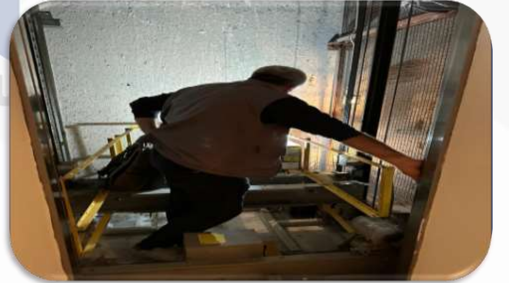
Asansörlerin aylık bakım faaliyeti gerçekleştirilmiştir.