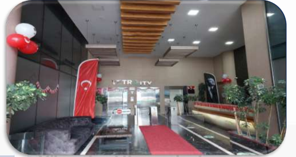
29 Ekim Cumhuriyet Bayramı dolayısı ile lobilerimiz Cumhuriyetimizin 100.yılına özel süslenmiştir.