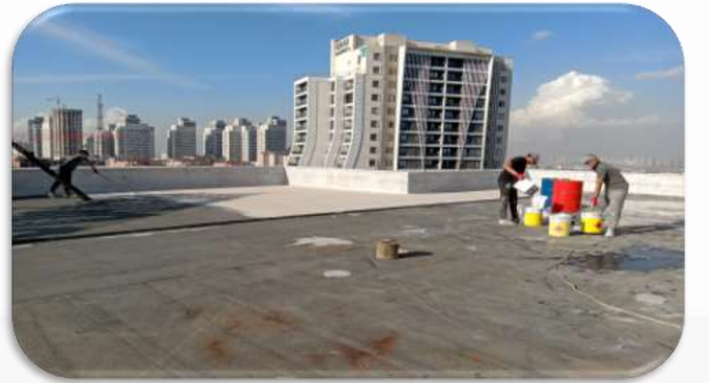
Yönetim Hizmetleri Çatı izolasyon çalışmasına başlanılmıştır.