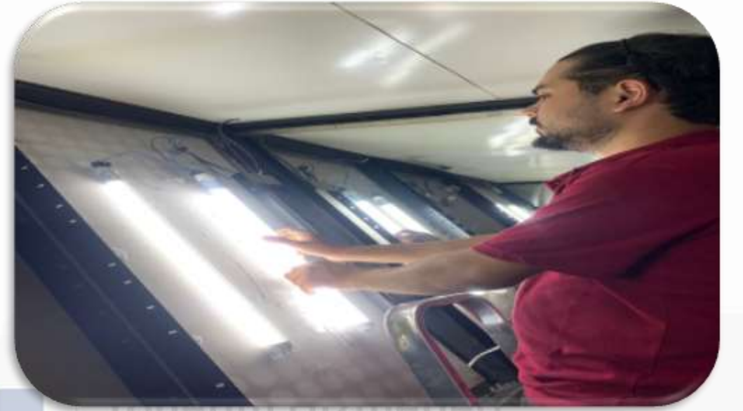
Bina geneli ortak alan aydınlatma ve sensör hasar kontrolleri sağlanmıştır.