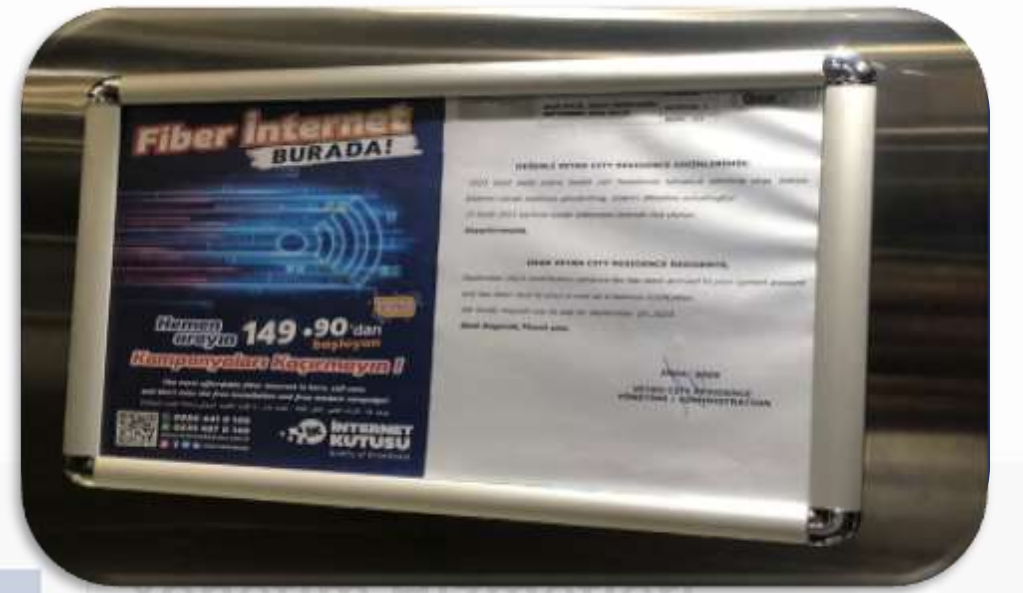
Dönemsel daire sakini bilgilendirme duyuruları hazırlanmış ve duyuru panolarına asılmıştır.