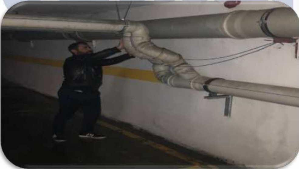
Şiddetli yağışa bağlı olarak ortak alan hasarlarına teknik müdahalede bulunulmuştur.