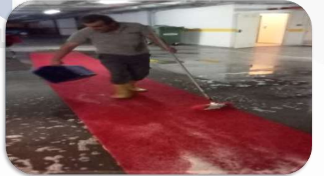
Lobi girişlerindeki kıvrıcık paspaslar yıkanmıştır.