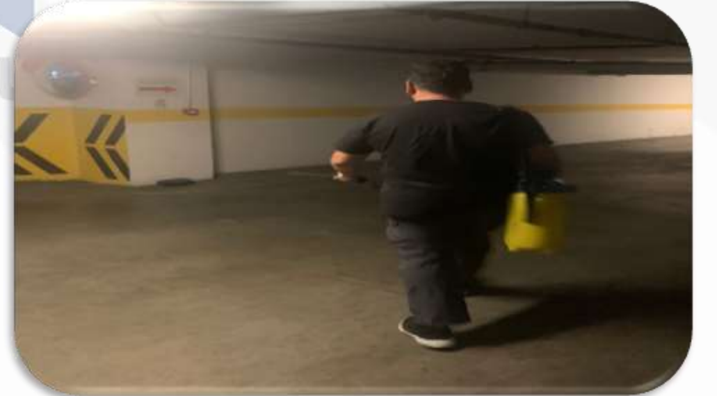
Periyodik ortak alan ilaçlama faaliyeti gerçekleştirilmektedir.