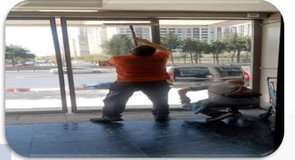
Bina girişı fotoselli kapıları temizlenmiştir.