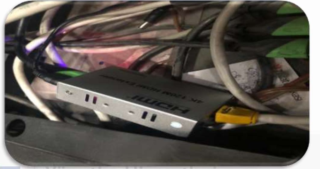
Kamera sistemi exender cihazı yenisi ile değiştirilmiştir.