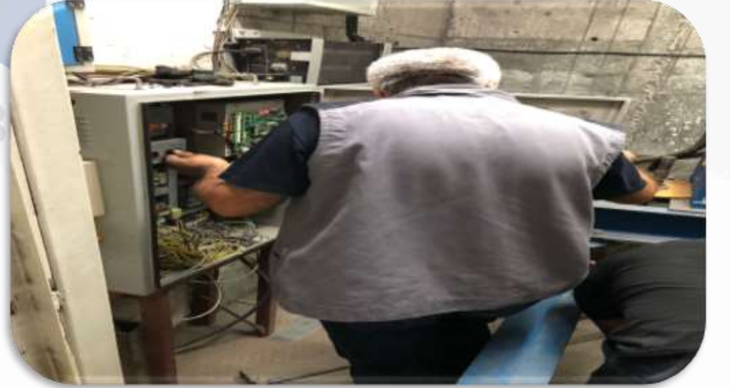
Asansörlerin aylık bakım faaliyeti gerçekleştirilmiştir.