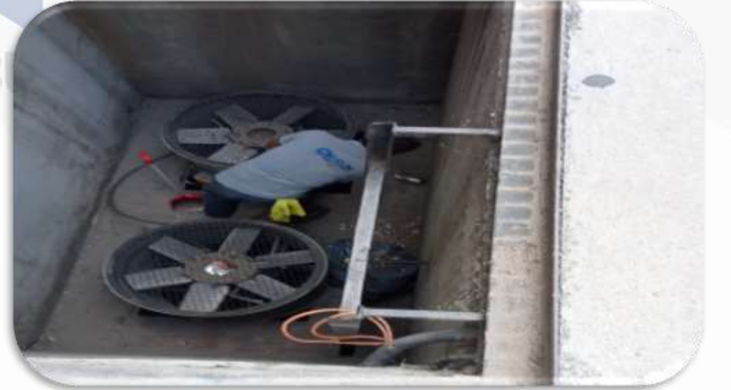
Havalandırma sistemi aksiyel fanların temizliđi gerekleřtirilmiřtir.