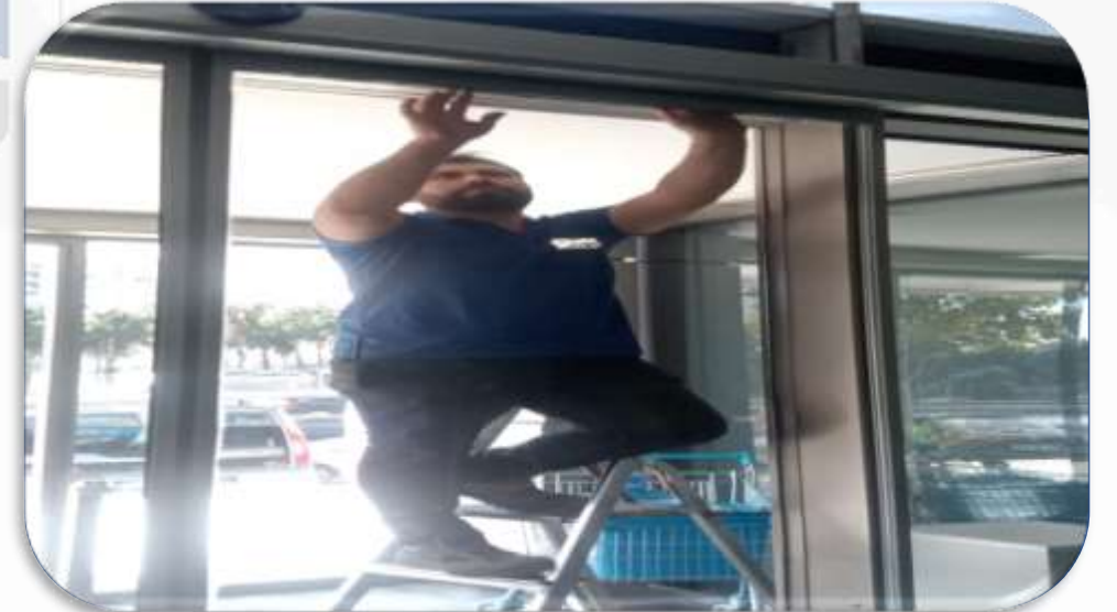
Bina giriş fotoselli kapılarının periyodik kontrolleri sağlanmıştır.