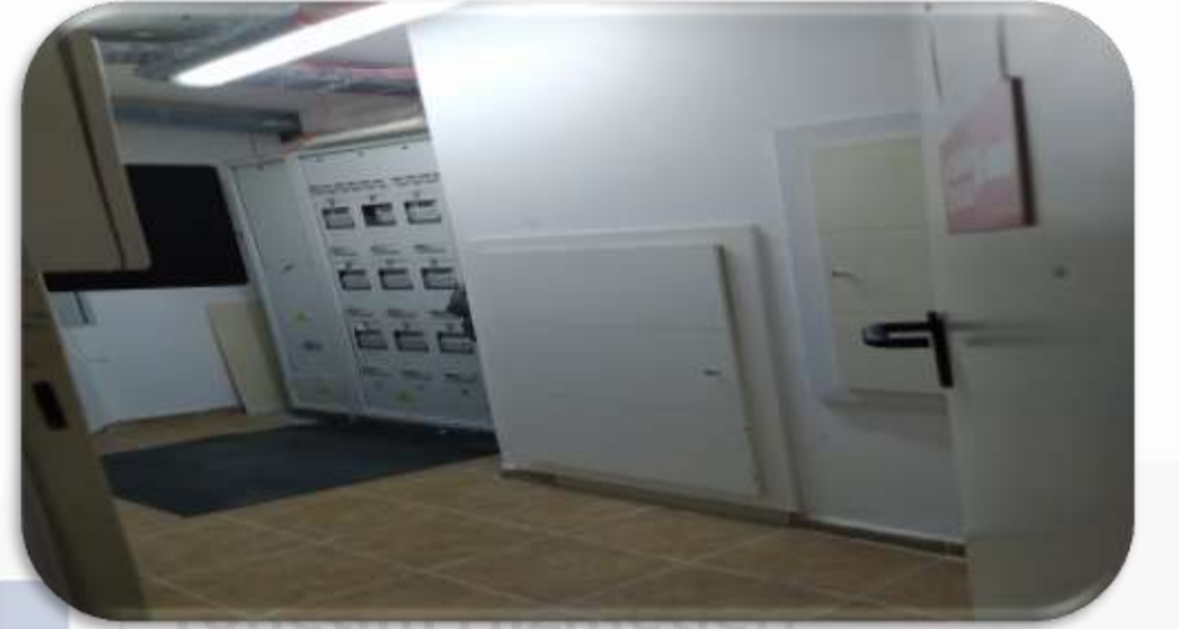
Bina geneli elektrik odalarının periyodik temizlik faaliyeti gerekleřtirilmiřtir.