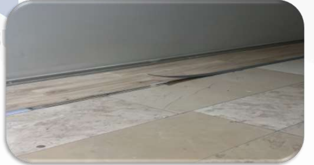
Bina geneli ortak alan eşik çıtalarının hasar kontrolleri gerçekleştirilmiştir.