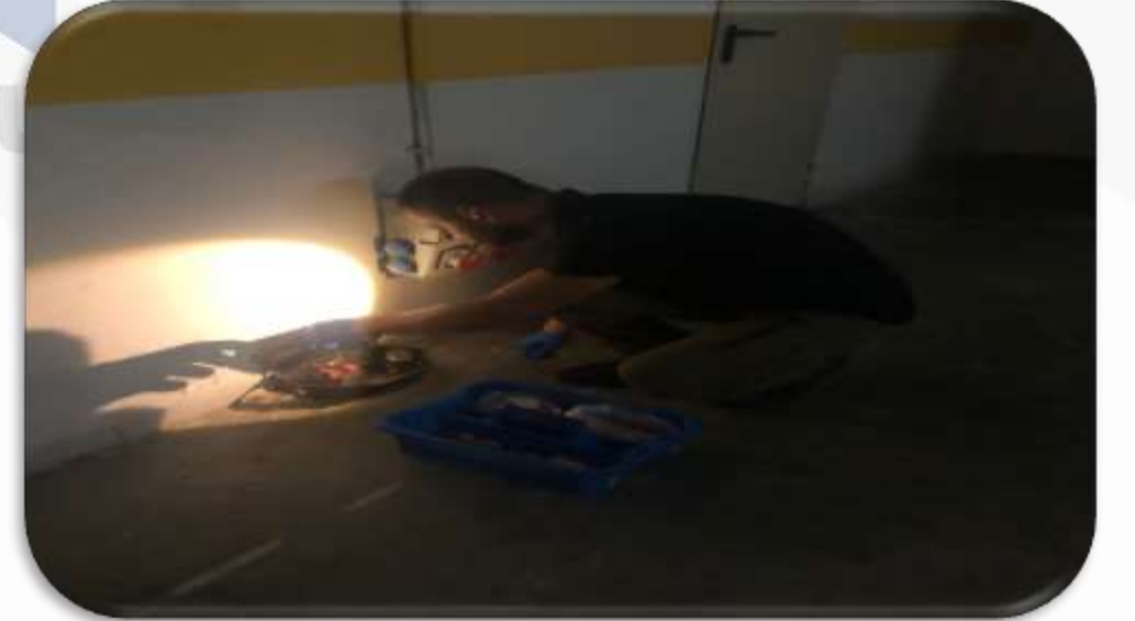
Periyodik ortak alan ilaçlama faaliyeti gerçekleştirilmektedir.