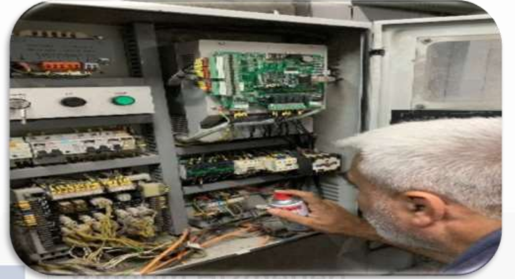
B Blok sol asansörün kontaktör deđiřimi gerekleřtirilmiřtir.