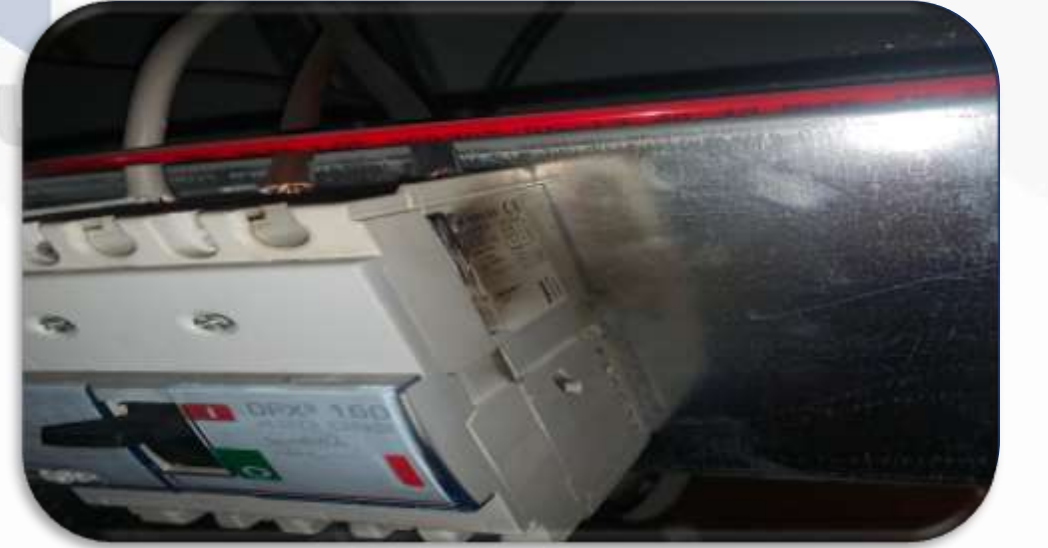
A Blok ortak alanı besyelen sigortanın yanması üzerine yenisi ile deđiřimi sađlanmıřtır.