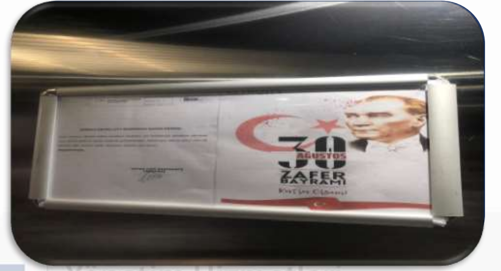
Dönemsel daire sakini bilgilendirme duyuruları hazırlanmış ve duyuru panolarına asılmıştır.