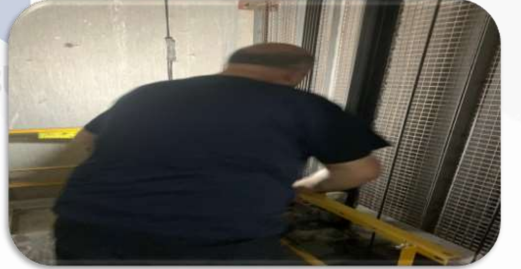
Asansörlerin aylık bakım faaliyeti gerçekleştirilmiştir.