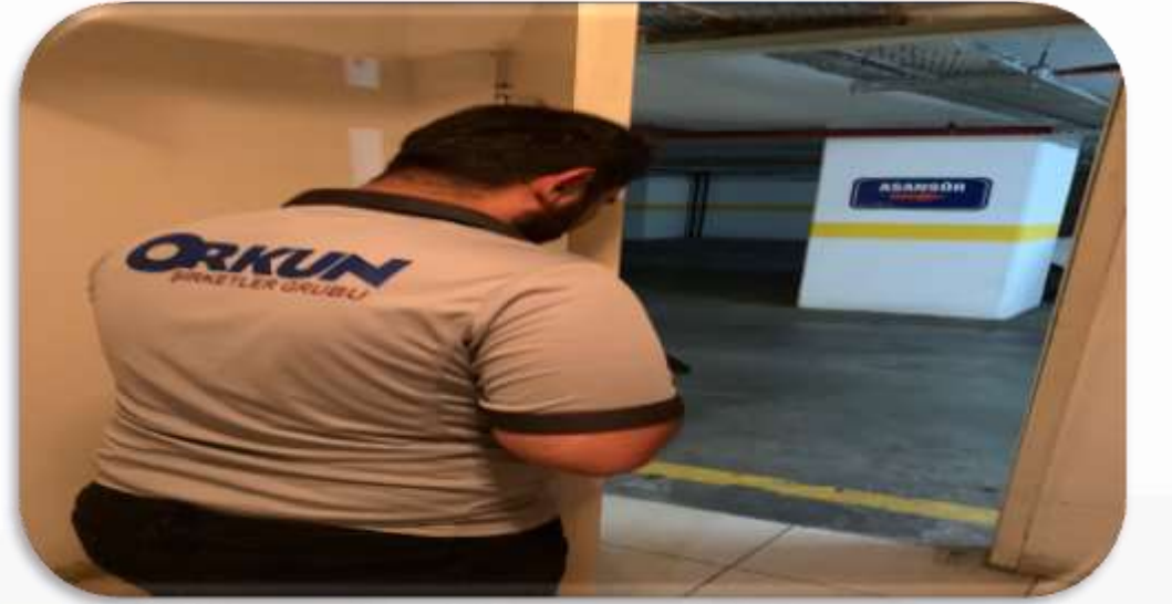
Bina geneli ortak alan acil çıkış kapılarının periyodik bakım faaliyeti gerçekleştirilmiştir.