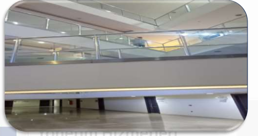
Ortak alan camların temizlięi gerekleřtirilmiřtir.