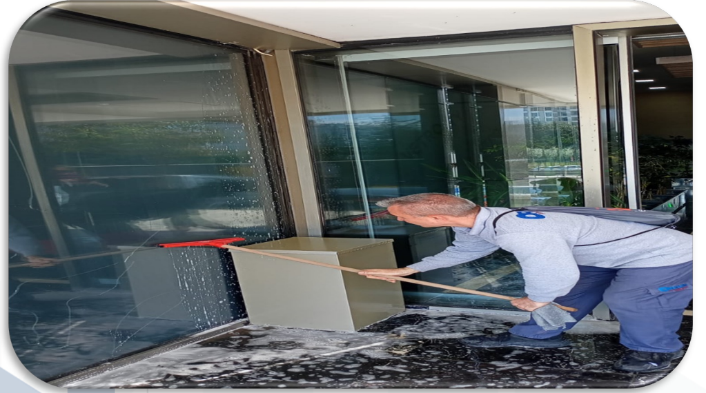
Lobi giriş kapılarının detaylı temizliği gerçekleştirilmiştir.