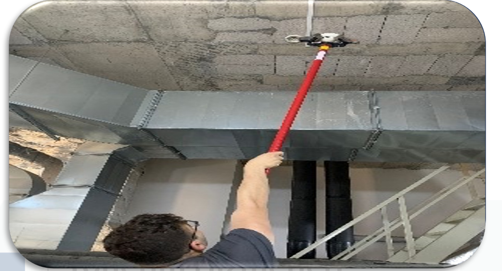
Yangın Algılama Sistemi periyodik kontrolleri sağlanmıştır.