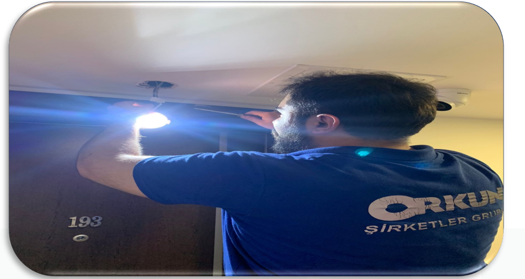
Bina geneli ortak alan aydınlatma kontrolleri sağlanmıştır.