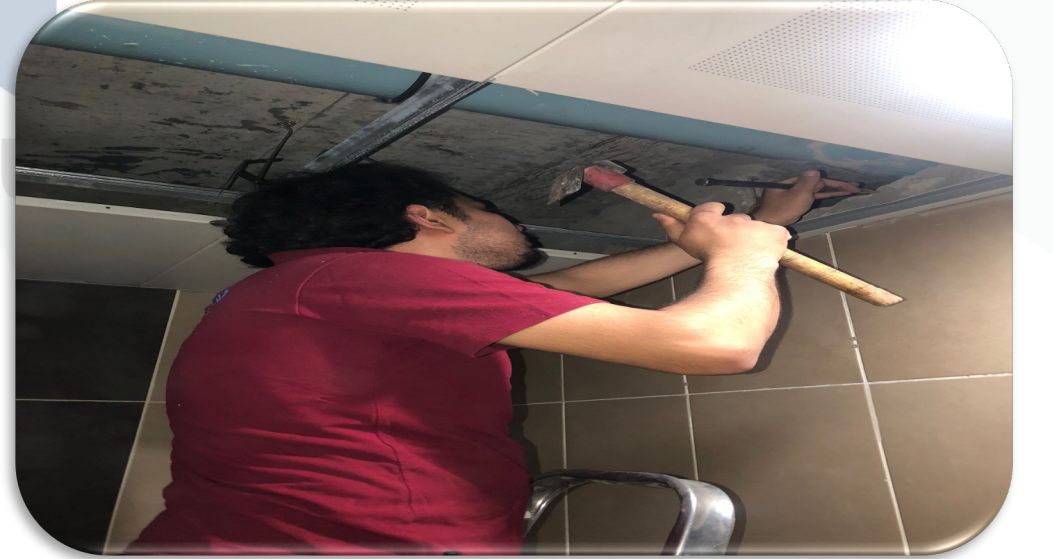
3.kat pis su toplama pimaşının yerinden çıkması üzerine gerekli teknik müdahalede bulunulmuştur.