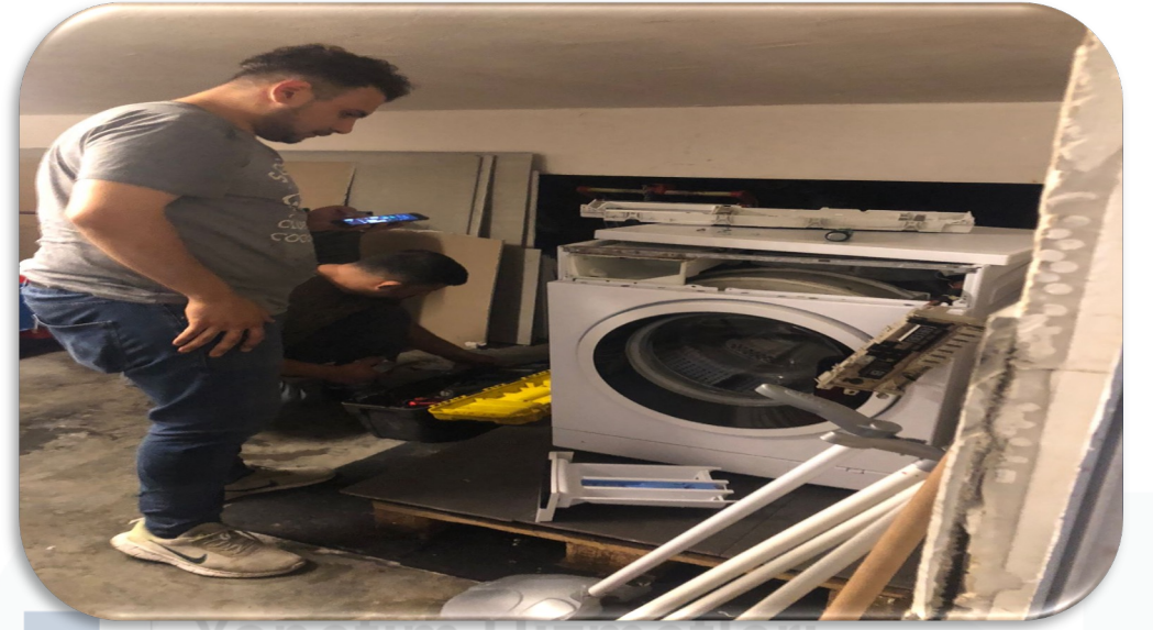
Temizlik departmanında kullanılan çamaşır makinesinin dokunmatik ekran arızası giderilmiştir.