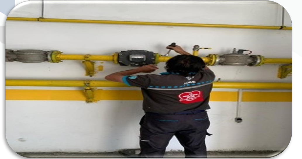
İgdaş yetkili personellerince doğalgaz sayacı değiştirilmiştir.