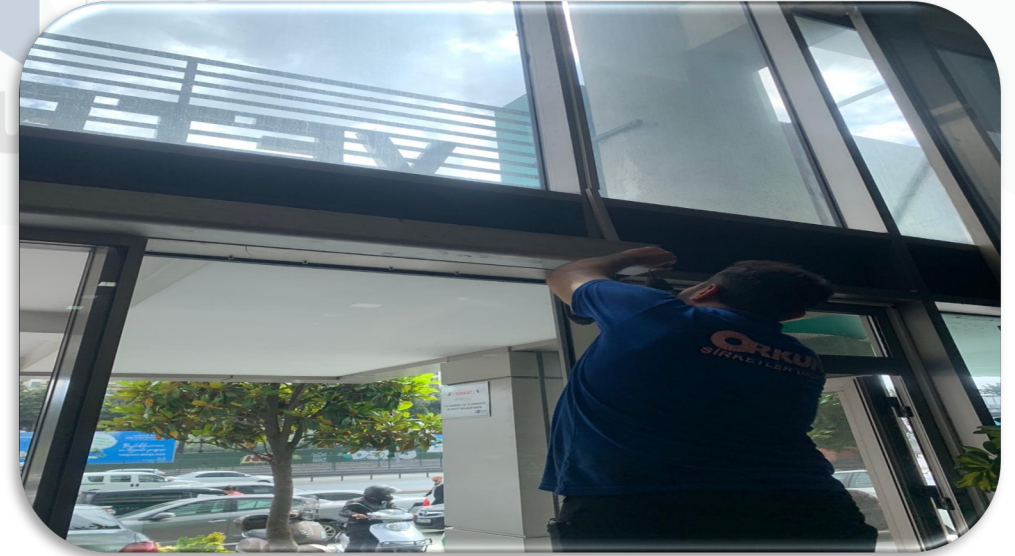
Lobi giriř kapılarının periyodik kontrolleri sađlanmıřtır.