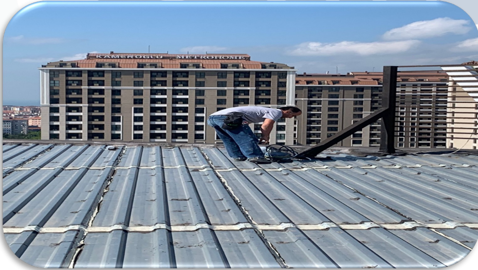
Çatı lokal izolasyon çalışması gerçekleştirilmiştir.