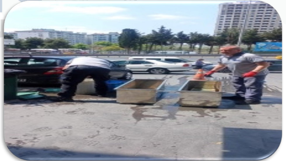
İç mekan bitkilerin saksıları yıkanmıştır.