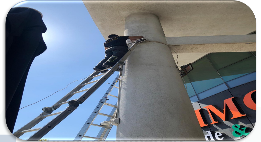
Kamera sistemi periyodik kontrolleri gerekleřtirilmiřtir.