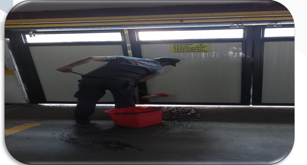
Otopark ıkıř kepenginin detaylı temizlięi gerekleřtirilmiřtir.