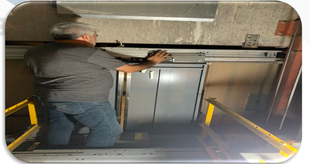
Asansörlerin aylık bakım faaliyeti gerçekleştirilmiştir.