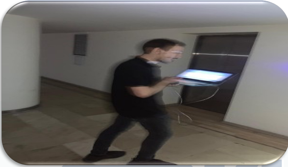
Bağımsız bölümlerin süzme sayaç endeks değer kontrolleri gerçekleştirilmiştir.