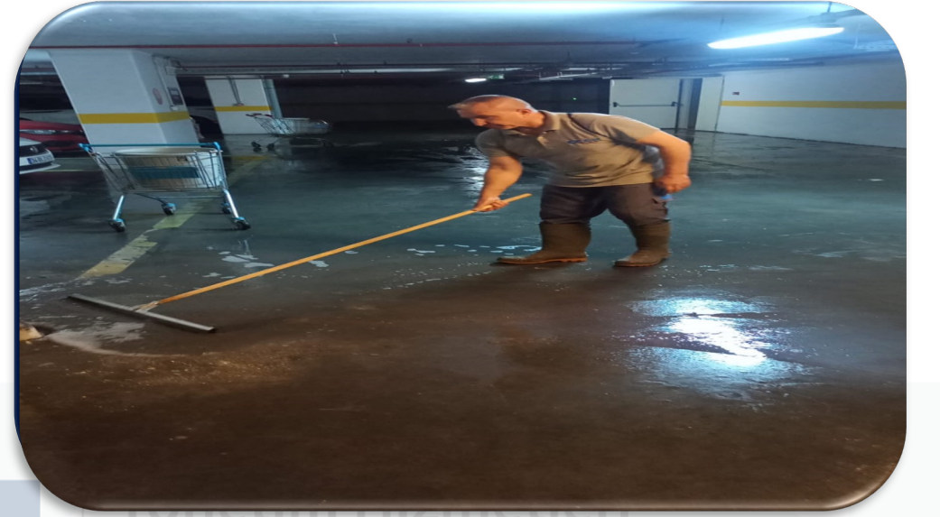
Kapalı otopark katlarının detaylı temizlięi gerekleřtirilmiřtir.