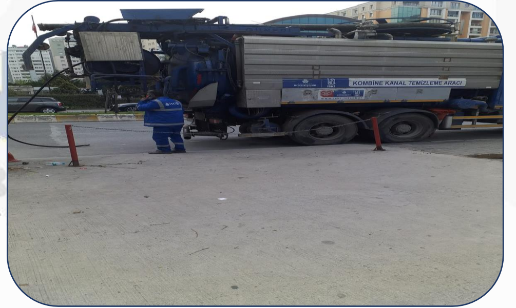
Atık Su Giderlerinin Temizlik İşlemi