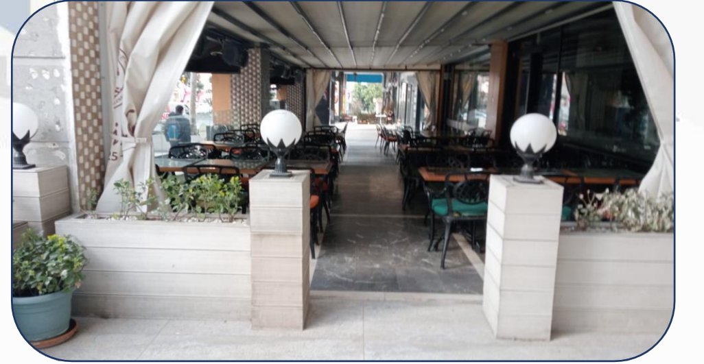
Dükkan Önleri Günlük Temizlik İşlemi