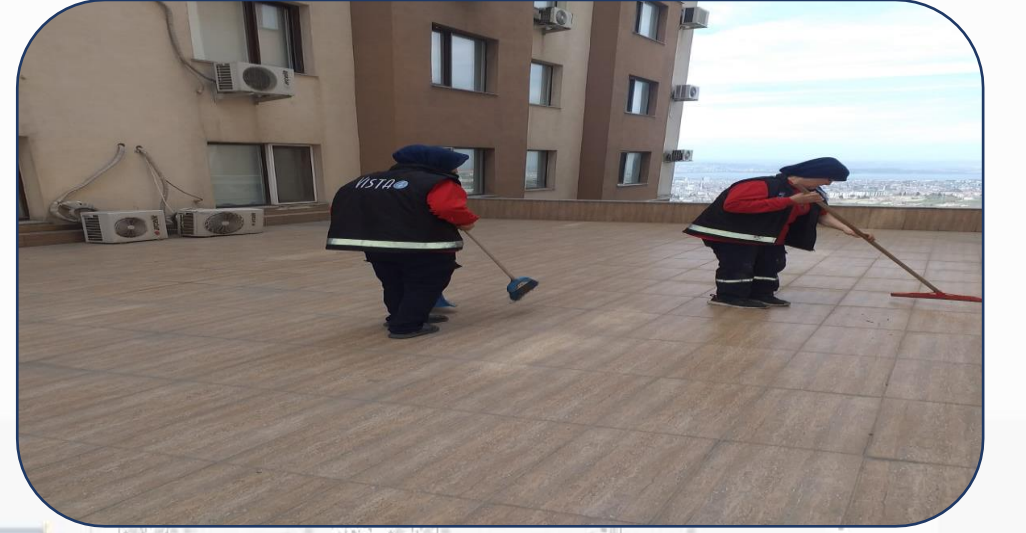
Dükkan Üstleri (Blok Arası) Temizlik İşlemi