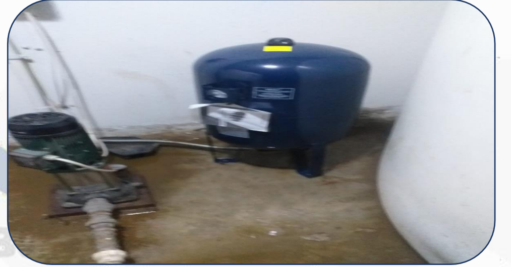
A Blok Yenilenen Genleşme Tankı