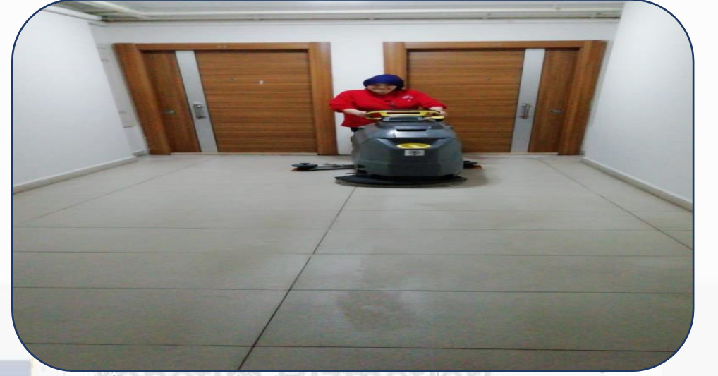
Blokların Yıkama Makinesi ile Yıkınması