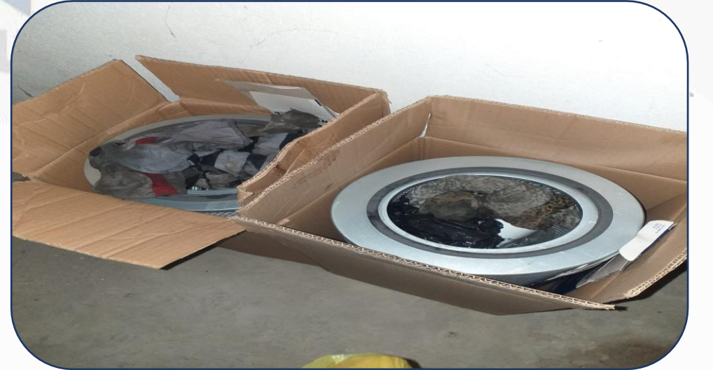
Jeneratör Bakımı Yenilenen Parçalar