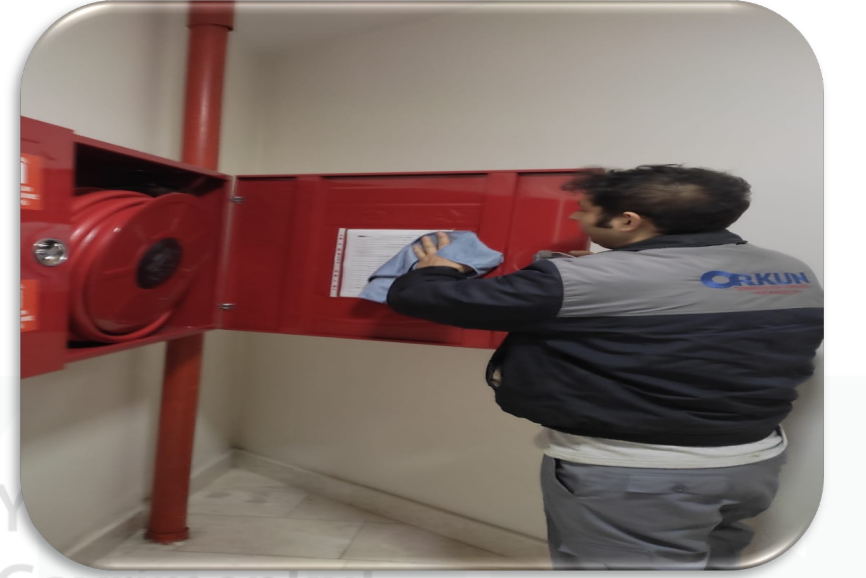
Yangın panoları düzenli olarak temizlenmektedir.