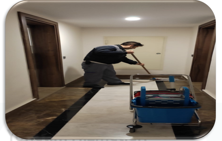
Düzenli olarak blok temizliği yapılmaktadır..