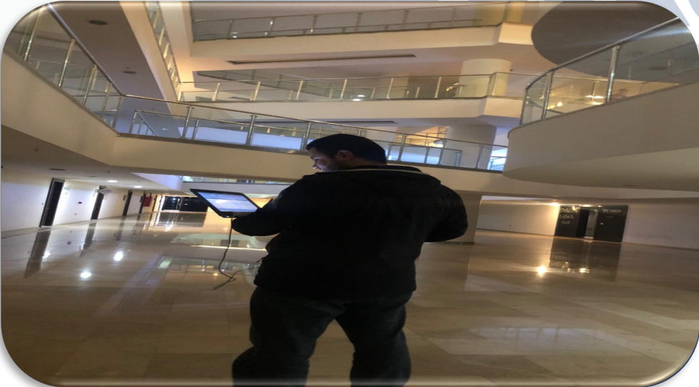
Bağımsız bölümlerin süzme sayaç fatura paylaşımları gerçekleştirilmiştir.