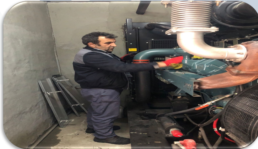
Jeneratör odasının temizliđi gerekleřtirilmiřtir.