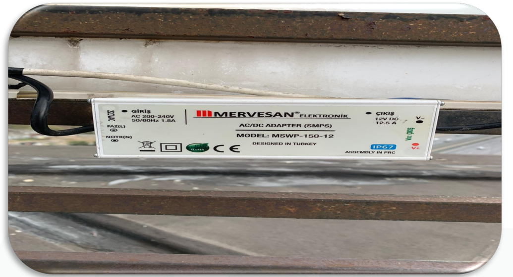
14.katta çatı katında bulunan ışıklı Vetro City tabelasının arızalı trafosu değiştirilmiştir.