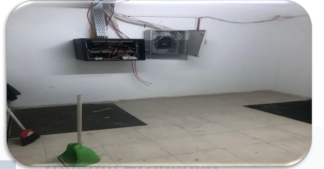
Bina geneli elektrik odalarının temizlik faaliyeti gerekleřtirilmiřtir.