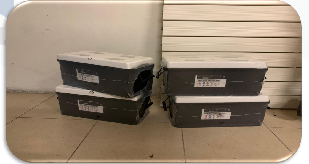
Gereği üzerine jeneratörlere 4 adet yeni akü alımı yapılmıştır.