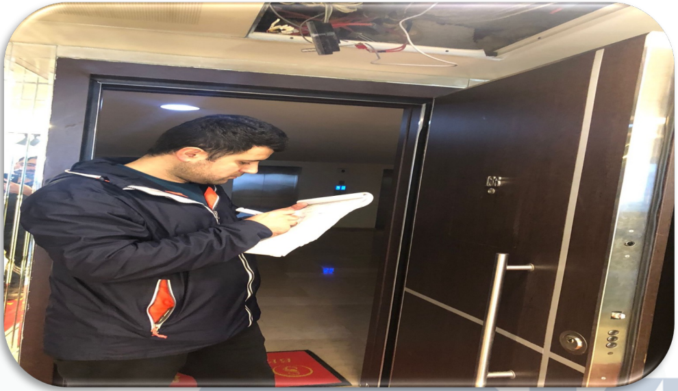
Bağımsız bölümlerin süzme sayaç endeks değer kontrolleri gerçekleştirilmiştir.