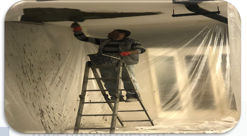
B Blok giriş alanı zemin altından izolasyon çalışması gerçekleştirilmiştir.