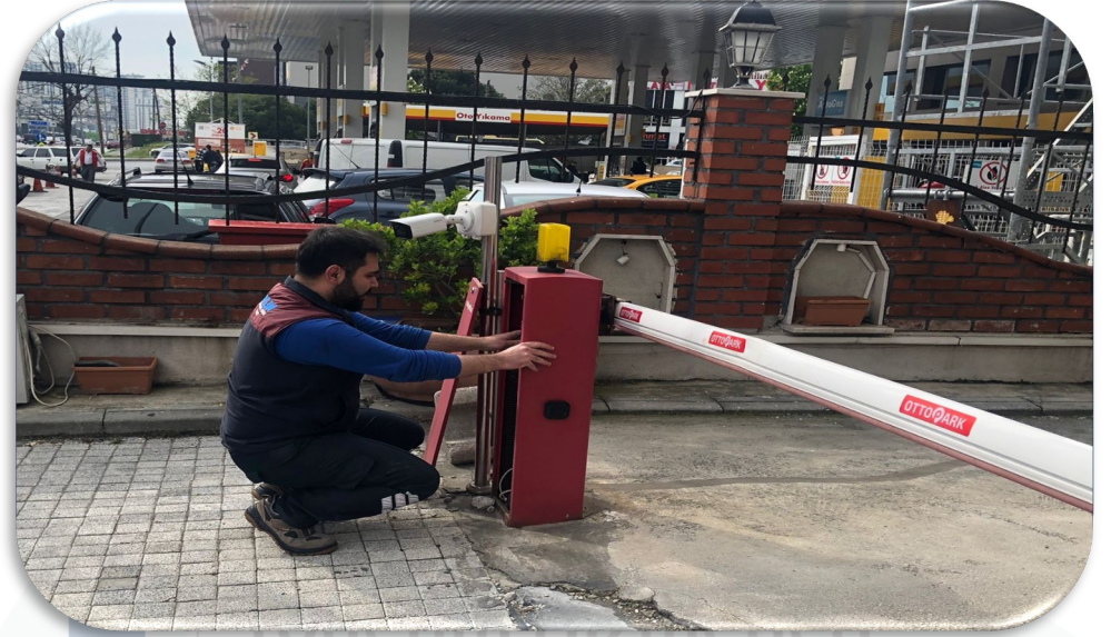
Turnike sistemi ve PTS periyodik kontrolleri gerçekleştirilmiştir.