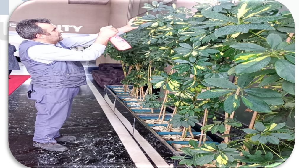
İ mekan bitkilerin periyodik bakımı gerekleřtirilmiřtir.