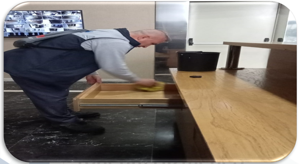
Lobi banko-dolapları temizlenmiřtir.