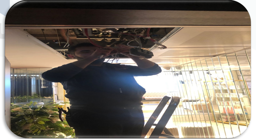
Bağımsız bölümlerin teknik servis talepleri karşılanmıştır.