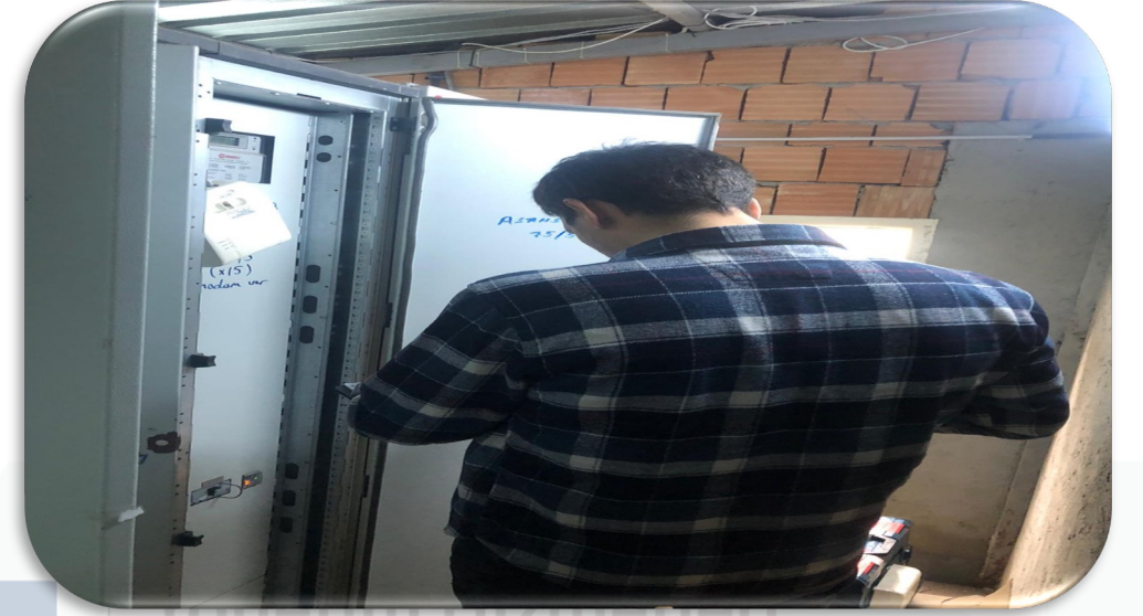
Elektrik trafo odasındaki arızalı modem yenisi ile değiştirilmiştir.

➤ A lobinin modem internet arızası giderilmiştir.