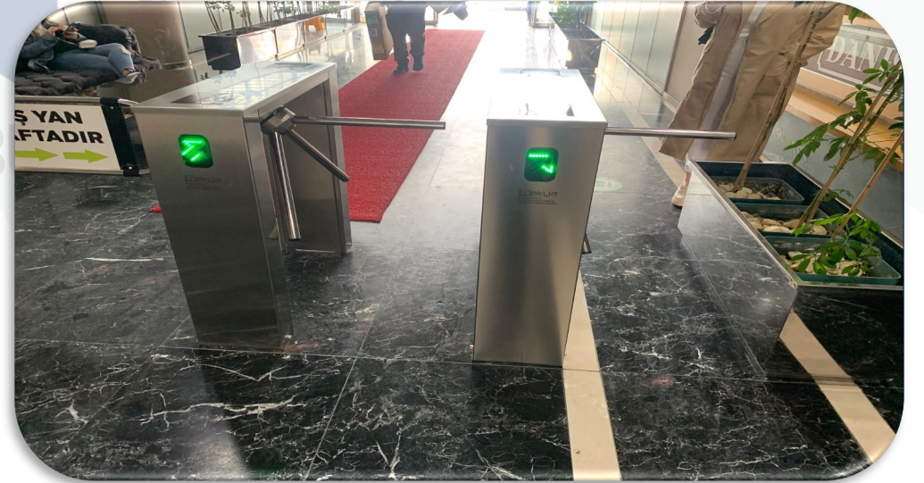
B Blok lobi düşen turnike kolu yerine sabitlenmiştir.