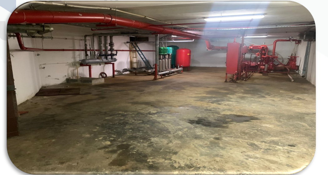
Hidrofor odasının temizlięi gerekleřtirilmiřtir.