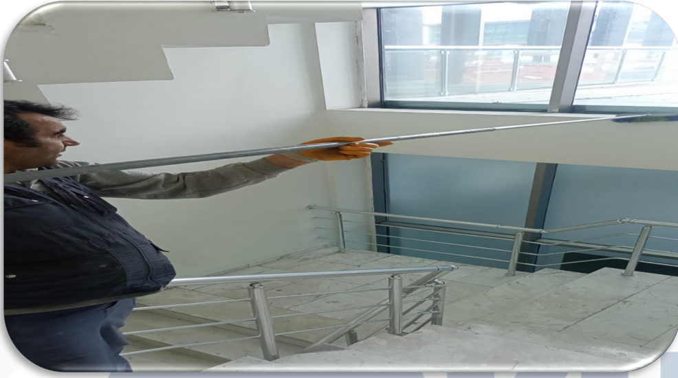
Ortak alan camların temizliđi gerekleřtirilmiřtir.