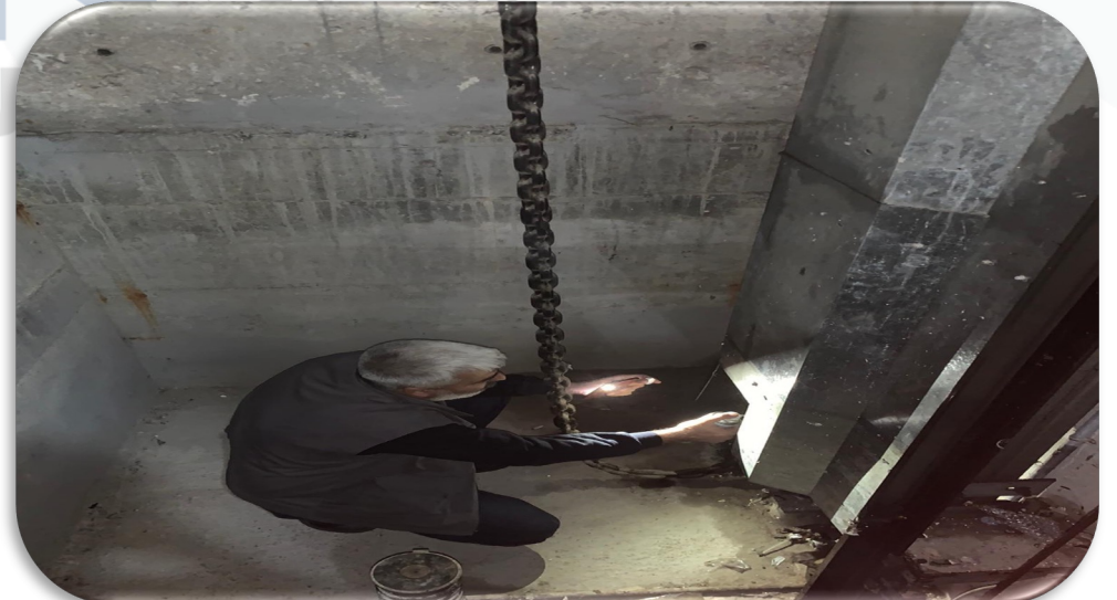
Asansörlerin aylık bakım faaliyeti gerçekleştirilmiştir.