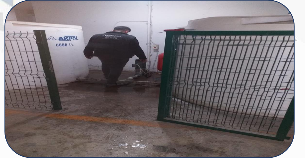
C Blok Hidroforu Hava Basılması İşlemi