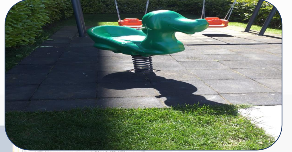
Bahçe Oyunağı Tamiri