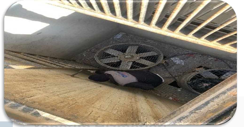
-4 Kapalı otopark katında bulunan aksiyel fan alanının temizliği gerçekleştirilmiştir.