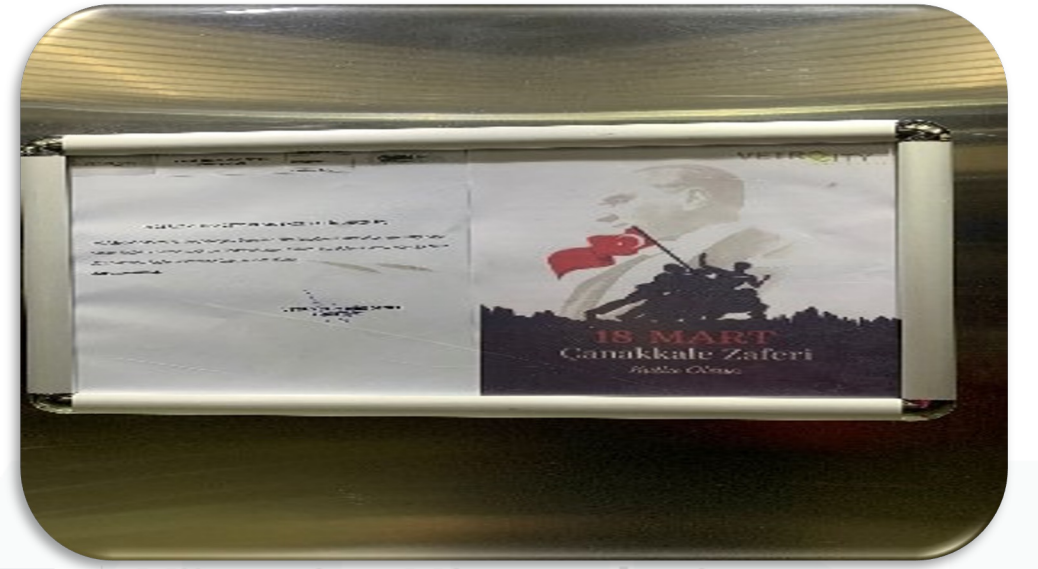
Dönemsel daire sakini bilgilendirme duyuruları hazırlanmış ve duyuru panolarına asılmıştır.