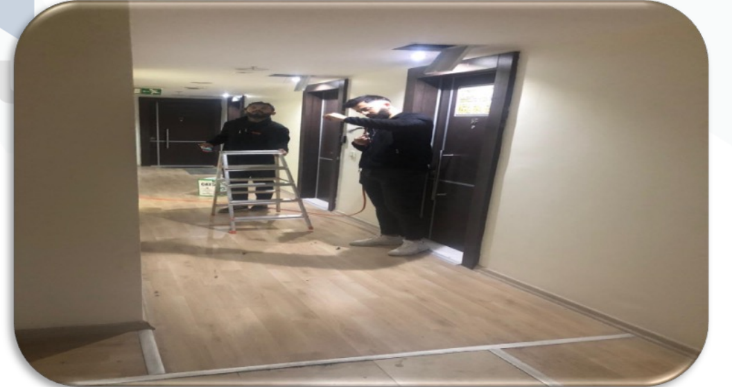
Baęımsız blmlerin teknik servis talepleri karřılanmıřtır.