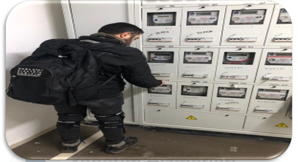
Elektrik, su ve doğalgaz kurumlarının yetkili personelleri tarafınca gerçekleştirilen sayaç kontrol işlemlerinde teknik eşlik sağlanmıştır.