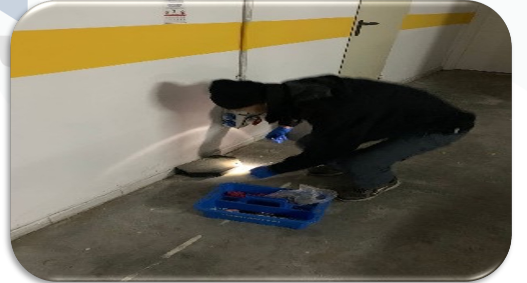
Periyodik ortak alan ilaçlama faaliyeti gerçekleştirilmektedir.