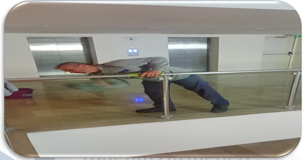
Ortak alan cam korkulukların temizliği gerçekleştirilmiştir.