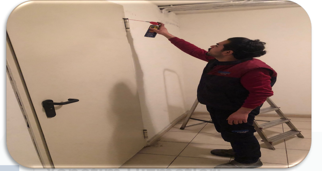
Bina geneli acil ıkıř kapılarının genel kontrol ve bakım faaliyeti gerekleřtirilmiřtir.