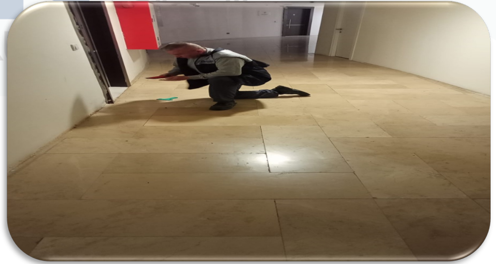
Ortak alan zemin lekeleri temizlenmiştir.