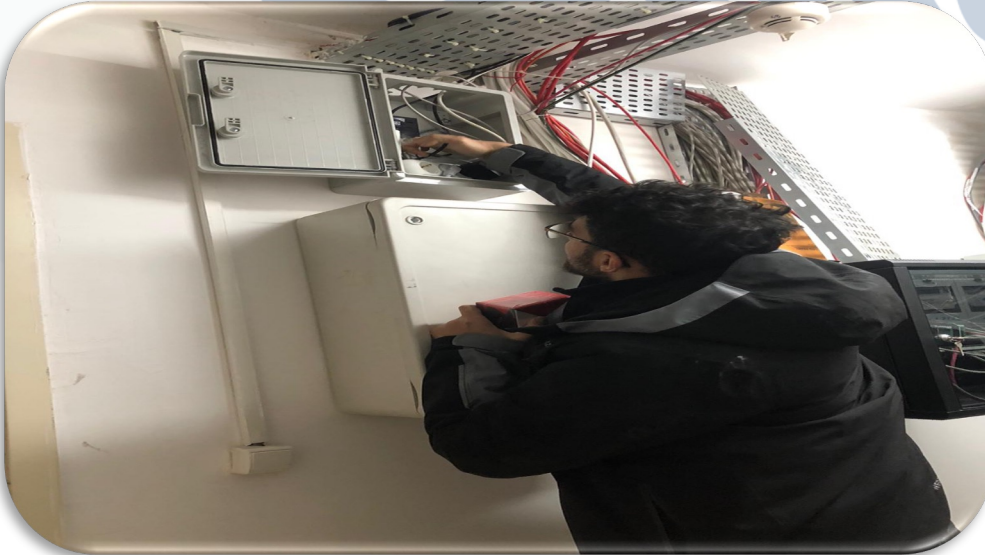
İnternet port arızası dolayısıyla teknik servis hizmeti alınmıştır.