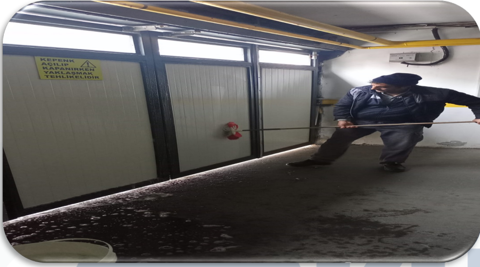
Kapalı otopark çıkış kepenk temizliği gerçekleştirilmiştir.