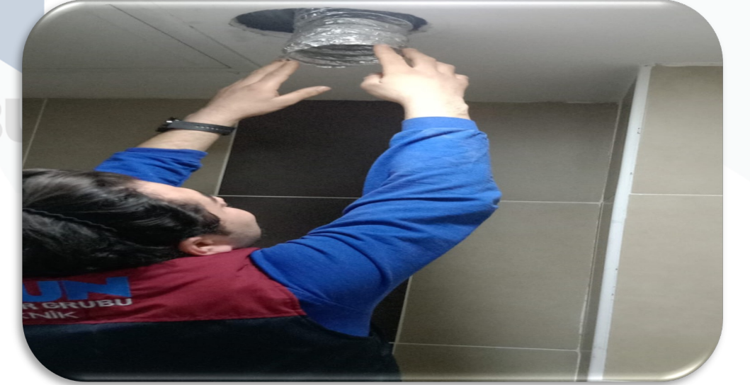
Havalandırma sistemi kontrolü sağlanmıştır.