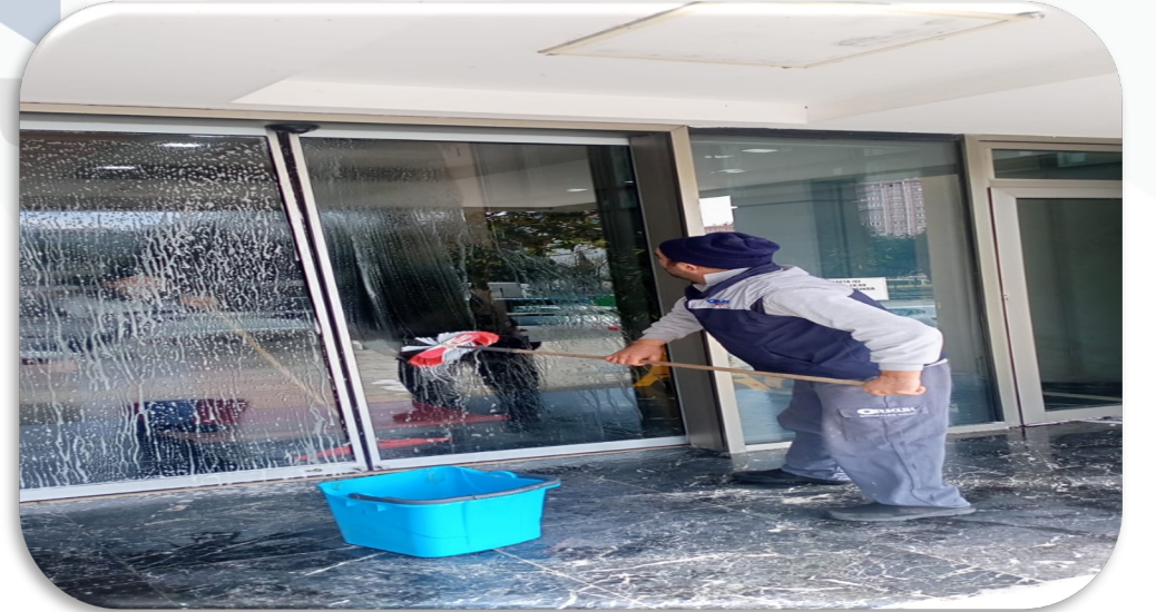
Blok giriş kapılarının detaylı temizliği gerçekleştirilmiştir.