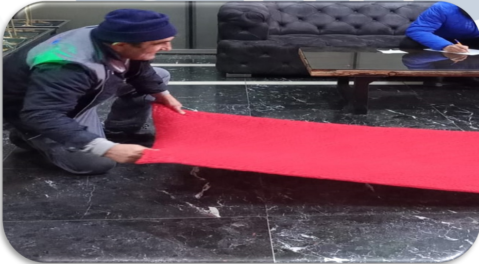
B Blok lobi kıvrırcık pasapası yenisi ile değiştirilmiştir.