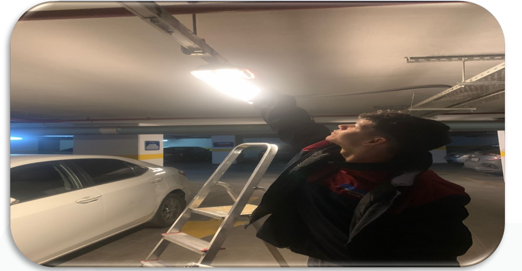
Kapalı otopark katlarının aydınlatma kontrolleri sağlanmıştır.