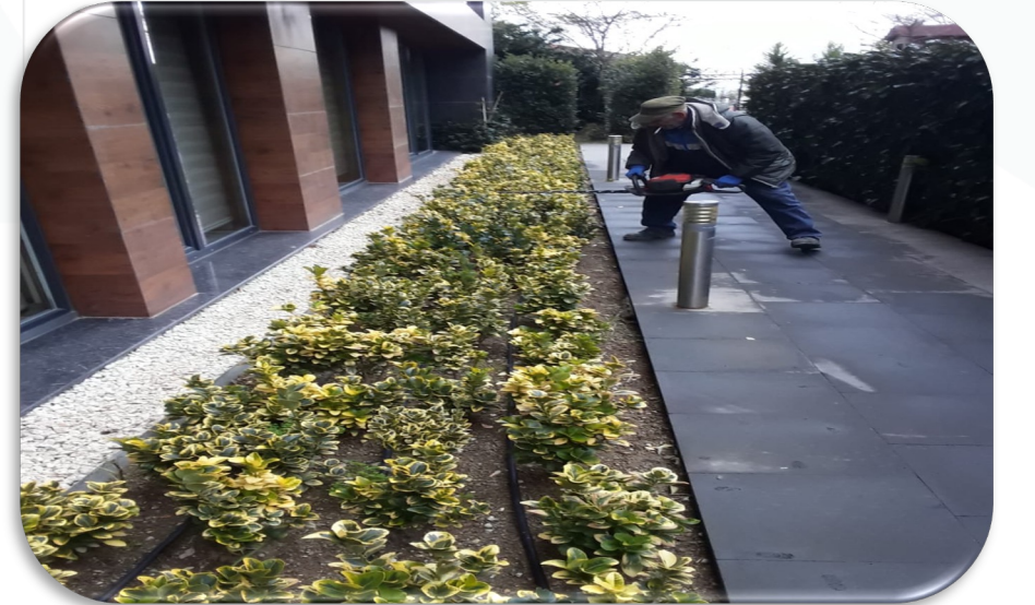
Site içi peyzaj çalışmaları