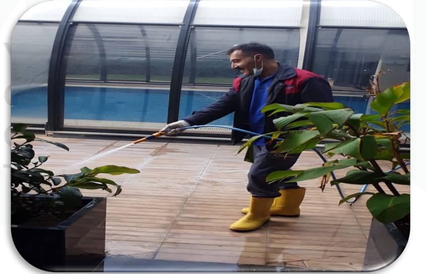
Her Pazartesi günü detaylı havuz temizliği ve bakımı yapılmaktadır.