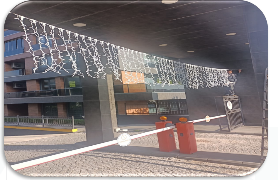
Yılbaşı için ışıklandırma çalışması.