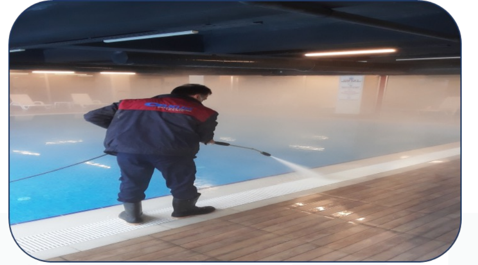
Belediye tarafından budama işlemi