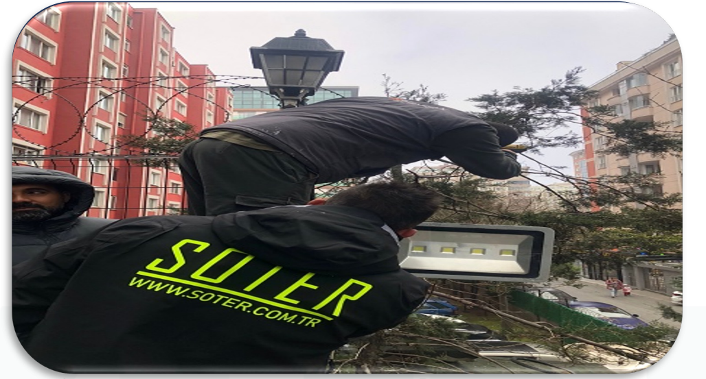
Kamera Sistemi revizyon çalışması gerçekleştirilmiştir.