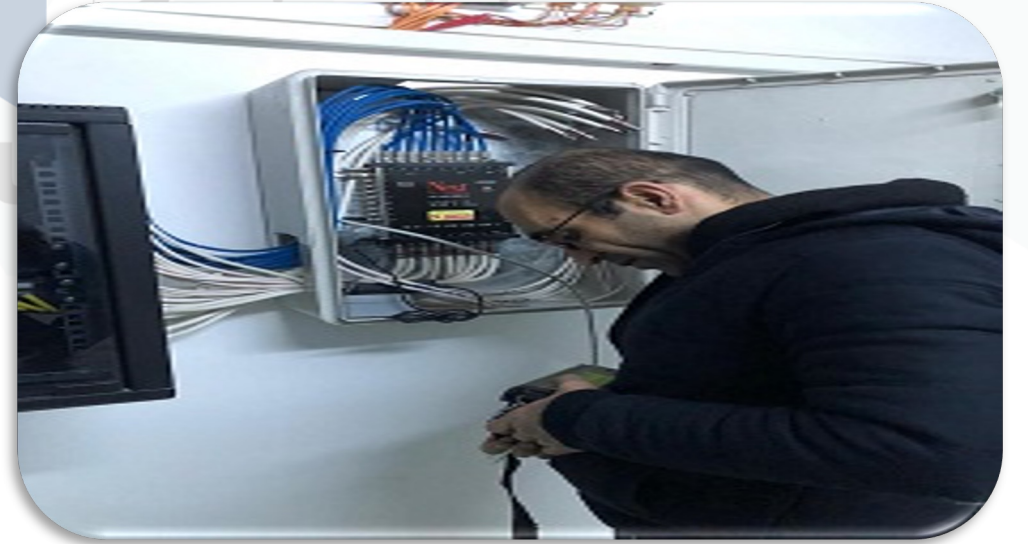
Ortak alan uydu yayını periyodik bakım faaliyeti gerçekleştirilmiştir.