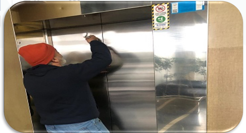
Asansörlerin aylık bakım faaliyeti gerçekleştirilmiştir.