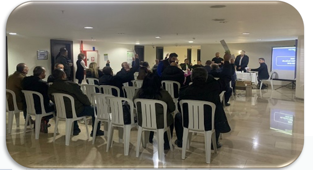
2023 yılı Olağan Genel Kurul Toplantısı gerçekleştirilmiştir.