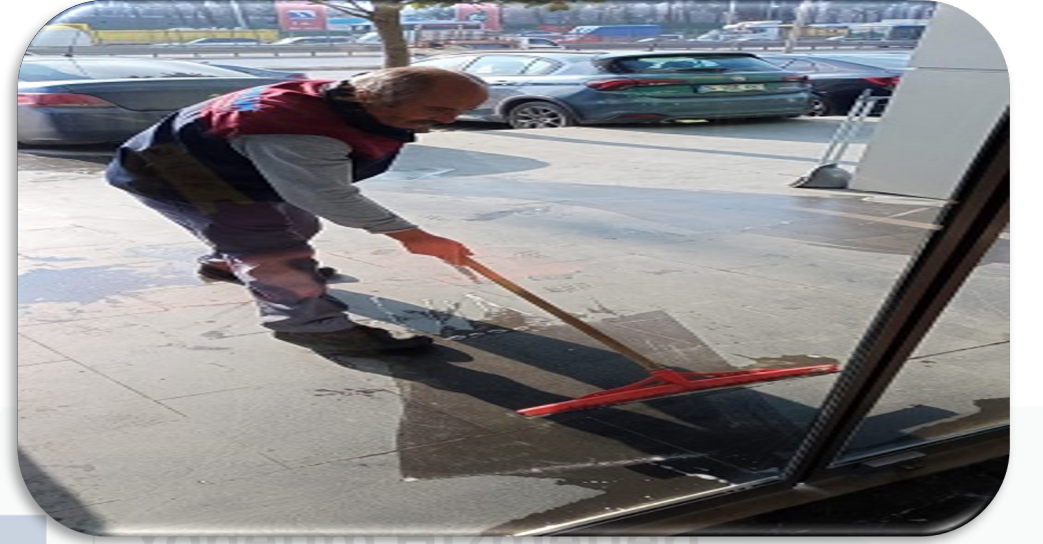
Blok giriş kapılarının temizliği gerçekleştirilmiştir.