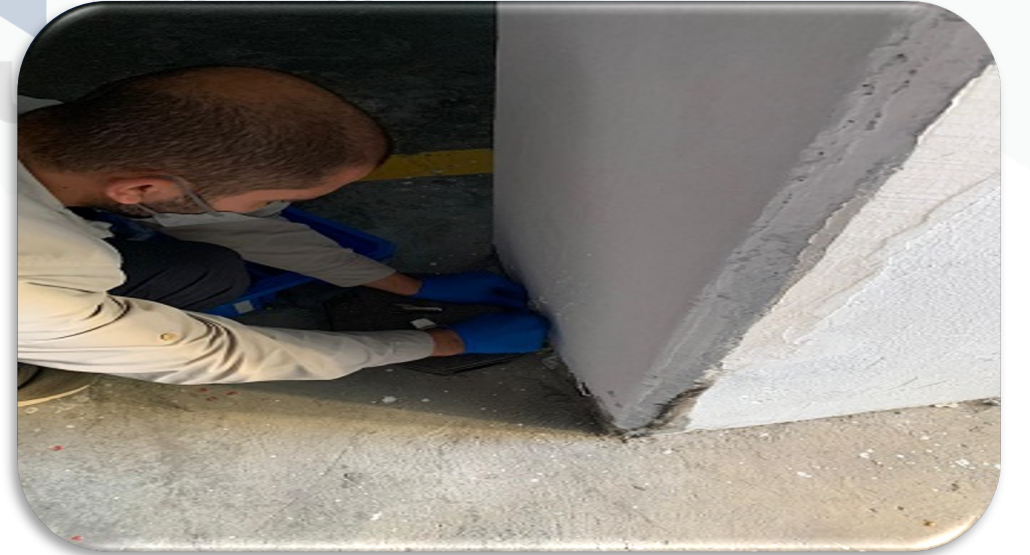
Periyodik ortak alan ilaçlama faaliyeti gerçekleştirilmektedir.