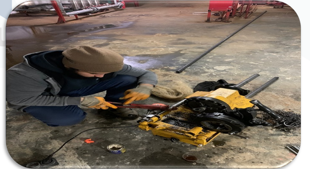
Hidrofor odası otomatik söndürme sistemine ek olarak 4 adet spring sistemi ilave edilmiştir.