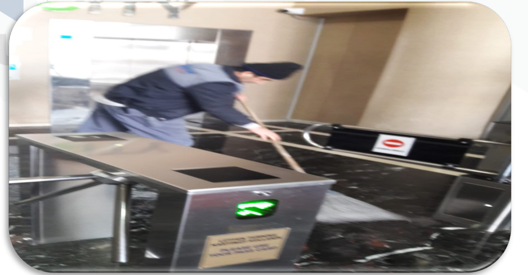
Ortak alan zemin temizliği gerçekleştirilmiştir.