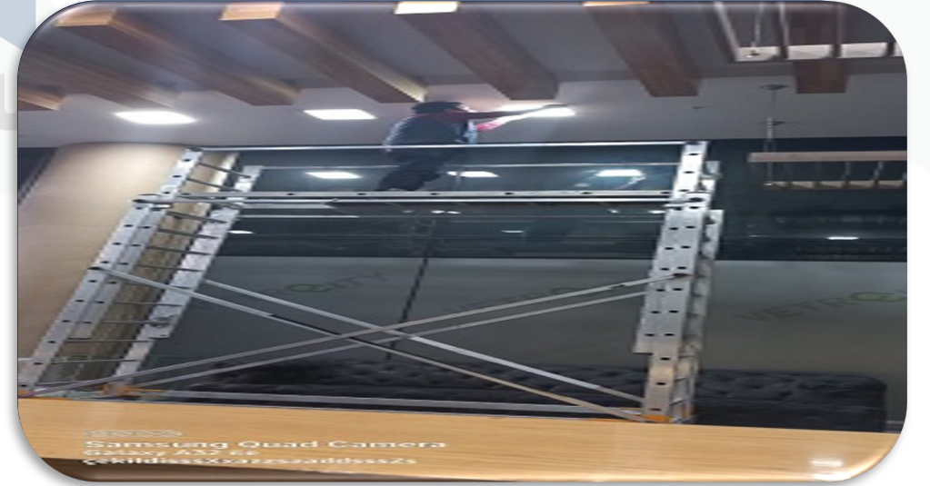
Lobilerin arızalı tavan aydınlatmaları yenilenmiştir.