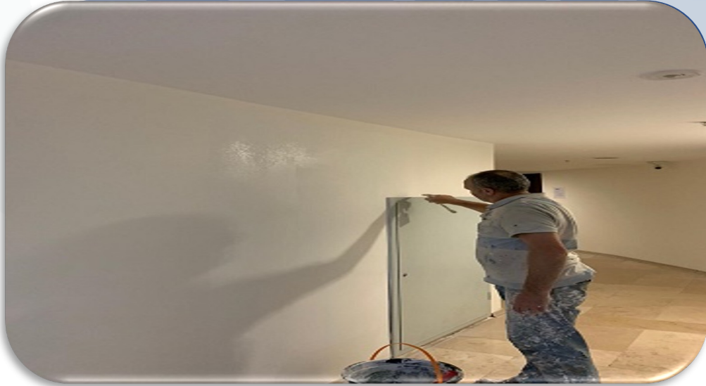
Ortak alanda değişen şaft kapaklarının çevresinde alçı boya işlemleri sürdürülmüştür.