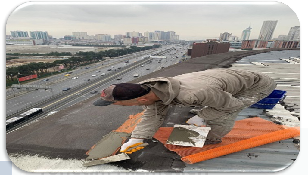
Çatıda lokal izolasyon gerçekleştirilmiştir.