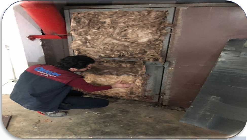
Hidrofor odası kapı üzerindeki boşluklar dayanıklı malzeme ile yalıtılmıştır.