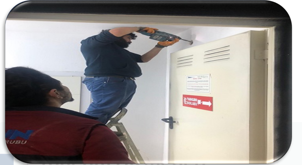
Katlardaki elektrik odalarına otomatik söndürme sistemi ile yapılmıştır.