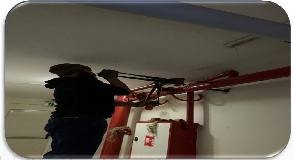
Yangın mekanik sistemindeki arızalı 4 adet test drenaj vanası yenileri ile değiştirilmiştir.