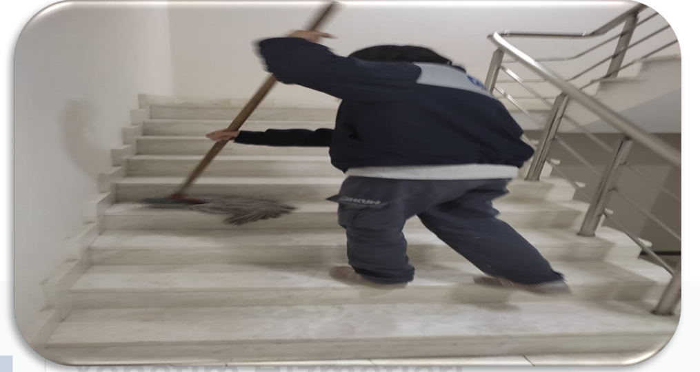
Yönetim Hizmetleri Gayrimenkul Yangın merdivenleri temizlenmektedir.