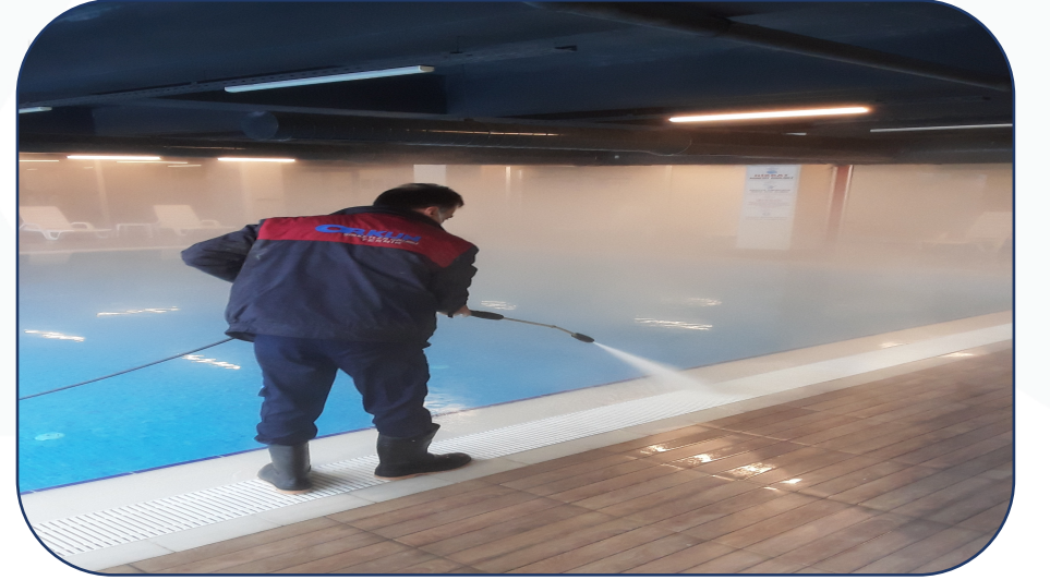
Her Pazartesi günü detaylı havuz temizliği ve bakımı yapılmaktadır.