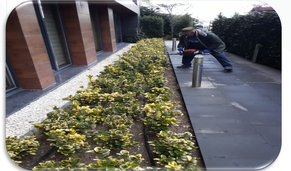
Site içi peyzaj çalışmaları