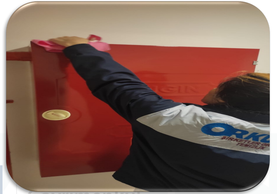
Yangın panoları düzenli olarak temizlenmektedir.