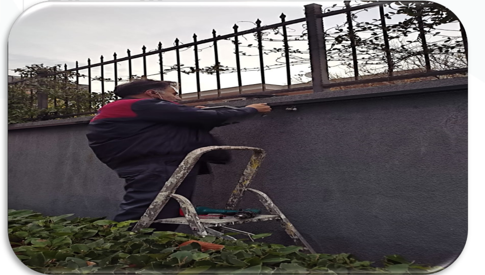
Arızalı aydınlatmalar değiştirilmiştir.