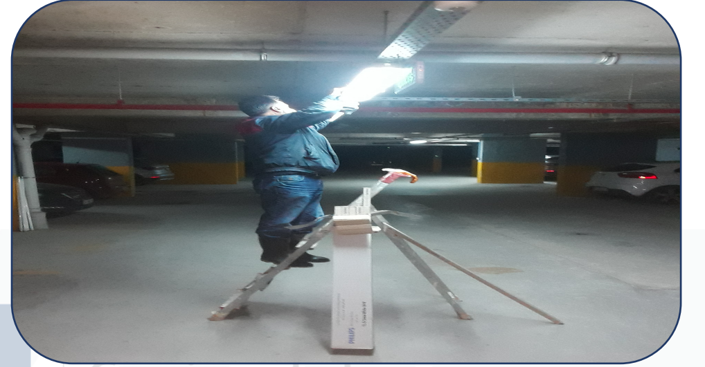
Aydınlatmalar düzenli olarak kontrol edilmektedir.