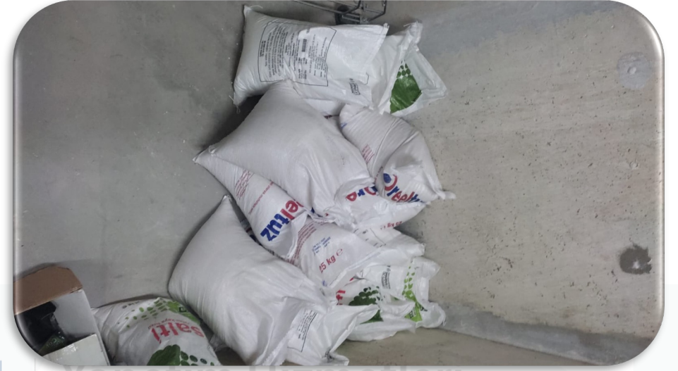
Tuz alımı yapılmıştır.