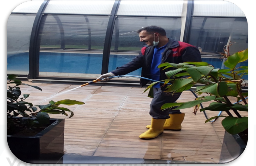
Haftalık havuz bakımları yapılmaktadır..