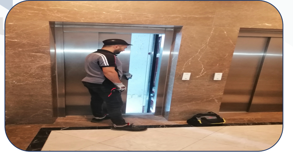
D Blok asansör patenleri değiştirilmiştir..