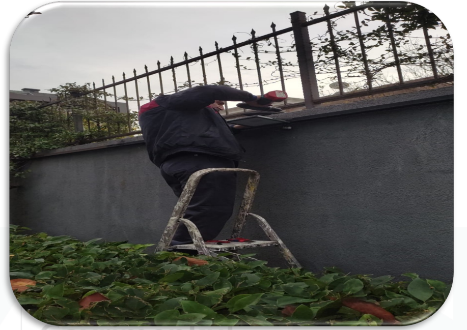
Arızalı olan bahçe aydınlatmaları onarılmıştır.