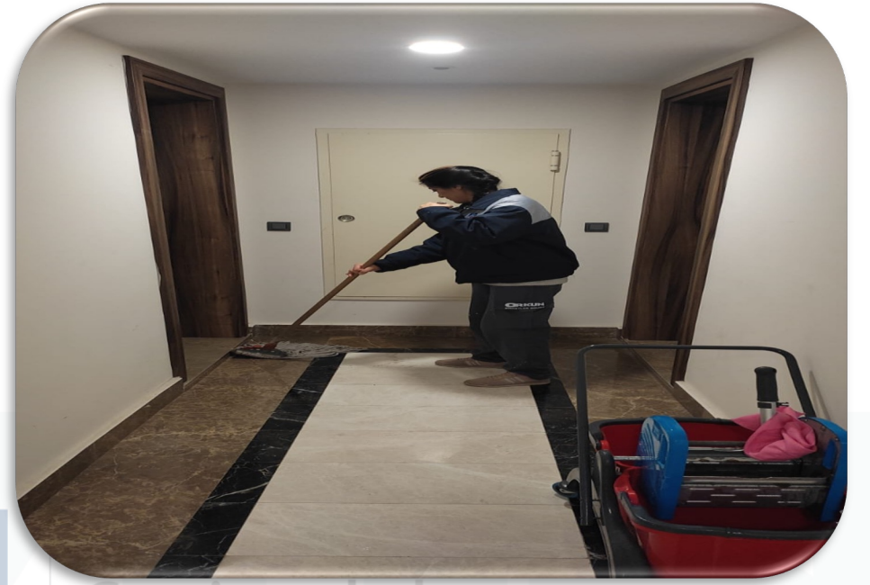
Düzenli olarak blok temizliği yapılmaktadır..