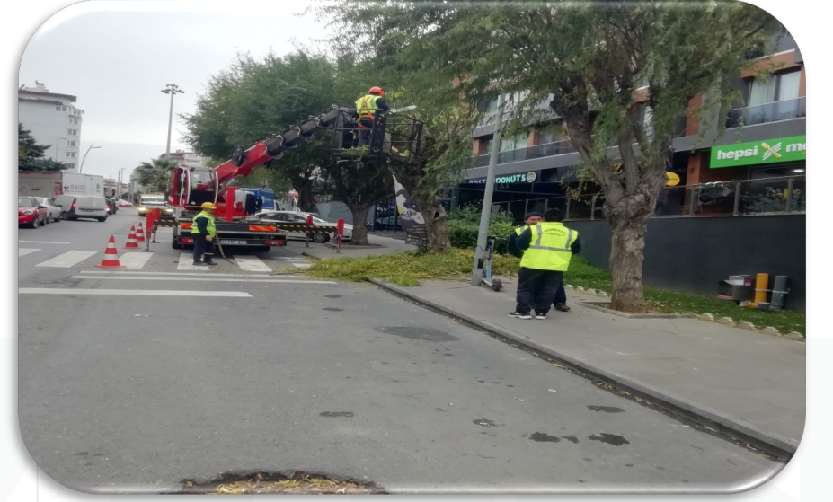
Belediye tarafından budama işlemi