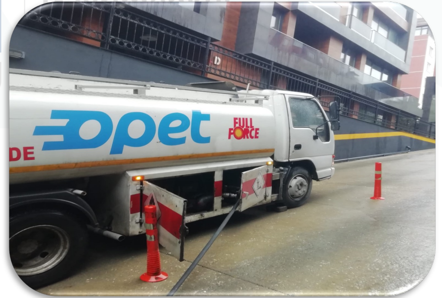
➤ Mazot alımı yapılmıştır.