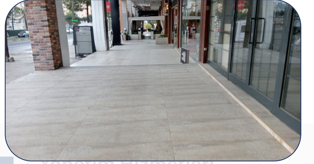
Dükkan Önleri Mıntıka Temizlik İşlemi