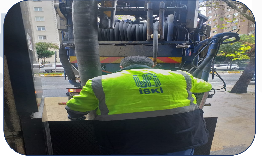
Atık Su Giderlerinin Temizlik İşlemi