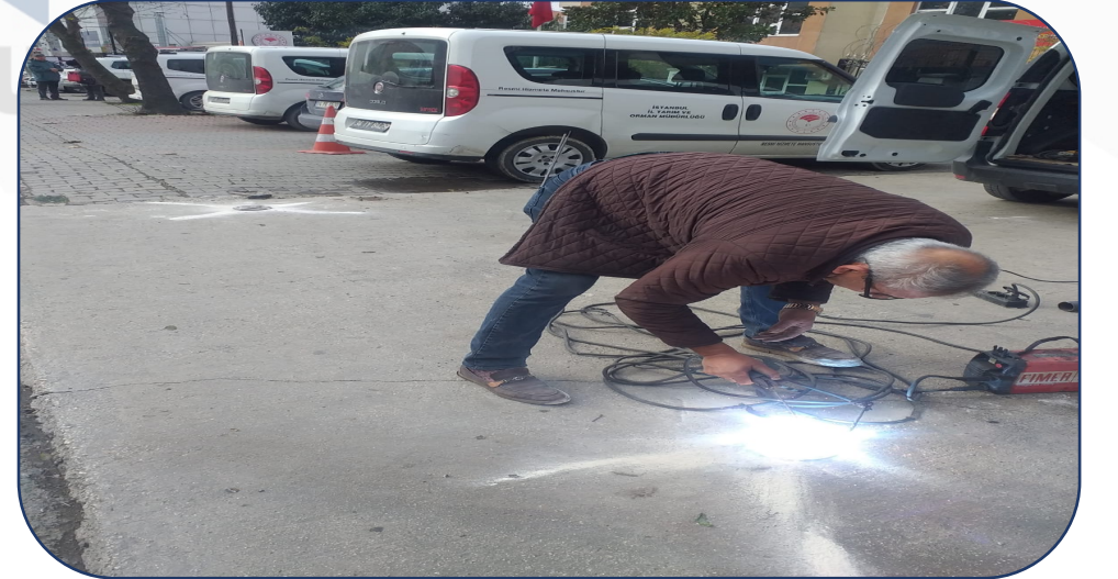
Zincir Duba Kaynak İşlemi