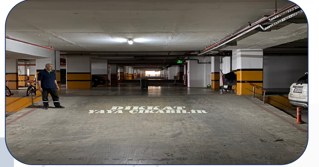
Uyarı Yazısı Boyama İşlemi