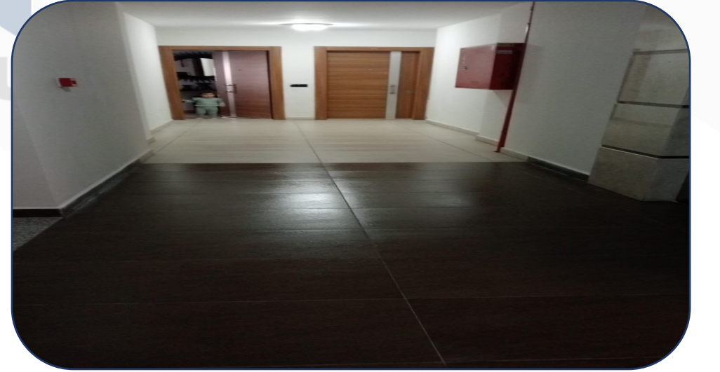
Blok Temizlik İşlemi