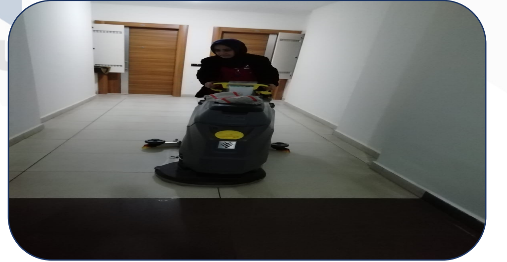
Makinele Yıkama İşlemi