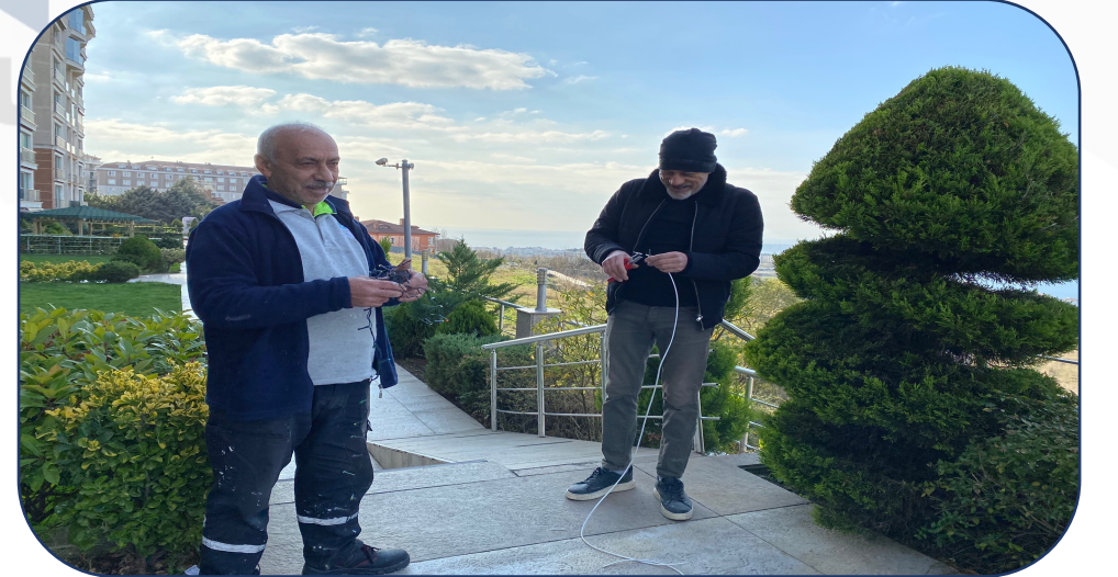
Süsleme İçin Elektrik Çekilmesi İşlemi