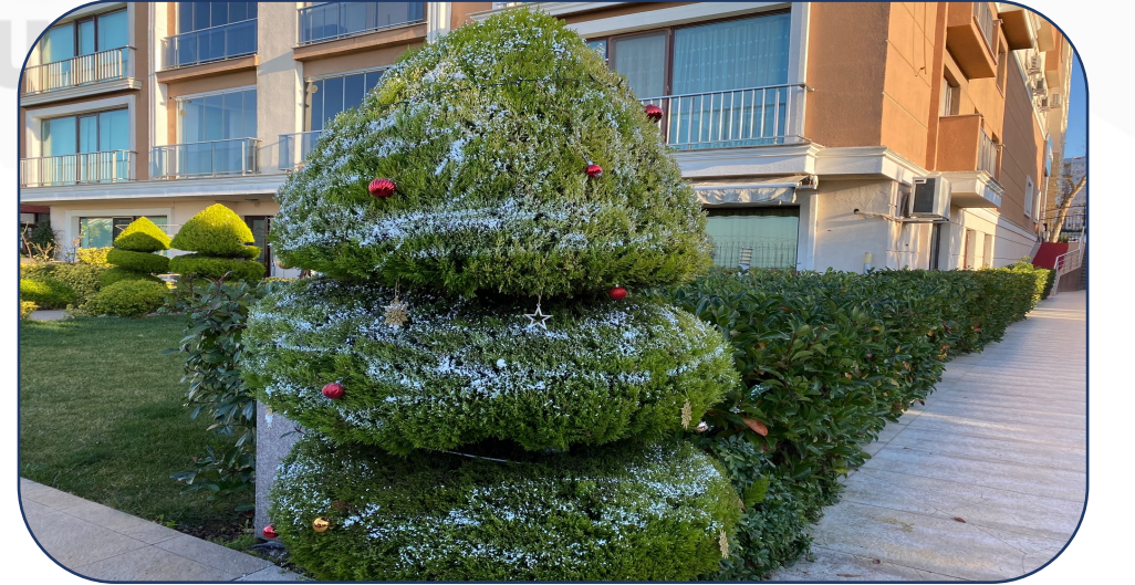
Ağaç Süsleme İşlemi