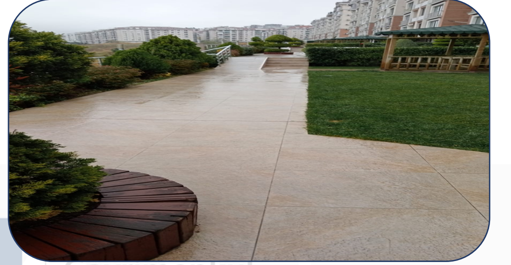
Ağaç Budama İşlemi