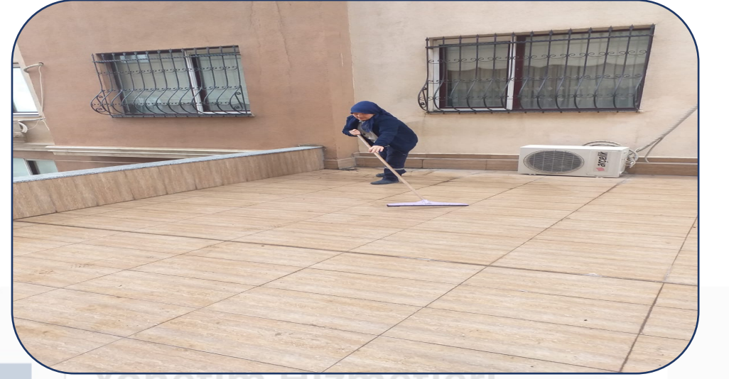
Dükkan Üstleri Temizlik İşlemi