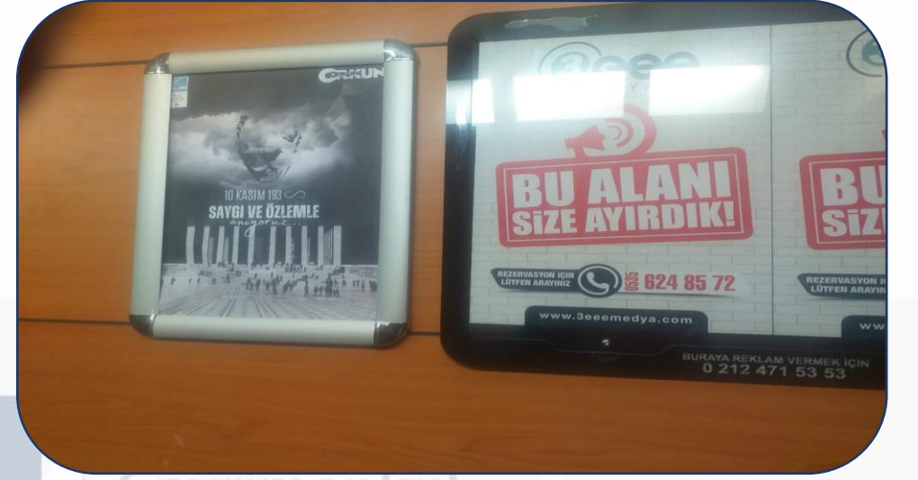
10 Kasım Atatürk'ü Anma Günü Afışı