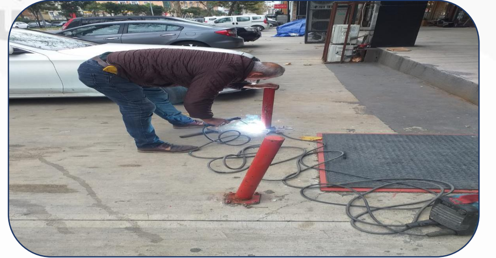
Dubaların Kaynak İşlemi