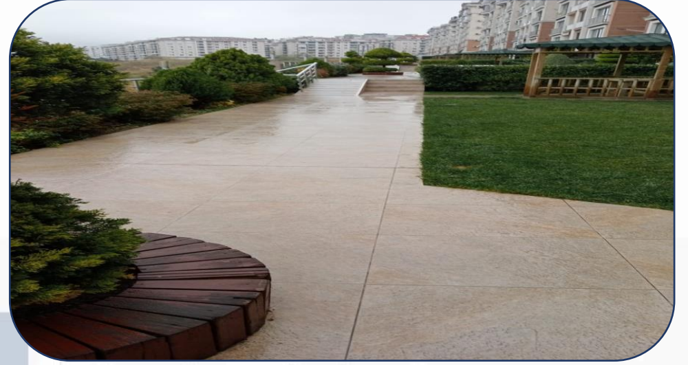
Bahçe Yürüme Yolları Yıkama İşlemi