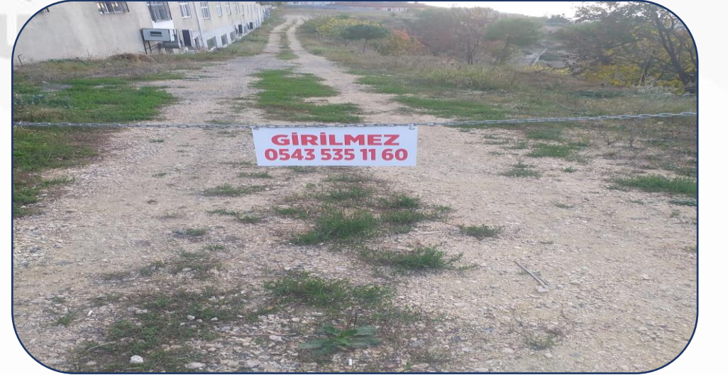
Toprak Yol “Girilmez” Levhası