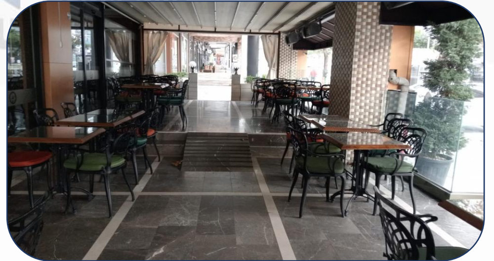
Dükkan Önleri Temizliği