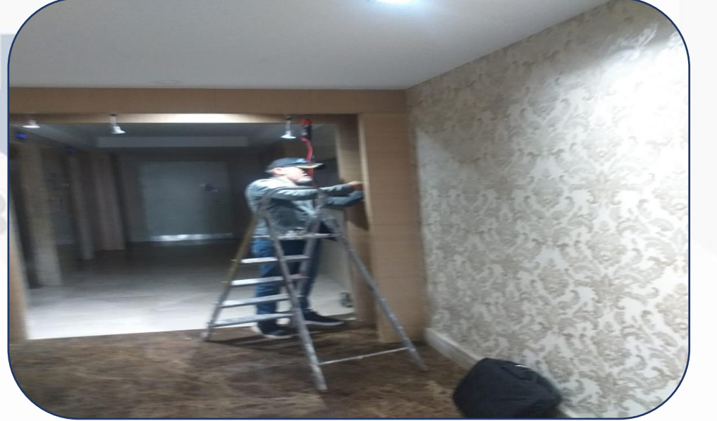
B Blok Giriş Sensörleri