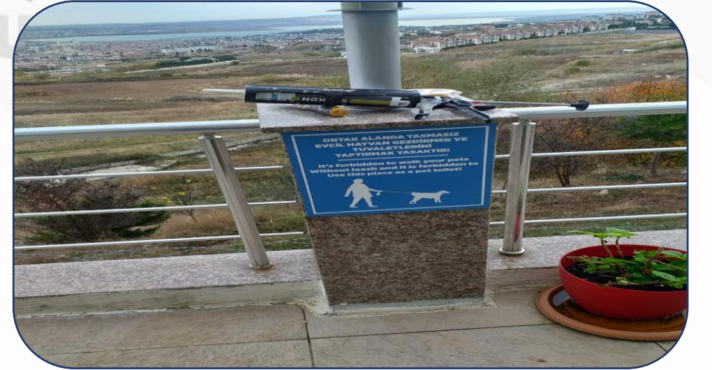
Tasmaşız Köpek Gezdirilmez Uyarı Levhası