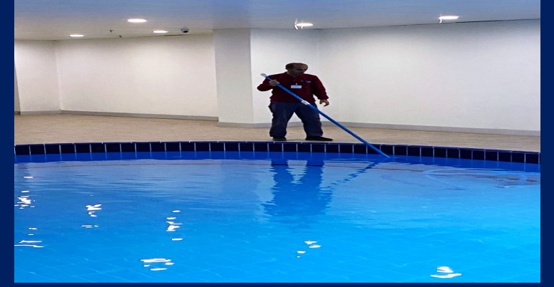
Havuz periyodik temizliđi yapılmıřtır.