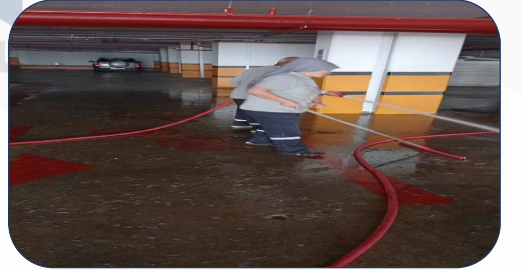
Otopark yıkama işlemi