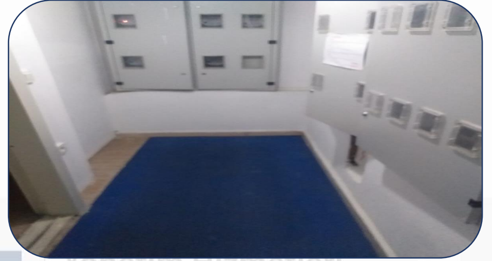
Elektrik odaları temizliği