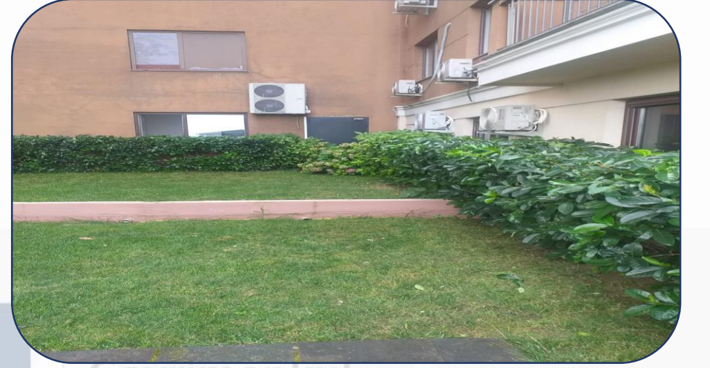
Bitki ilalama iŖlemi