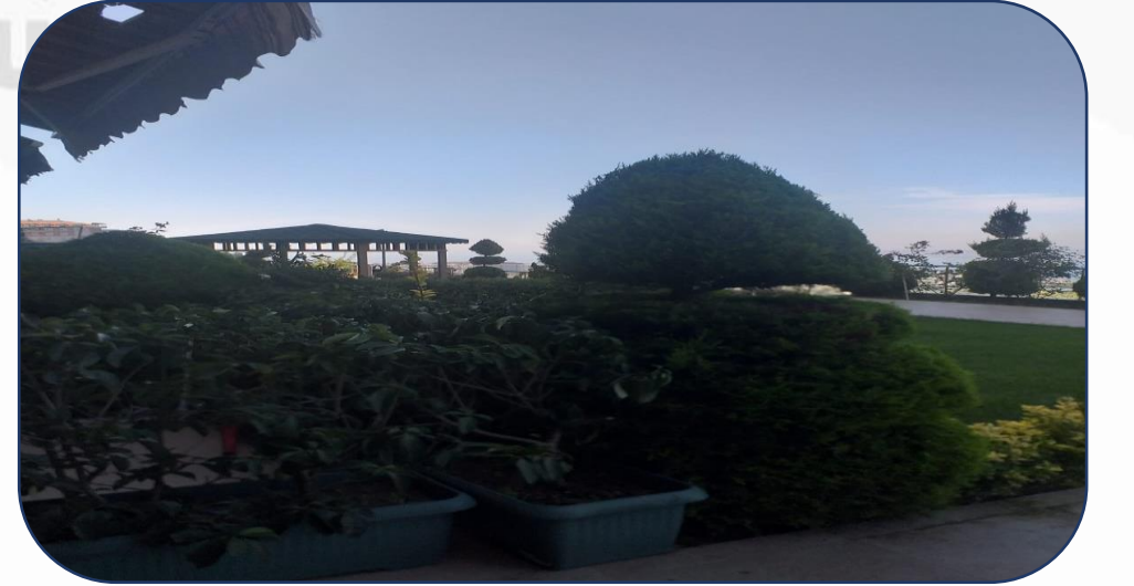
Bahe budama iŖlemi