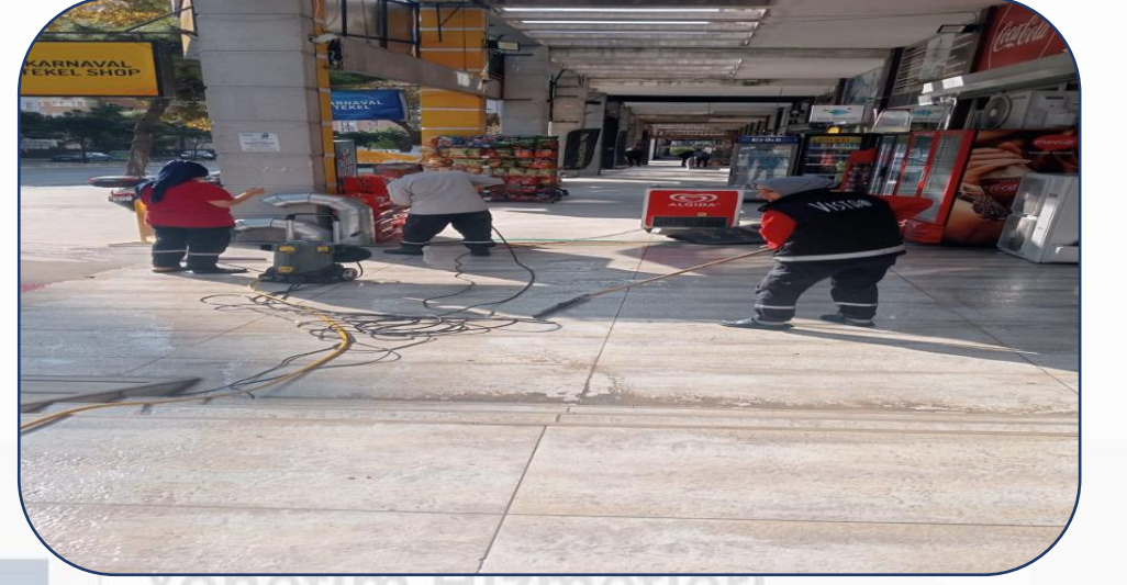
Dükkan önleri yıkama işlemi