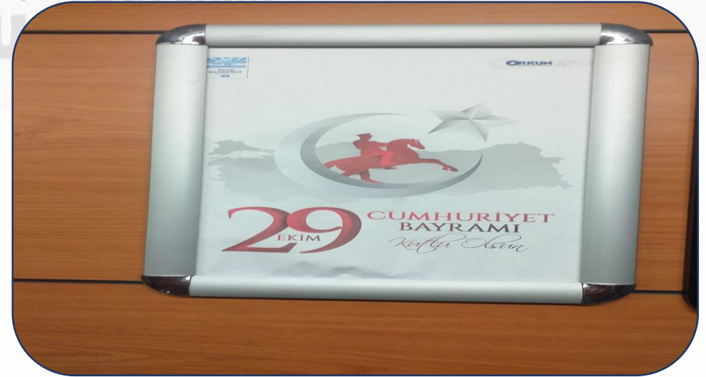
29 Ekim Cumhuriyet Bayramı Afiş