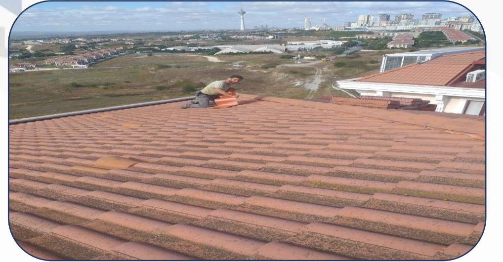
Baca izolasyon işlemi ve çatı kontrolü