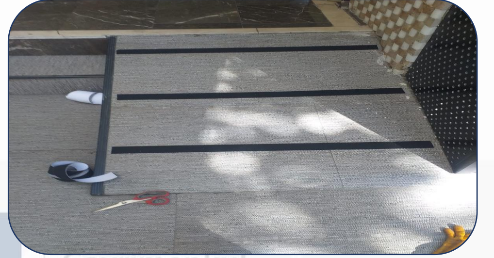
Kaydırmaz bant çekme işlemi