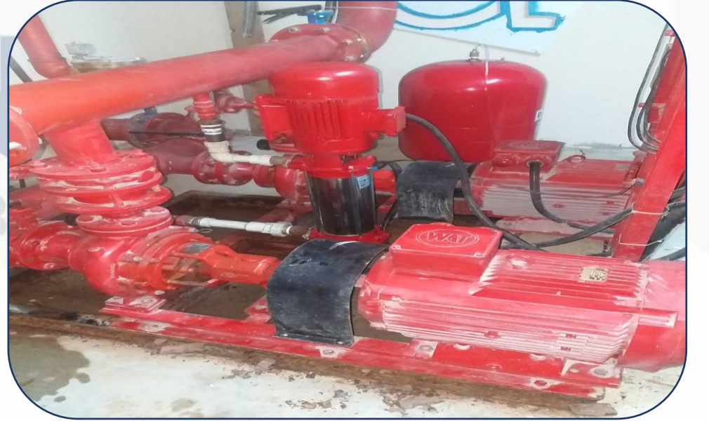
Yangın Joker Pompası