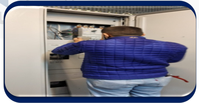
Kalorimetre sayaçlarından arızalı olanların randevuları alınıp firma çağırıldı ve arızalar giderildi.