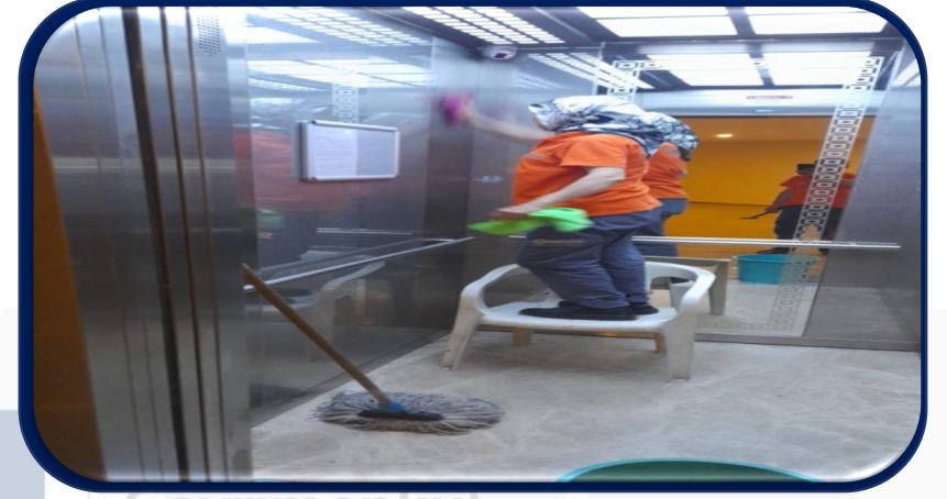
Asansör temizliği her gün yapılmaktadır