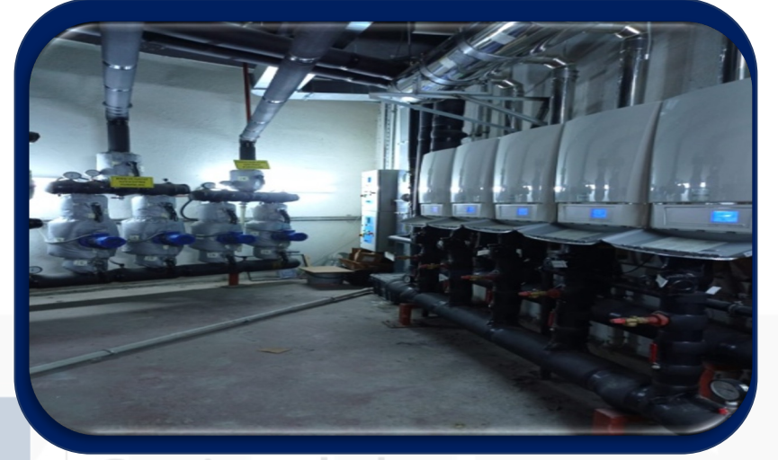
Kombi bakımları yapıldı, arızaları giderildi.