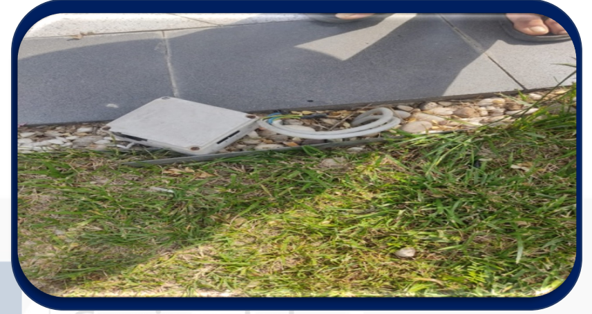
Bahçe otomatik sulamalar kontrol edildi.