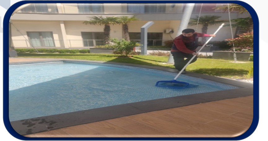
Her hafta sitenin iç dış havuzları temizlenip ölçümleri yapılmaktadır.