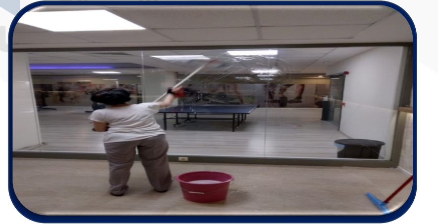
Sosyal tesis alanlar ve dış alanlar yıkandı.