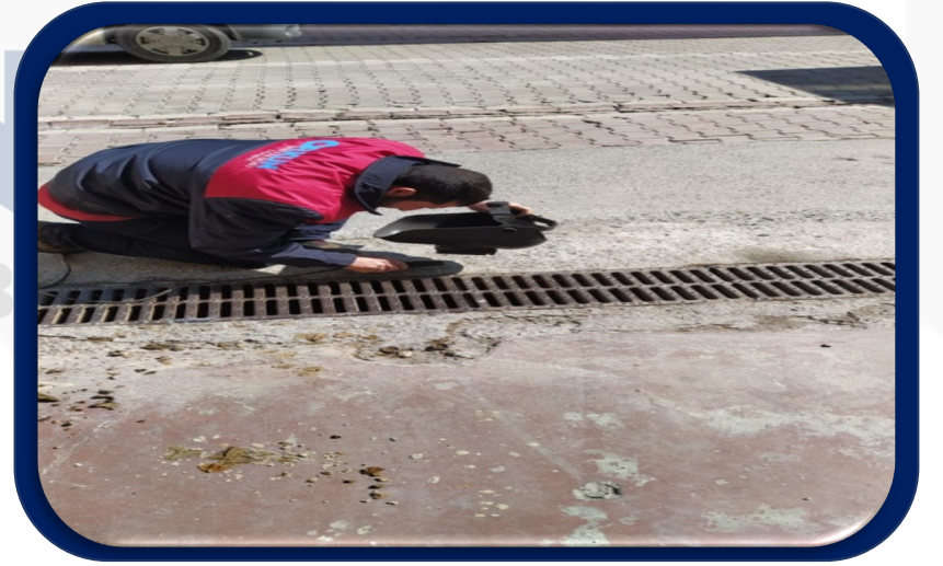
Site içi mazgallar ve süzekler temizlenmiştir.