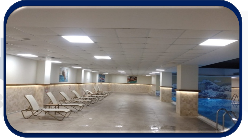
Sosyal tesis havuz aydınlatmaları arızası giderilmiřtir.