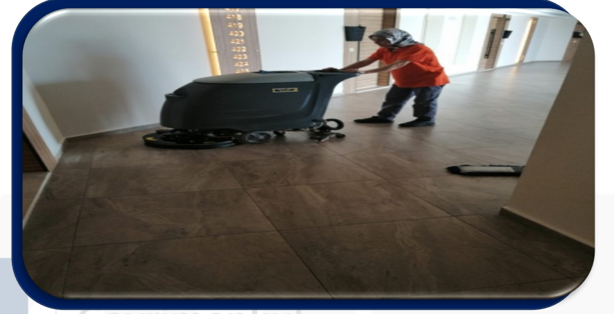
Katlar temizlik arabasıyla temizlendi