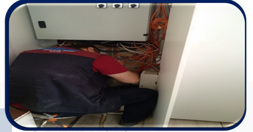
Asansör ve interkom sistemleri sorunlu alanlar düzeltilmiştir.