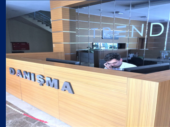
Güvenlik hizmeti gerçekleştirilmiştir.