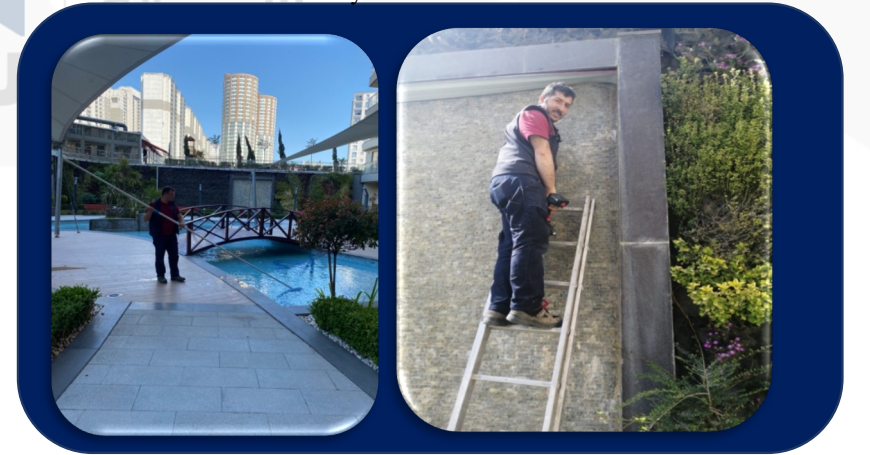
Süs havuzu temizliği günlük olarak yapılmakta. Dikey şelalenin bozuk olan parçası (sacı) değiştirildi çalışır duruma getirildi.