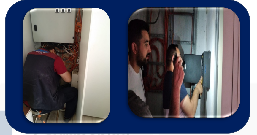
İNTERKOM VE WİFİ SİSTEM BAKIMI YAPILDI. ASANSÖR BAKIMLARI VE KUYULARIN BAKIMLARI YAPILDI.