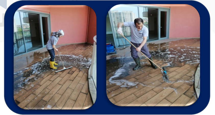
Bina içi balkonlar yıkandı