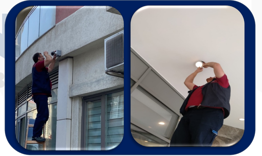
ARIZALI KAMERALARIN BAKIMLARI YAPILDI BOZUK OLAN DEĞİŞTİRİLDİ, BİNA İÇİ YANMAYAN SPOTLAR YENİSİ İLE DEĞİTİRİLDİ