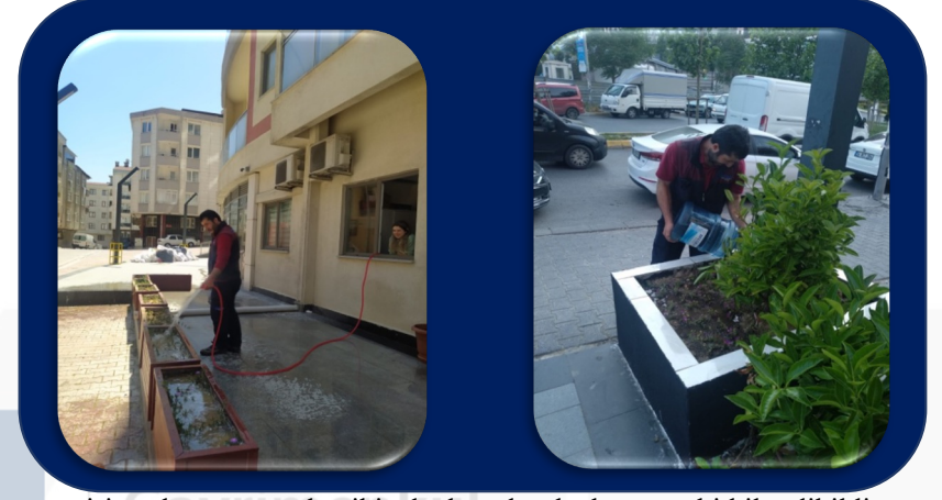
site ana giriş noktasına yapılan iki adet büyük saksılarımıza bitkiler dikildi ve sulama işlemi sabah akşam yapılmaktadır.