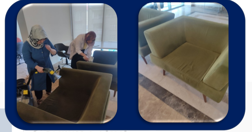
Bobideki koltuklar yıkatıldı