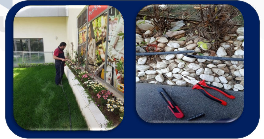
Saksılara dikilen bitkiler teknik ekip tarafından sulanmaktadır. Bahçe sulama hortumlarının tamirleri yapıldı.