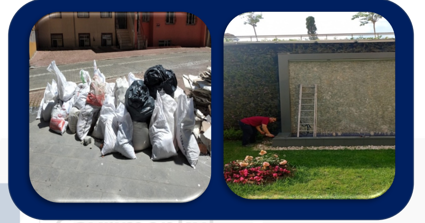
Ste çevresine atılan molozların tahliyesi yapıldı. Dikey şelalenin içi boşaltılarak izolasyona hazırlandı