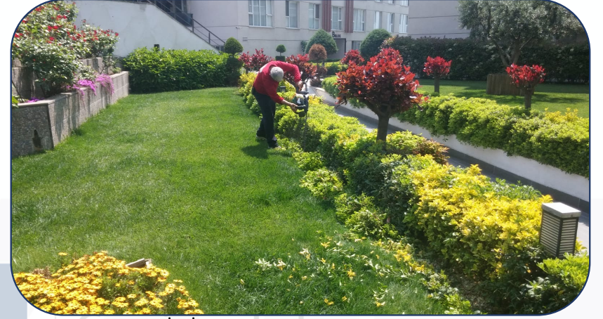
YENİ ÇİT BUDAMA MOTORU ALINDI VE KULLANIMA BAŞLANDI.