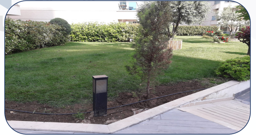
C BLOK ÖNÜNE AĞAÇ DİKİMİ YAPILDI.