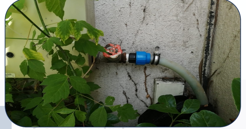
H BLOK İSKİ HATTINDAKİ KAÇAK GİDERİLDİ.