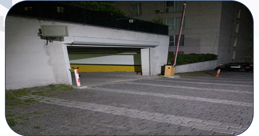
ARIZALANAN G BLOK KAPALI OTOPARK BARIYERİ ONARILDI.