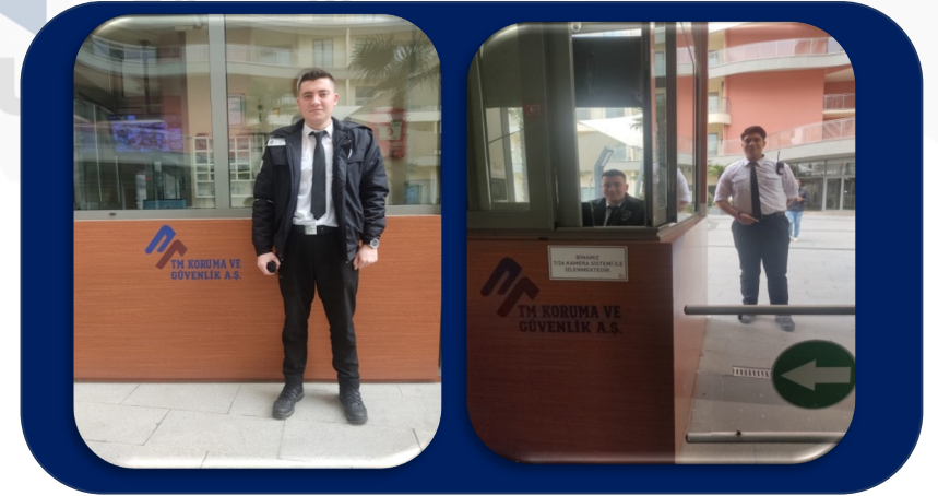
Giriş çıkış kontroller ve devriye