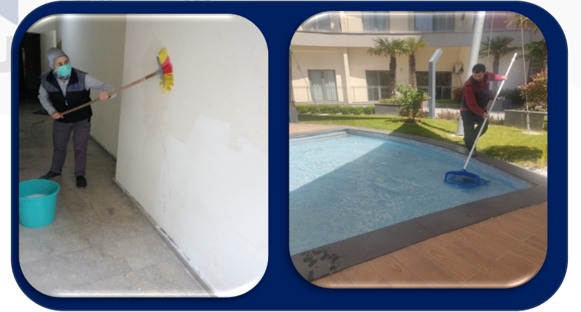
Yük taşıma alanının duvarları ve zemini detaylı temizlendi. Havuz içindeki çöpler alındı.