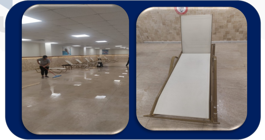
Sosyal tesis havuz çevresi ve şezlonglar basınçlı yıkama cihazıyla yıkandı.