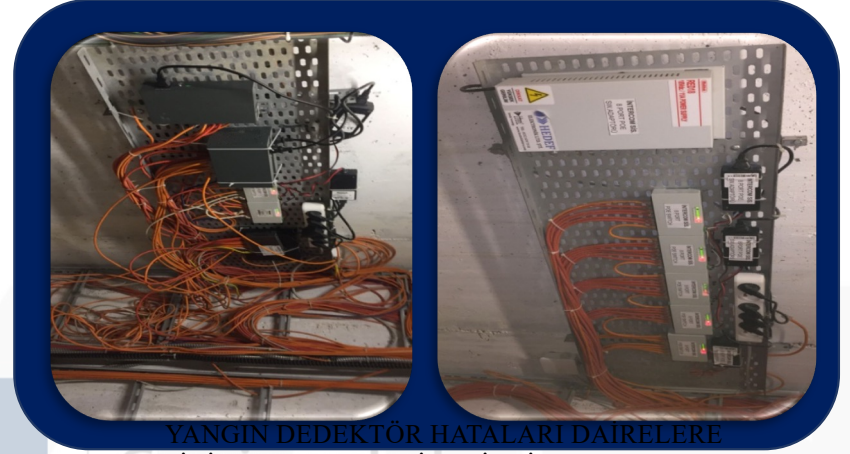
YANGIN DEDEKTÖR HATALARI DAİRELERE GİRİŞ YAPILARAK GİDERİLDİ. KABLOLAMA KARIŞIKLIĞI TOPLANARAK ÜZERİNE DAİRE NUMARALARI BELİRTİLDİ.