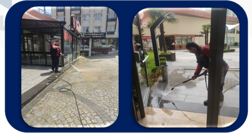
Dükkan önleri ve çevre temizliği teknik personeller tarafından yıkandı.