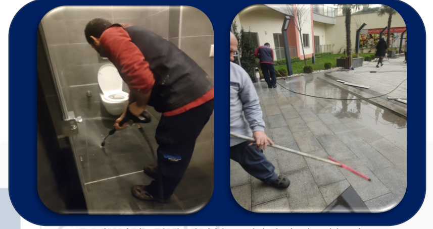
Sosyal tesis lavabolarda ki boya lekeleri çıkarıldı. Site girişi yıkandı.