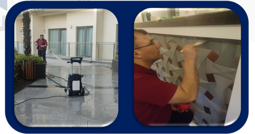
Site geneli mazgallar basınçlı su ile temizlendi. Sosyal tesis banko boyandı.