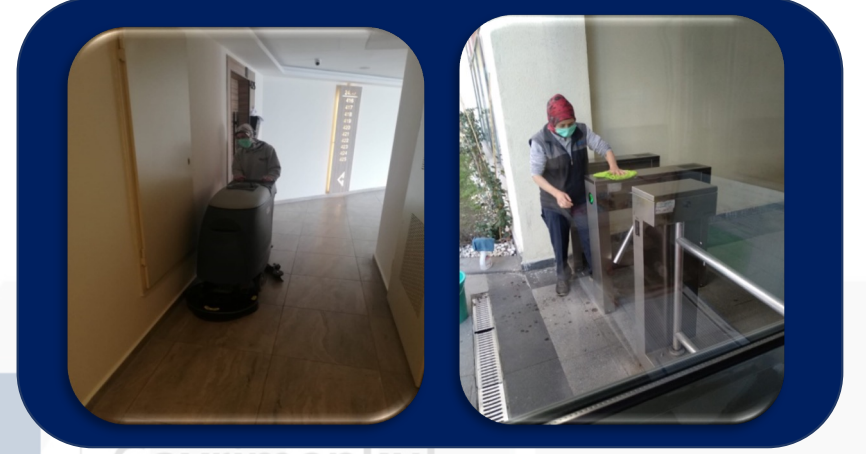
Katlar ve turnikeler özenle temizlendi.