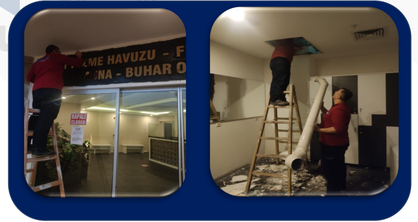
Sosyal tesis giriři boya iřlemi ve sosyal tesis içine denk gelen yağmur gideri tıkanıklığı giderildi.