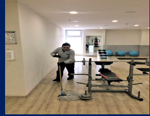
Sosyal tesisler temizlenmektedir.