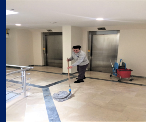
Site içi genel temizlik