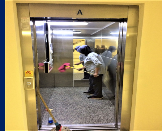
Asansör ii ve kapıları temizlenmektedir.