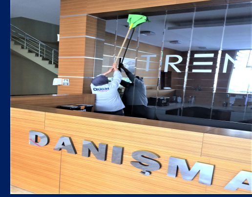
Site içi genel temizlik