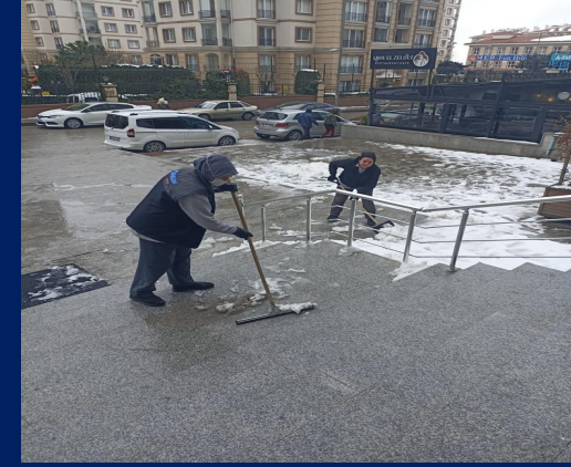
Site giriři temizlenmiřtir