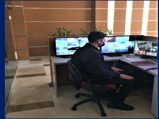
Güvenlik hizmeti gerçekleştirilmiştir.