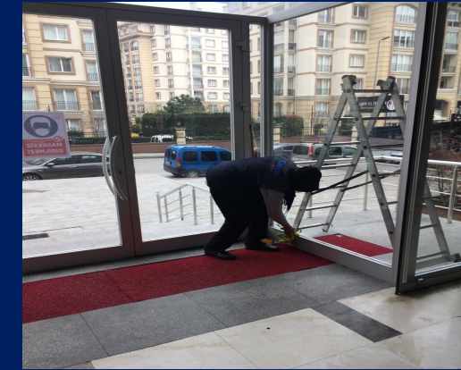
Lobi kapı camları silinmiřtir.