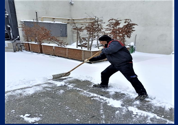
Kar temizleme çalışması