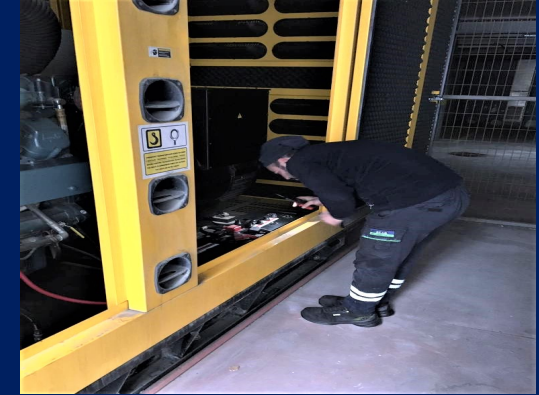
Jeneratör periyodik bakımı yaptırılmıştır.