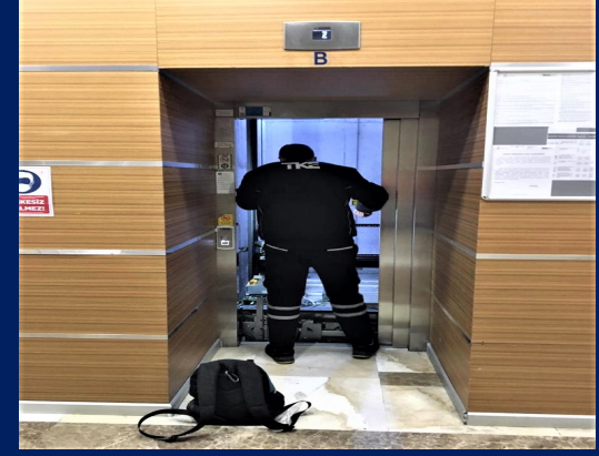
Asansör aylık periyodik bakımları yaptırılmıştır.