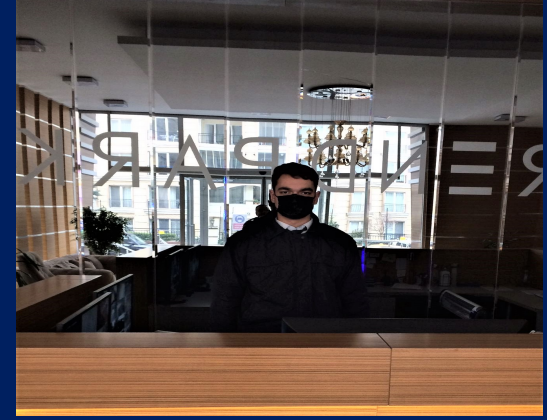
Güvenlik hizmeti gerçekleştirilmiştir.