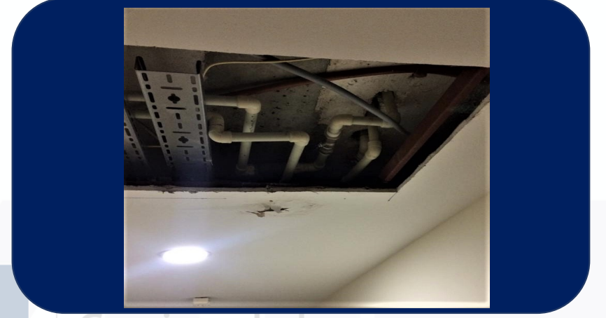
Şafttaki su kaçağı arızası giderilmiştir.