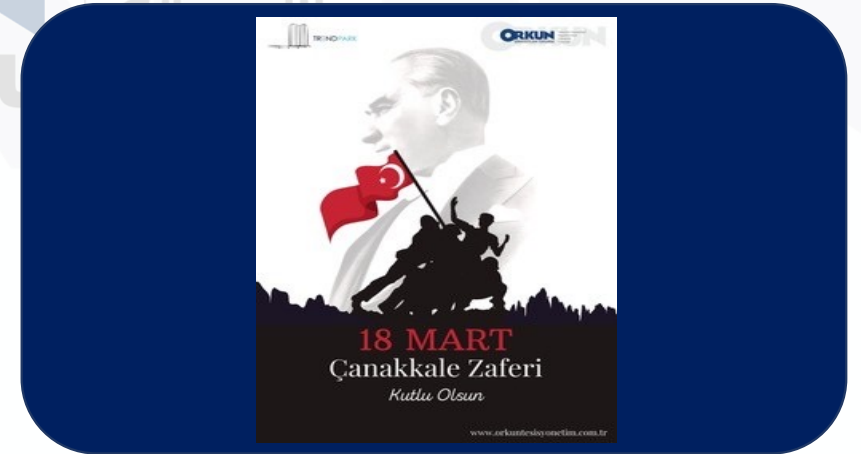
18 MART ÇANAKKALE ZAFERİ KUTLAMA MESAJI