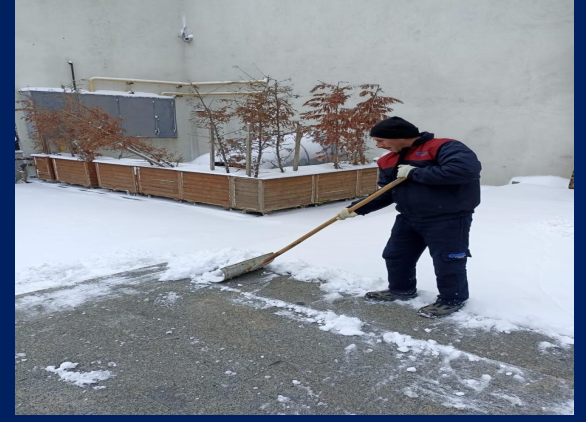
Kar temizleme çalışması