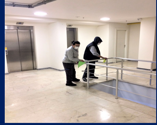
Site içi genel temizlik yapılmaya devam edilmektedir.