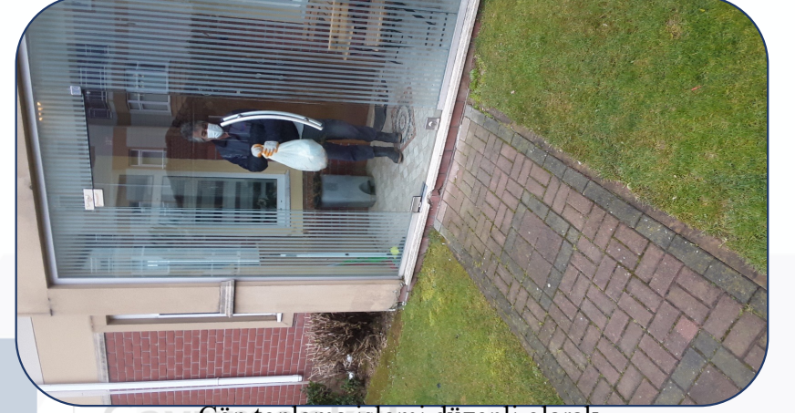
öp toplama iřlemi düzenli olarak yapılmaktadır.