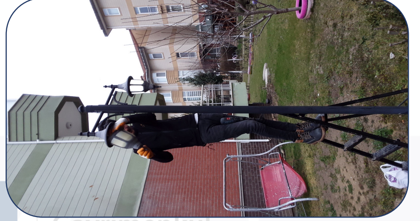
Ortak alan arızalı ampul deęiřimi