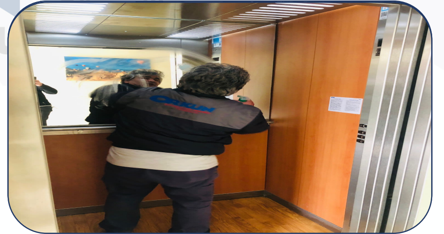
B Blok asansör temizliği yapılmaktadır.