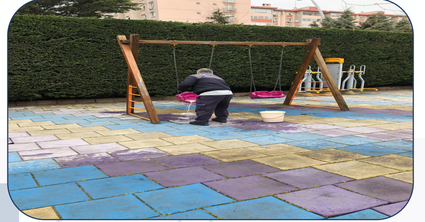
Çocuk parkı temizlenmektedir.