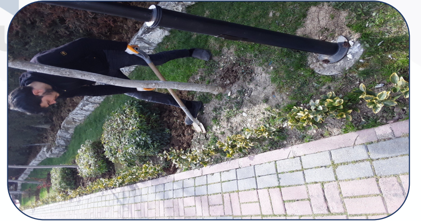
Çapalama işlemi yapılmaktadır.