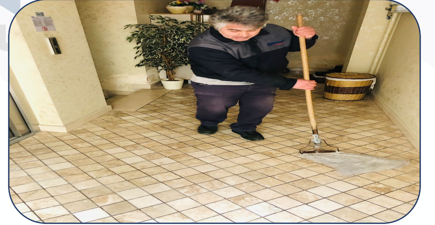
B Blok kat temizliđi yapılmaktadır.