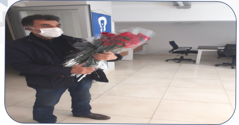
08 Mart Kadınlar gününde karanfil dağıtılmıştır.