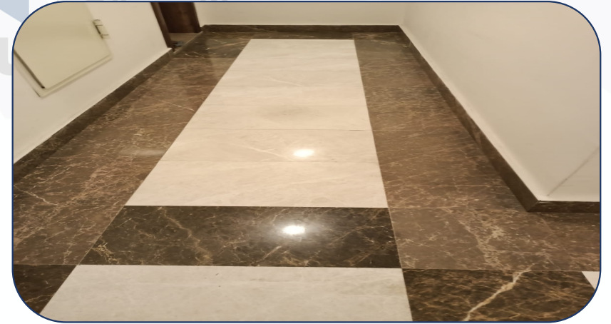
Blokların tüm katları düzenli olarak temizlenmektedir.