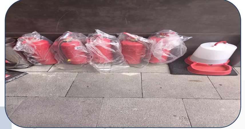
YSC ' lerin 4 yıllık bakımı yapılmıştır.