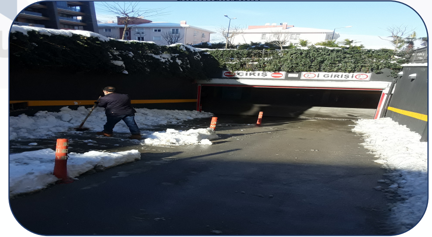
Karla mücadele yapılmıştır.