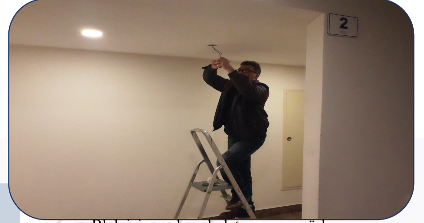
Blok içi arızalı aydınlatma ve sensörler değiştirilmiştir.