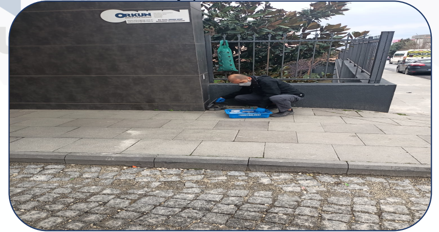
Kontrolpest firması tarafından Pest faaliyetleri yapılmaktadır