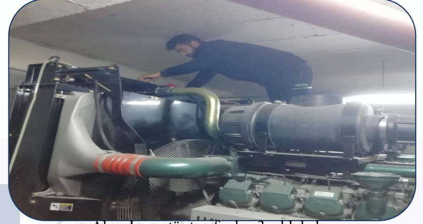
Aksa Jenerat6r tarafından 3aylık bakım yapılmıřtır.