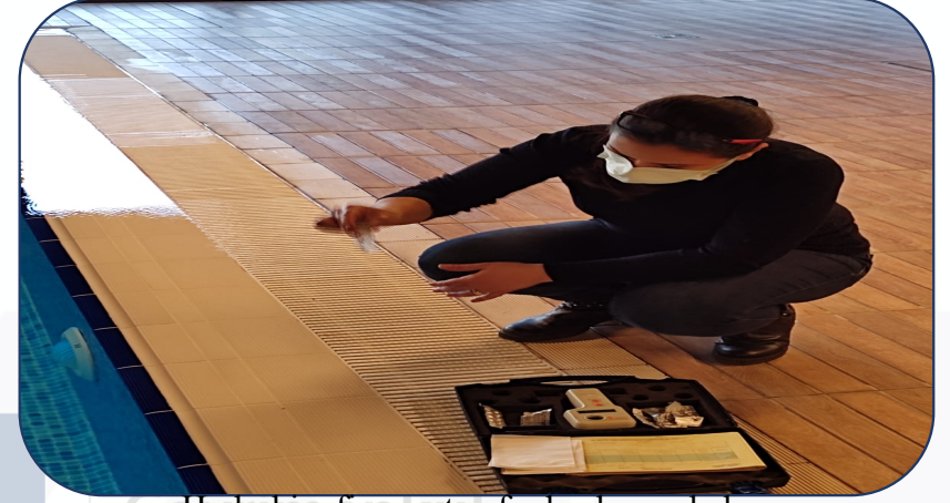
Hydrokim firması tarafından havuz bakımı yapılmaktadır.