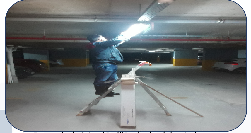
Aydınlatmalar düzenli olarak kontrol edilmektedir.