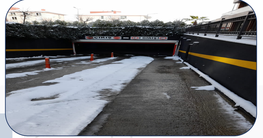
Kar temizliđi yapılmıştır.