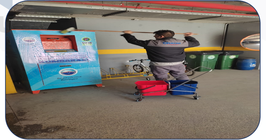
Otopark düzenli olarak temizlenmektedir.