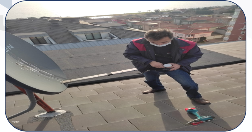
Arızalı LNB' ler değiştirilmiştir.