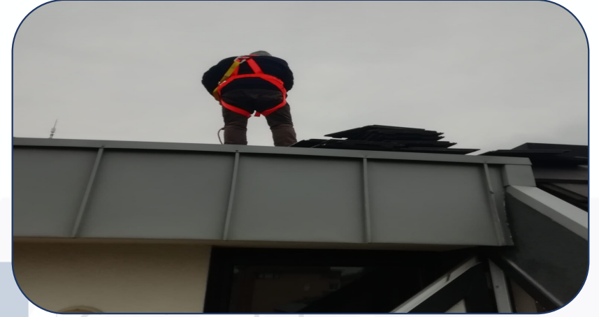
A ve C blok çatı onarımları yapılmıştır.