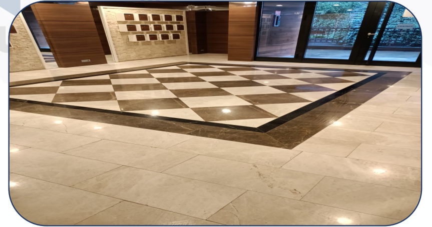
Blok girişleri düzenli temizlenmektedir.