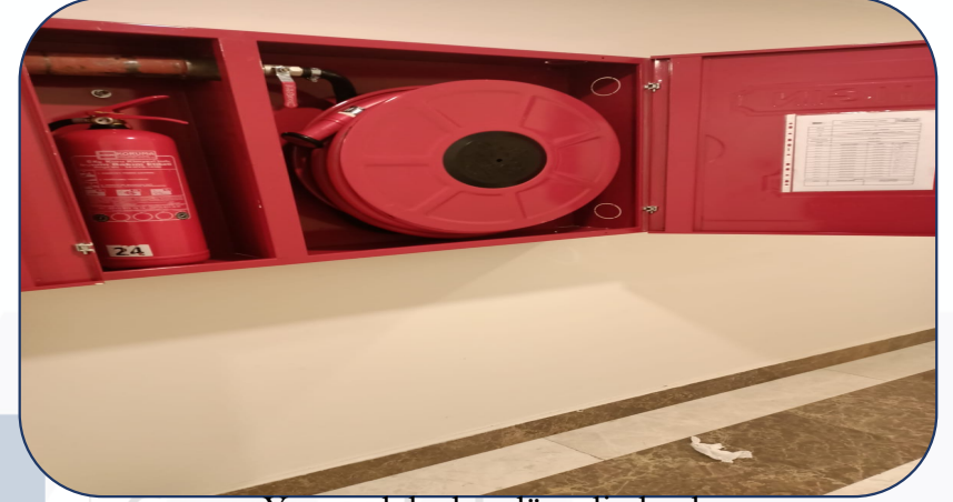
Yangın dolapları düzenli olarak temizlenmektedir.