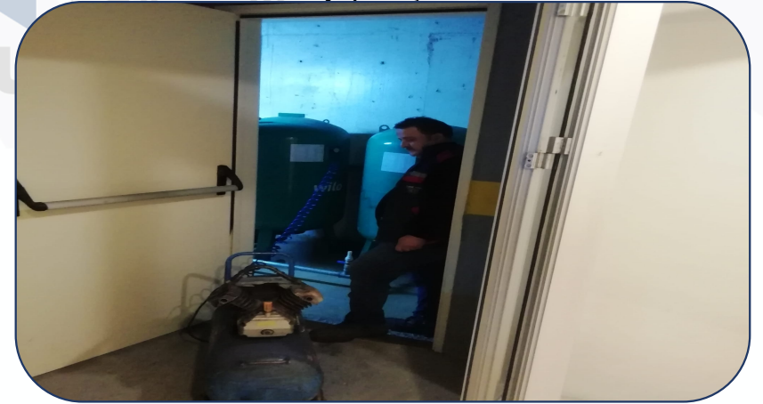
Emse Pompa tarafından 6 aylık bakım yapılmıřtır.