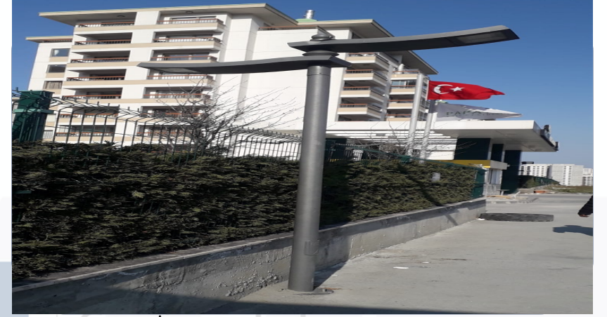
ENERJİ TASARRUFU KAPSAMINDA PEYZAJ VE DİŐ AYDINLATMALARDA EKŐİLTME YAPILDI.