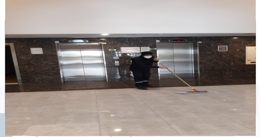
KURU MOB UYGULAMASI