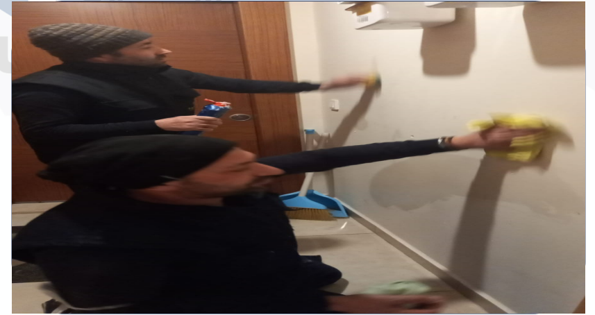
BİNA İİ DUVARLARIN SİLİNMESİ.