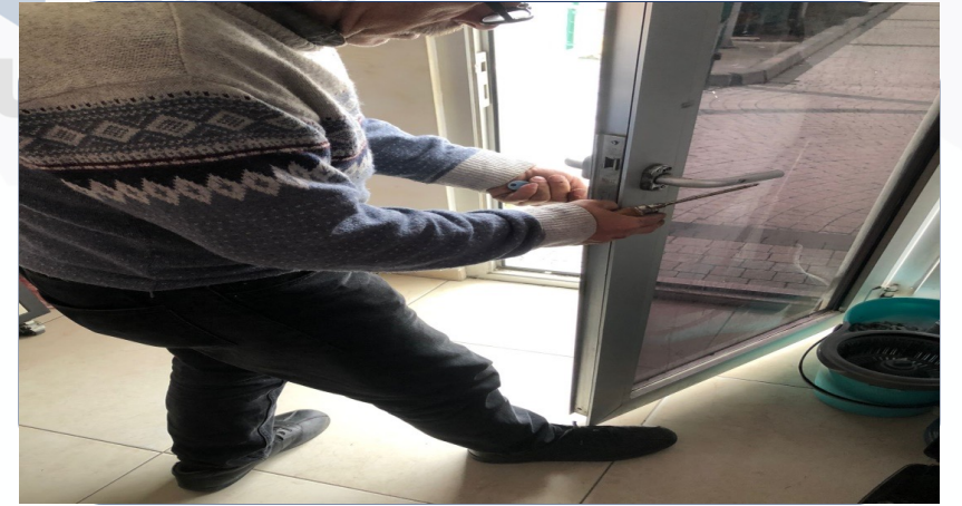
GÜVENLİK NOKTASI KAPI KİLİDİ ONARILDI