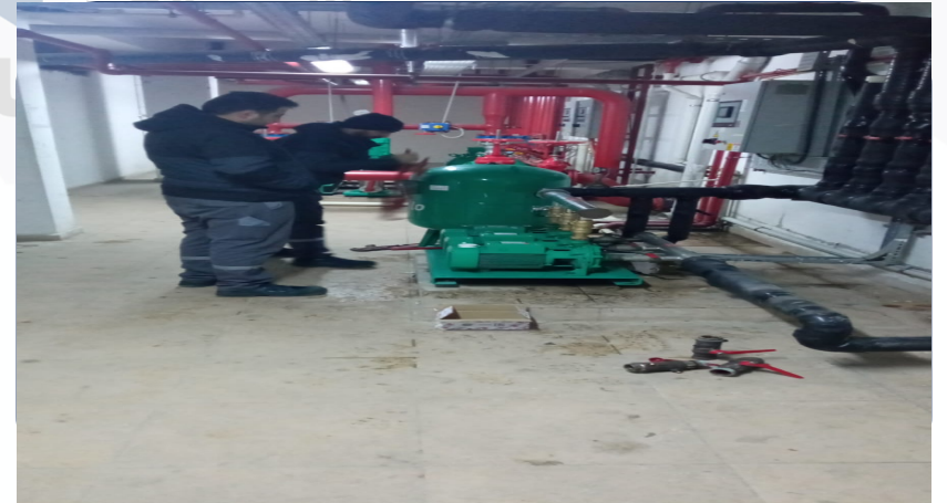
HİDROFOR ROBEX VANA DEĞİŞİMİ