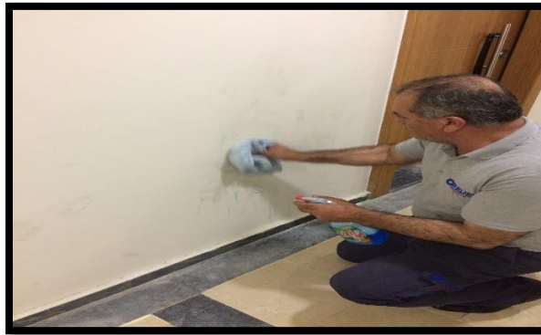
9.kat duvar temizliği yapılmıştır.