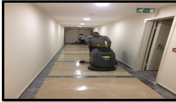
Kat koridorlarının makine ile temizliği yapılmıştır.