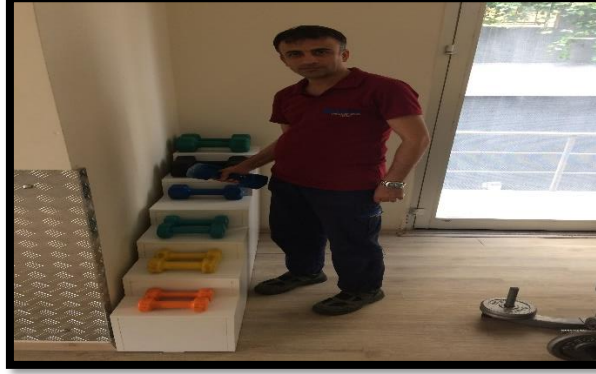
Fitnes salonu dambıl barı