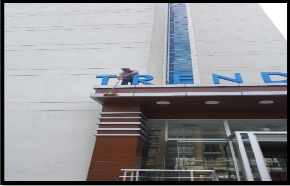
Giriş üstü kompozit temizliği