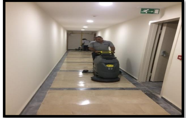
kat koridorlarının makine ile temizliği