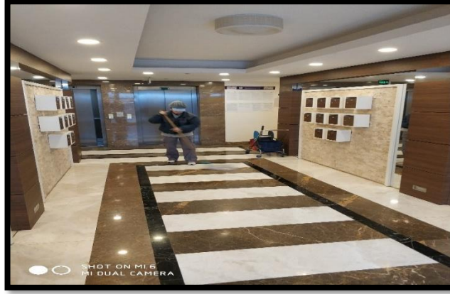
h. Blok giriş bölgesi, asansör ve kapılarının temizlenmesi,