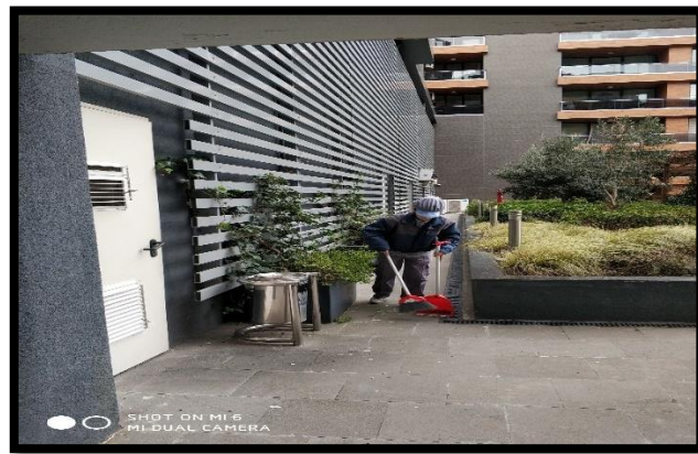
j. Genel dış temizlik,